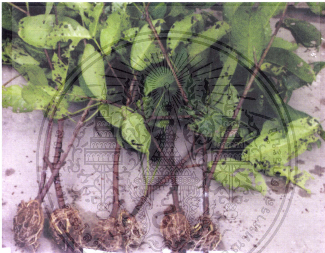
กิ่งส่วนบนของต้น กิ่งส่วนกลางของต้น กิ่งที่อยู่ใกล้โคนของต้น ภาพแสดงการออกรากของกิ่งตอนชมพู่เพชรสายรุ้งโดยวิธีการปักกิ่งก่อน 7 วัน

เอกสารนี้เป็นเอกสารที่สงวนไว้สำหรับการใช้งานเพื่อการศึกษาเท่านั้น ไม่อนุญาตให้นำไปใช้ประโยชน์ด้านการค้า ไม่ว่าจะกรณีใดๆ ทั้งสิ้น อีกทั้งห้ามมิให้ตัดแปลงเนื้อหา และต้องอ้างอิงถึงเจ้าของเอกสารทุกครั้งที่มีการนำไปใช้