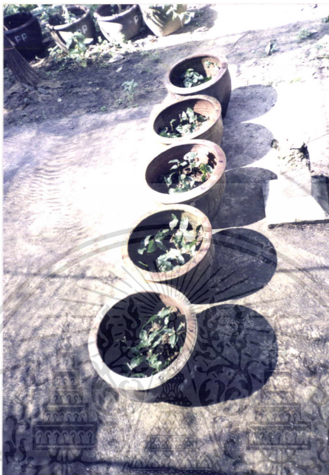
ภาพที่ 2 แสดงลักษณะของกิ่งปักชำมะลิซ้อนในกระถางมังกร

เอกสารนี้เป็นเอกสารที่สงวนไว้สำหรับการใช้งานเพื่อการศึกษาเท่านั้น ไม่อนุญาตให้นำไปใช้ประโยชน์ด้านการค้า ไม่ว่ากรณีใดๆ ทั้งสิ้น อีกทั้งห้ามมิให้ดัดแปลงเนื้อหา และต้องอ้างอิงถึงเจ้าของเอกสารทุกครั้งที่มีการนำไปใช้