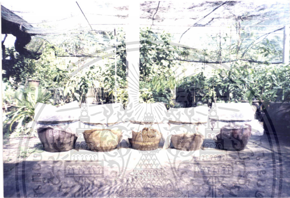
ภาพที่ 3 แสดงลักษณะของกระถางที่ปิดปากกระถางด้วยพลาสติก ที่ใช้ในการปักชำ