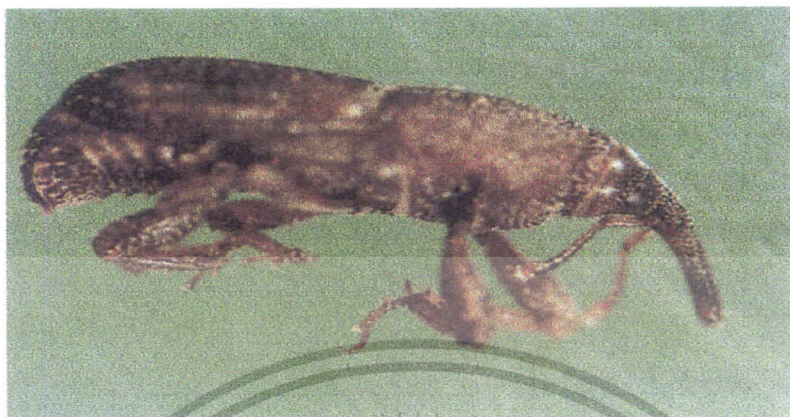
ภาพที่ 1 ตั๊กแตนข้าวโพด Sitophilus zeamais Motschulsky