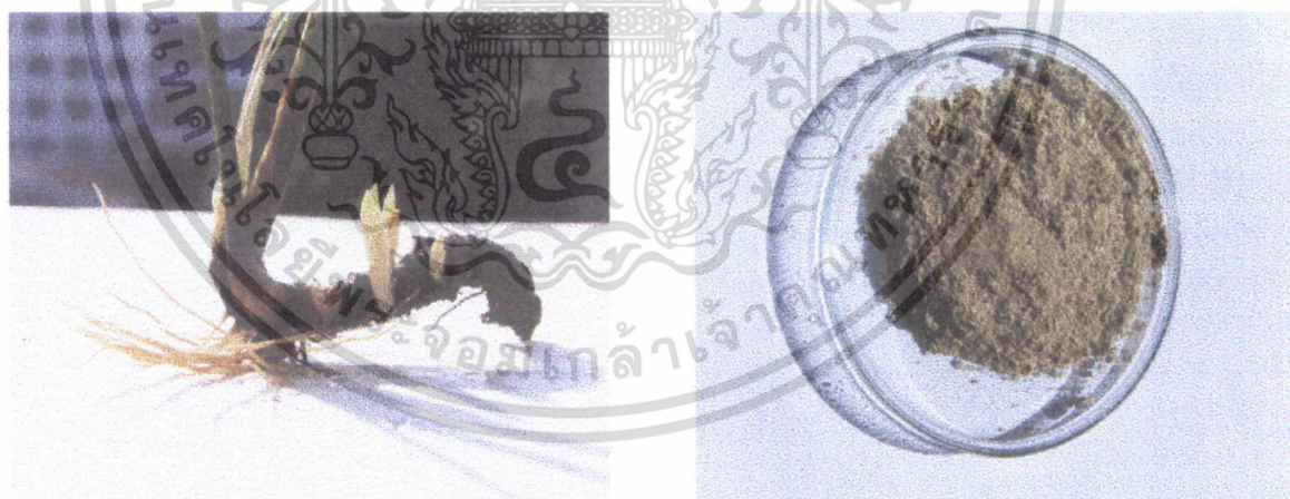
ภาพที่ 2 ว่านน้ำ (sweet flag)