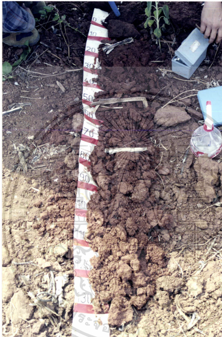
ภาพที่ 6 แสดงหน้าตัดดินที่ทำการศึกษาบริเวณที่ 4

เอกสารนี้เป็นเอกสารที่สงวนไว้สำหรับการใช้งานเพื่อการศึกษาเท่านั้น ไม่อนุญาตให้นำไปใช้ประโยชน์ด้านการค้าไม่ว่ากรณีใดๆ ทั้งสิ้น อีกทั้งห้ามมิให้ดัดแปลงเนื้อหา และต้องอ้างอิงถึงเจ้าของเอกสารทุกครั้งที่มีการนำไปใช้