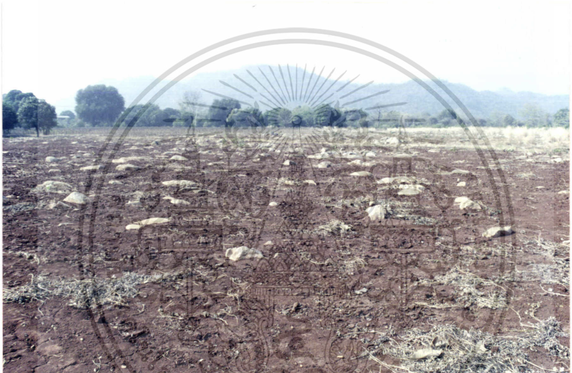
ภาพที่ 1 แสดงสภาพของพื้นที่ดินที่ทำการศึกษาระยะที่ 1

เอกสารนี้เป็นเอกสารที่สงวนไว้สำหรับการใช้งานเพื่อการศึกษาเท่านั้น ไม่อนุญาตให้นำไปใช้ประโยชน์ด้านการค้า ไม่ว่าจะกรณีใดๆ ทั้งสิ้น อีกทั้งห้ามมิให้ดัดแปลงเนื้อหา และต้องอ้างอิงถึงเจ้าของเอกสารทุกครั้งที่มีการนำไปใช้