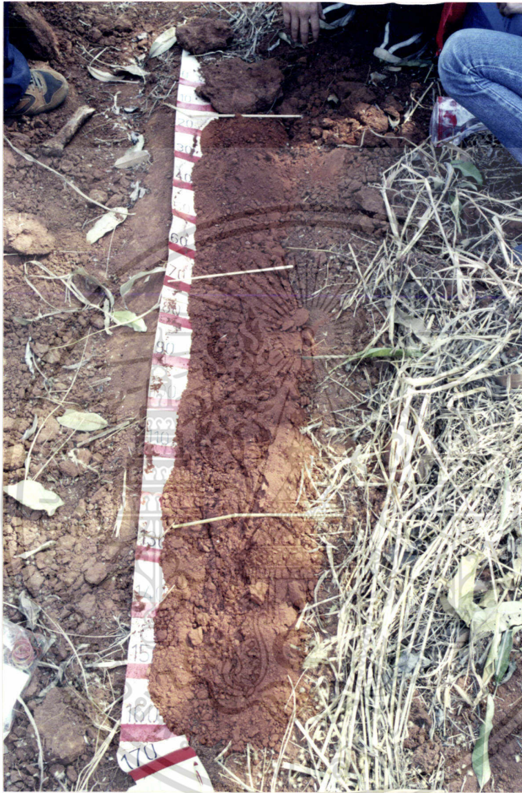
ภาพที่ 5 แสดงภาพหน้าตัดดินที่ทำการศึกษาบริเวณที่ 3

เอกสารนี้เป็นเอกสารที่สงวนไว้สำหรับการใช้งานเพื่อการศึกษาเท่านั้น ไม่อนุญาตให้นำไปใช้ประโยชน์ด้านการค้า ไม่ว่าจะกรณีใดๆ ทั้งสิ้น อีกทั้งห้ามมิให้ดัดแปลงเนื้อหา และต้องอ้างอิงถึงเจ้าของเอกสารทุกครั้งที่มีการนำไปใช้