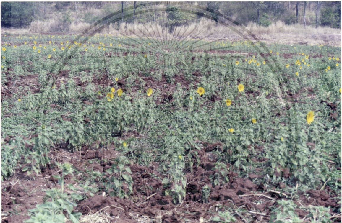
ภาพที่ 3 แสดงสภาพของพื้นที่ดินที่ทำการศึกษาวริเวณที่ 4

เอกสารนี้เป็นเอกสารที่สงวนไว้สำหรับการใช้งานเพื่อการศึกษาเท่านั้น ไม่อนุญาตให้นำไปใช้ประโยชน์ด้านการค้า ไม่ว่าจะกรณีใดๆ ทั้งสิ้น อีกทั้งห้ามมิให้ดัดแปลงเนื้อหา และต้องอ้างอิงถึงเจ้าของเอกสารทุกครั้งที่มีการนำไปใช้