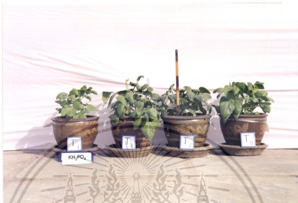
ภาพที่ 13 แสดงการเปรียบเทียบการเจริญเติบโตของถั่วฝักยาวใน T1, T4, T7, T8

ภาพที่ 13 แสดงการเปรียบเทียบการเจริญเติบโตของถั่วฝักยาวในตำรับที่ไม่ใส่ไนโตรเจนเลย (T1) กับตำรับที่ใส่ยูเรียและ Cell Cream ในอัตราที่เท่ากันคือ 32.2 %N /ไร่ กับตำรับที่ใส่ปุ๋ยเคมีตามสูตรที่เกษตรกรใช้ จะเห็นว่า ทุกตำรับที่ใส่ปุ๋ยไนโตรเจน ไม่ว่าจะเป็นการใส่ในรูปยูเรีย หรือ Cell Cream หรือปุ๋ยตามสูตรที่เกษตรกรใช้มีการเจริญเติบโตมากกว่าตำรับที่ไม่ใส่ปุ๋ยไนโตรเจนเลย และเมื่อเปรียบเทียบเฉพาะตำรับที่ใส่ปุ๋ยไนโตรเจนถึงแม้ว่าจะไม่แตกต่างกันมากนักแต่มีแนวโน้มว่าตำรับ T7 ( \text{KH}_2\text{PO}_4 + Cell Cream 322.4 กรัม / กระถาง) จะมีการเจริญเติบโตต่ำกว่าตำรับอื่นๆ