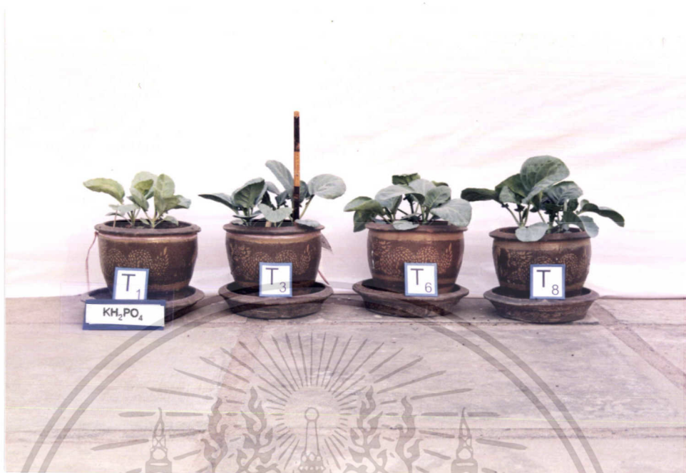
ภาพที่ 6 แสดงการเปรียบเทียบการเจริญเติบโตของคะน้าใน T1, T3, T6, T8

ภาพที่ 6 แสดงการเจริญเติบโตของคะน้าในตำรับที่ไม่มีไนโตรเจนเลย (T1) กับตำรับที่ใส่ยูเรียและ Cell Cream ในอัตราไนโตรเจนที่เท่ากับกับตำรับที่ใส่ปุ๋ยเคมีตามสูตรที่เกษตรกรใช้คือ 23 %N /ไร่ จะเห็นว่า ทุกตำรับที่ใส่ปุ๋ยไนโตรเจน ไม่ว่าจะเป็นการใส่ในรูปยูเรียหรือ Cell Cream หรือปุ๋ยตามสูตรที่เกษตรกรใช้ จะมีการเจริญเติบโตไม่แตกต่างกันมากนัก แต่จะมีการเจริญเติบโตมากกว่าตำรับที่ไม่มีปุ๋ยไนโตรเจนเลย