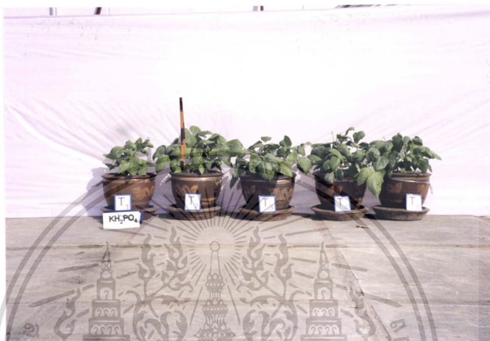
ภาพที่ 9 แสดงการเปรียบเทียบการเจริญเติบโตของถั่วฝักยาวใน T1, T2, T3, T4, T8

ภาพที่ 9 เปรียบเทียบการเจริญเติบโตของถั่วฝักยาวในตำรับที่ใส่เฉพาะ \text{KH}_2\text{PO}_4 กับตำรับที่ใส่ยูเรียในอัตราต่างๆ และตำรับที่ใส่ปุ๋ยตามสูตรที่เกษตรกรใช้ จะเห็นว่า ทุกตำรับที่ใส่ยูเรียและปุ๋ยเคมีตามสูตรที่เกษตรกรใช้มีการเจริญเติบโตมากกว่าตำรับที่ใส่เฉพาะ \text{KH}_2\text{PO}_4 และเมื่อเปรียบเทียบเฉพาะตำรับที่ใส่ปุ๋ยไนโตรเจนถึงแม้ว่าจะไม่แตกต่างกันมากนัก