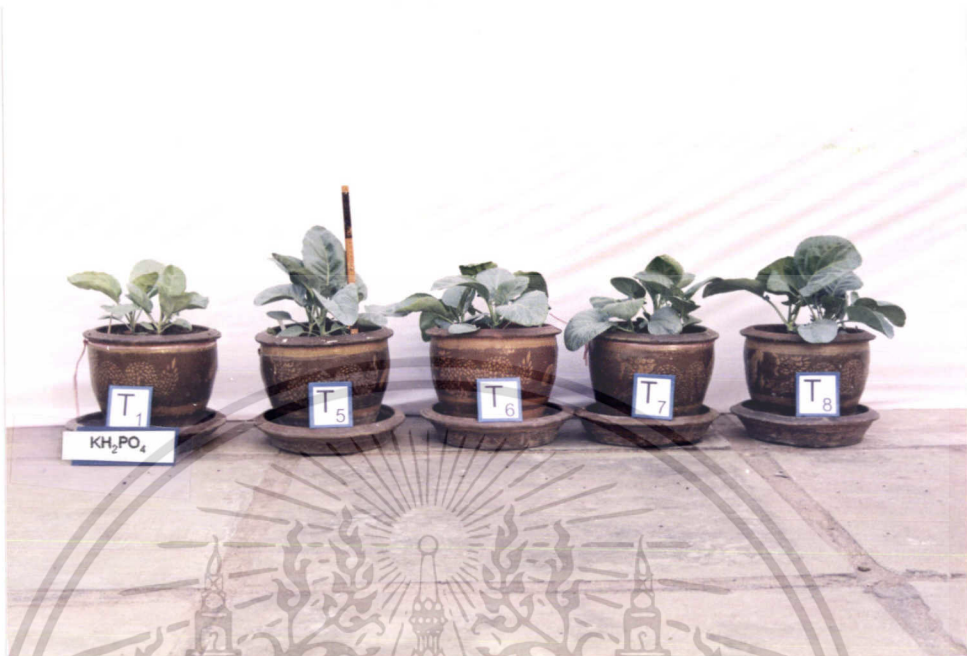
ภาพที่ 4 แสดงการเปรียบเทียบการเจริญเติบโตของคะน้ำใน T1, T5, T6, T7, T8

ภาพที่ 4 แสดงลักษณะการเจริญเติบโตเชิงลำต้นและใบของตำรับที่ใส่เฉพาะ \text{KH}_2\text{PO}_4 กับตำรับที่ใส่ Cell Cream ในอัตราต่างๆ และตำรับที่ใส่ปุ๋ยเคมีตามสูตรที่เกษตรกรใช้ จะเห็นว่าทุกตำรับที่มีการใส่ปุ๋ยที่มีธาตุอาหารหลักครบมีการเจริญเติบโตดีกว่าตำรับที่ใส่เฉพาะ \text{KH}_2\text{PO}_4 อย่างไรก็ตามเมื่อพิจารณาเฉพาะตำรับที่มีการใส่ปุ๋ยสูตรครบแล้ว พบว่าตำรับ T7 ( \text{KH}_2\text{PO}_4 + Cell Cream 230.4 กรัม / กระถาง) มีแนวโน้มที่จะมีการเจริญเติบโตน้อยกว่าตำรับอื่นๆอยู่บ้าง ทั้งนี้สังเกตจากขนาดของลำต้นที่เล็กกว่าตำรับอื่นๆนั่นเอง