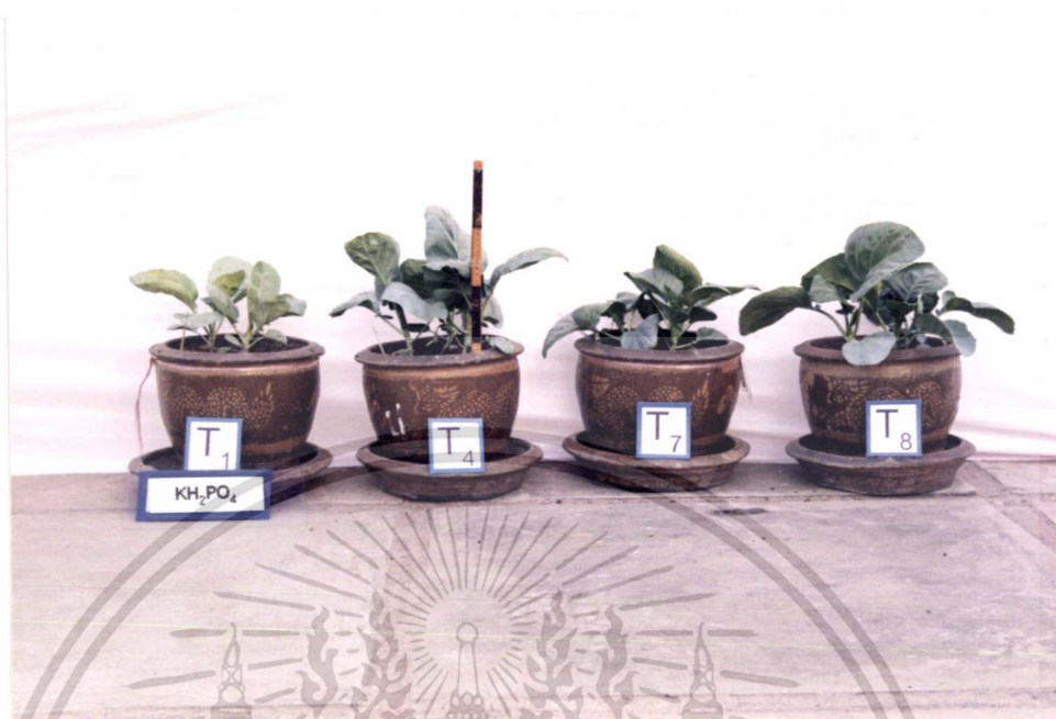
ภาพที่ 7 แสดงการเปรียบเทียบการเจริญเติบโตของคะน้าใน T1, T4, T7, T8

ภาพที่ 7 แสดงการเปรียบเทียบการเจริญเติบโตของคะน้าในตำรับที่ไม่ใส่ไนโตรเจนเลย (T1) กับตำรับที่ใส่ยูเรียและ Cell Cream ในอัตราที่เท่ากันคือ 32.2 %N / ไร่ กับตำรับที่ใส่ปุ๋ยเคมีตามสูตรที่เกษตรกรใช้ จะเห็นว่า ทุกตำรับที่ใส่ปุ๋ยไนโตรเจน ไม่ว่าจะเป็นการใส่ในรูปยูเรียหรือ Cell Cream หรือปุ๋ยตามสูตรที่เกษตรกรใช้มีการเจริญเติบโตมากกว่าตำรับที่ไม่มีปุ๋ยไนโตรเจนเลย และเมื่อเปรียบเทียบเฉพาะตำรับที่ใส่ปุ๋ยไนโตรเจนถึงแม้ว่าจะไม่แตกต่างกันมากนักแต่มีแนวโน้มว่าตำรับ T7 ( \text{KH}_2\text{PO}_4 + Cell Cream 322.4 กรัม / กระจ่าง) จะมีการเจริญเติบโตต่ำกว่าตำรับอื่นๆ