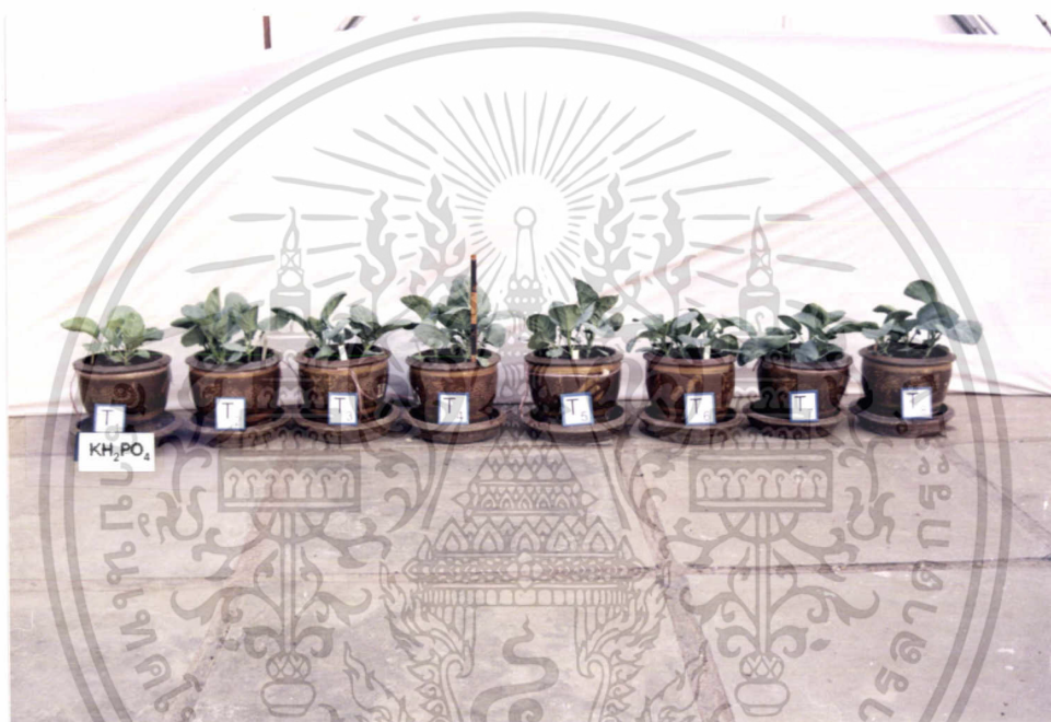
ภาพที่ 2 แสดงการเปรียบเทียบการเจริญเติบโตของคะน้าในแต่ละตำรับ

ภาพที่ 2 – 7 แสดงลักษณะการเจริญเติบโตของคะน้าในทุกตำรับที่ใส่ปุ๋ยหลังจากย้ายปลอกได้ 20 วัน (ทุกภาพจะไม่มีตำรับ Control หรือ T0 ซึ่งไม่ได้ใส่อะไรเลย)