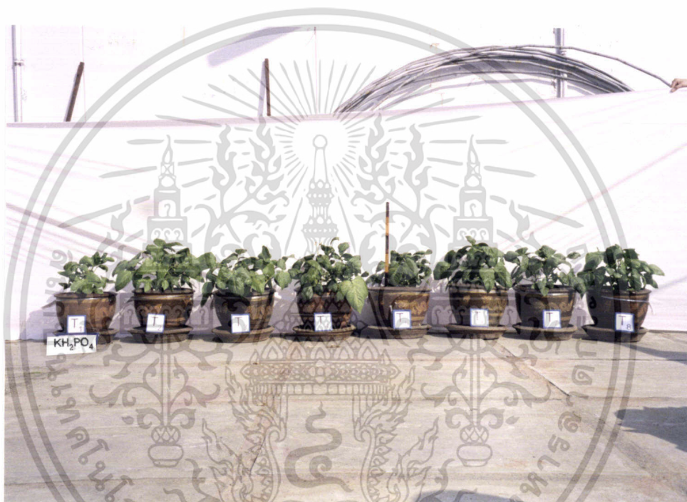
ภาพที่ 8 แสดงการเปรียบเทียบการเจริญเติบโตของถั่วฝักยาวในแต่ละตำรับ

ภาพที่ 8 – 13 แสดงลักษณะการเจริญเติบโตของถั่วฝักยาวในทุกตำรับที่ใส่ปุ๋ยหลังจากย้ายปลูกได้ 20 วัน (ทุกภาพจะไม่มีตำรับ Control หรือ T0 ซึ่งไม่ได้ใส่อะไรเลย)