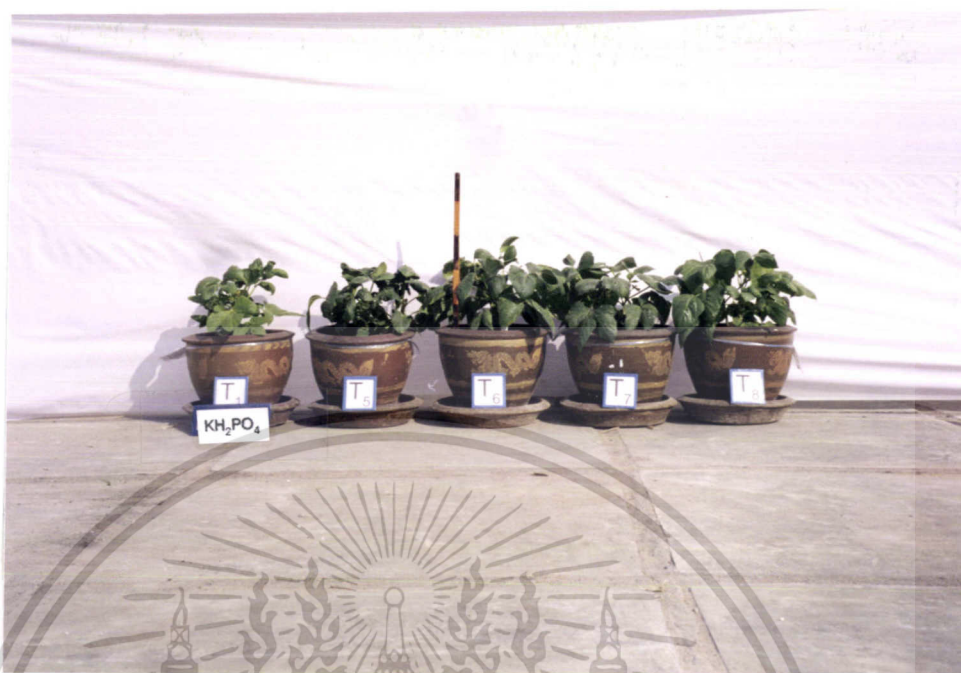
ภาพที่ 10 แสดงการเปรียบเทียบการเจริญเติบโตของถั่วฝักยาวใน T1, T5, T6, T7, T8

ภาพที่ 10 แสดงลักษณะการเจริญเติบโตเชิงลำต้นและใบของตำรับที่ใส่เฉพาะ \text{KH}_2\text{PO}_4 กับตำรับที่ใส่ Cell Cream ในอัตราต่างๆ และตำรับที่ใส่ปุ๋ยเคมีตามสูตรที่เกษตรกรใช้ จะเห็นว่าทุกตำรับที่มีการใส่ปุ๋ยที่มีธาตุอาหารหลักครบมีการเจริญเติบโตดีกว่าตำรับที่ใส่เฉพาะ \text{KH}_2\text{PO}_4 อย่างไรก็ตามเมื่อพิจารณาเฉพาะตำรับที่มีการใส่ปุ๋ยสูตรครบแล้ว พบว่าตำรับ T5 ( \text{KH}_2\text{PO}_4 + Cell Cream 138.1 กรัม / กระถาง) มีแนวโน้มที่จะมีการเจริญเติบโตน้อยกว่าตำรับอื่นๆอยู่บ้าง ทั้งนี้สังเกตจากขนาดของลำต้นที่เล็กกว่าตำรับอื่นนั่นเอง