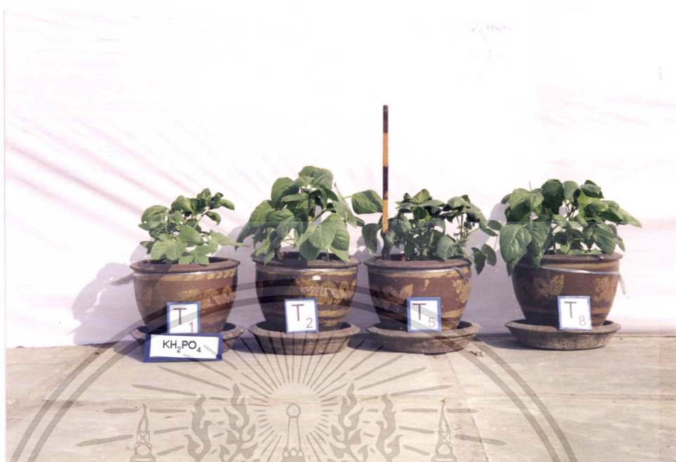
ภาพที่ 11 แสดงการเปรียบเทียบการเจริญเติบโตของถั่วฝักยาวใน T1, T2, T5, T8

ภาพที่ 11 แสดงการเจริญเติบโตของถั่วฝักยาวในตำรับที่ไม่ได้รับไนโตรเจนเลย (T1) กับตำรับที่ใส่ยูเรียและ Cell Cream ซึ่งมีไนโตรเจนในอัตราที่เท่ากันคือ 13.8 %N /ไร่ และตำรับที่ใส่ปุ๋ยตามสูตรที่เกษตรกรใช้ จะเห็นว่าทุกตำรับที่ใส่ปุ๋ยไนโตรเจนรูปยูเรียและปุ๋ยตามสูตรที่เกษตรกรใช้ จะมีการเจริญเติบโตไม่แตกต่างกันมากนัก แต่จะมีการเจริญเติบโตมากกว่าตำรับ T5 ( \text{KH}_2\text{PO}_4 + Cell Cream 138.1 กรัม / กระถาง) และตำรับที่ไม่มีปุ๋ยไนโตรเจนเลย