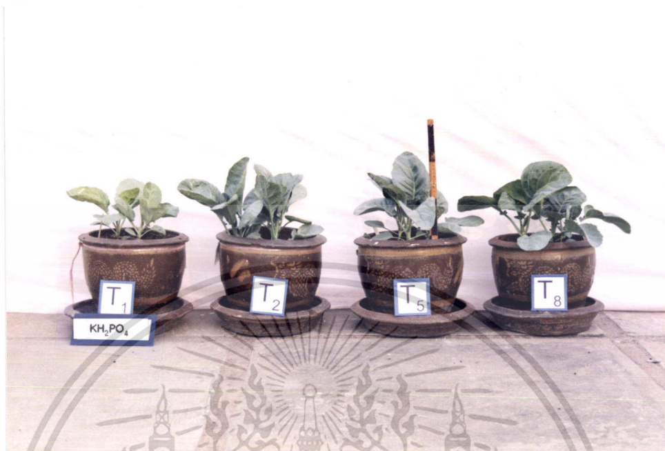
ภาพที่ 5 แสดงการเปรียบเทียบการเจริญเติบโตของคะน้าใน T1, T2, T5, T8

ภาพที่ 5 แสดงการเจริญเติบโตของคะน้าในตำรับที่ไม่ได้รับไนโตรเจนเลย (T1) กับตำรับที่ใส่ยูเรียและ Cell Cream ซึ่งมีไนโตรเจนในอัตราที่เท่ากันคือ 13.8 %N /ไร่ และตำรับที่ใส่ปุ๋ยตามสูตรที่เกษตรกรใช้ จะเห็นว่าทุกตำรับที่ใส่ปุ๋ยไนโตรเจน ไม่ว่าจะเป็นการใส่ในรูปยูเรียหรือ Cell Cream หรือปุ๋ยตามสูตรที่เกษตรกรใช้ จะมีการเจริญเติบโตไม่แตกต่างกันมากนัก แต่จะมีการเจริญเติบโตมากกว่าตำรับที่ไม่มีปุ๋ยไนโตรเจนเลย