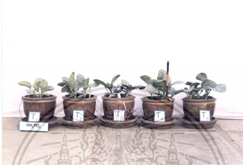
ภาพที่ 3 แสดงการเปรียบเทียบการเจริญเติบโตของคะน้าใน T1, T2, T3, T4, T8

ภาพที่ 3 แสดงลักษณะการเจริญเติบโตในทางลำต้นและใบของตำรับที่ใส่ปุ๋ยยูเรียในอัตราต่างๆ และตำรับที่ใส่ปุ๋ยตามสูตรที่เกษตรกรใช้ กับตำรับที่ใส่เฉพาะ \text{KH}_2\text{PO}_4 นั้น พบว่าตำรับที่ใส่ยูเรียและปุ๋ยตามสูตรที่เกษตรกรใช้มีการเจริญเติบโตมากกว่าตำรับที่ใส่เฉพาะ \text{KH}_2\text{PO}_4 ในขณะเดียวกันก็พบว่าในตำรับที่ T3 ( \text{KH}_2\text{PO}_4 + \text{Urea} 9.6 กรัม/กระถาง ) มีแนวโน้มที่จะเจริญเติบโตแตกต่างจากตำรับอื่นๆ ทั้งนี้สังเกตจากลำต้นที่มีขนาดเล็กกว่า