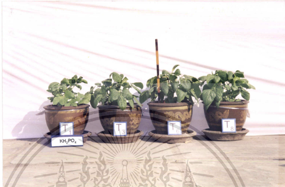
ภาพที่ 12 แสดงการเปรียบเทียบการเจริญเติบโตของถั่วฝักยาวใน T1, T3, T6, T8

ภาพที่ 12 แสดงการเจริญเติบโตของคะน้าในตำรับที่ไม่ใส่ไนโตรเจนเลย (T1) กับตำรับที่ใส่ยูเรียและ Cell Cream ในอัตราไนโตรเจนที่เท่ากันคือ 23 %N /ไร่ กับตำรับที่ใส่ปุ๋ยเคมีตามสูตรที่เกษตรกรใช้ จะเห็นว่า ทุกตำรับที่ใส่ปุ๋ยไนโตรเจน ไม่ว่าจะเป็นการใส่ในรูปยูเรียหรือ Cell Cream หรือปุ๋ยตามสูตรที่เกษตรกรใช้ จะมีการเจริญเติบโตไม่แตกต่างกันมากนัก แต่จะมีการเจริญเติบโตมากกว่าตำรับที่ไม่มีปุ๋ยไนโตรเจนเลย