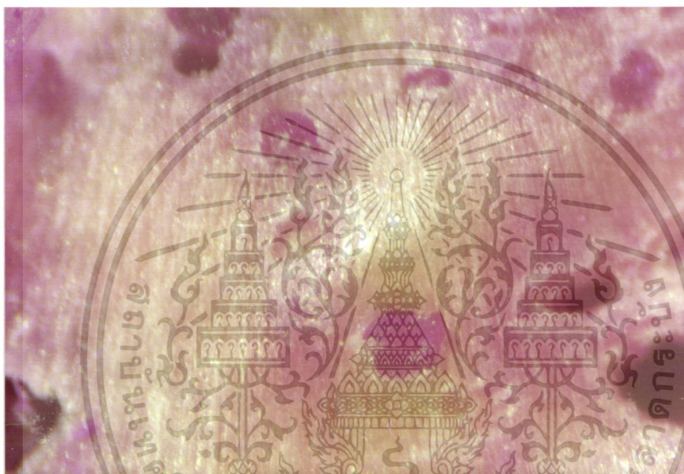
ภาพที่ 9 แสดงรอยการวางไข่ โดยคิ้วงวงข้าวโพดจะปล่อยสารปฏิรูปที่วางไข่ไว้เรียกว่า egg plug

เอกสารนี้เป็นเอกสารที่สงวนไว้สำหรับการใช้งานเพื่อการศึกษาเท่านั้น ไม่อนุญาตให้นำไปใช้ประโยชน์ด้านการค้า ไม่ว่ากรณีใดๆ ทั้งสิ้น อีกทั้งห้ามมิให้ดัดแปลงเนื้อหา และต้องอ้างอิงถึงเจ้าของเอกสารทุกครั้งที่มีการนำไปใช้