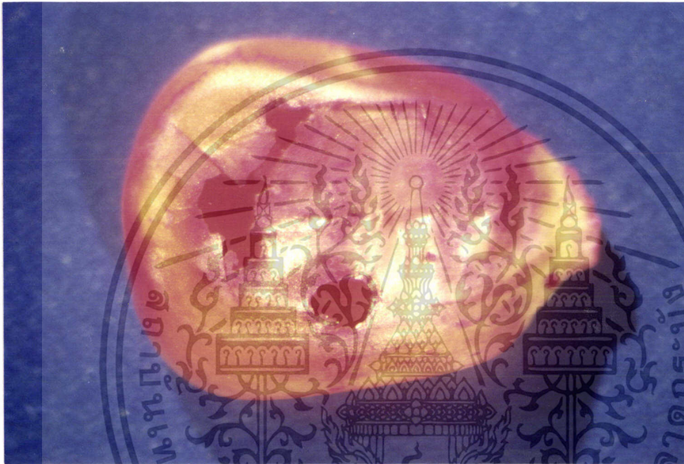
ภาพที่ 13 แสดงเมล็ดข้าวโพดหลังถูกด้วงงวงข้าวโพดเข้าทำลาย

เอกสารนี้เป็นเอกสารที่สงวนไว้สำหรับการใช้งานเพื่อการศึกษาเท่านั้น ไม่อนุญาตให้นำไปใช้ประโยชน์ด้านการค้า ไม่ว่ากรณีใดๆ ทั้งสิ้น อีกทั้งห้ามมิให้ดัดแปลงเนื้อหา และต้องอ้างอิงถึงเจ้าของเอกสารทุกครั้งที่มีการนำไปใช้