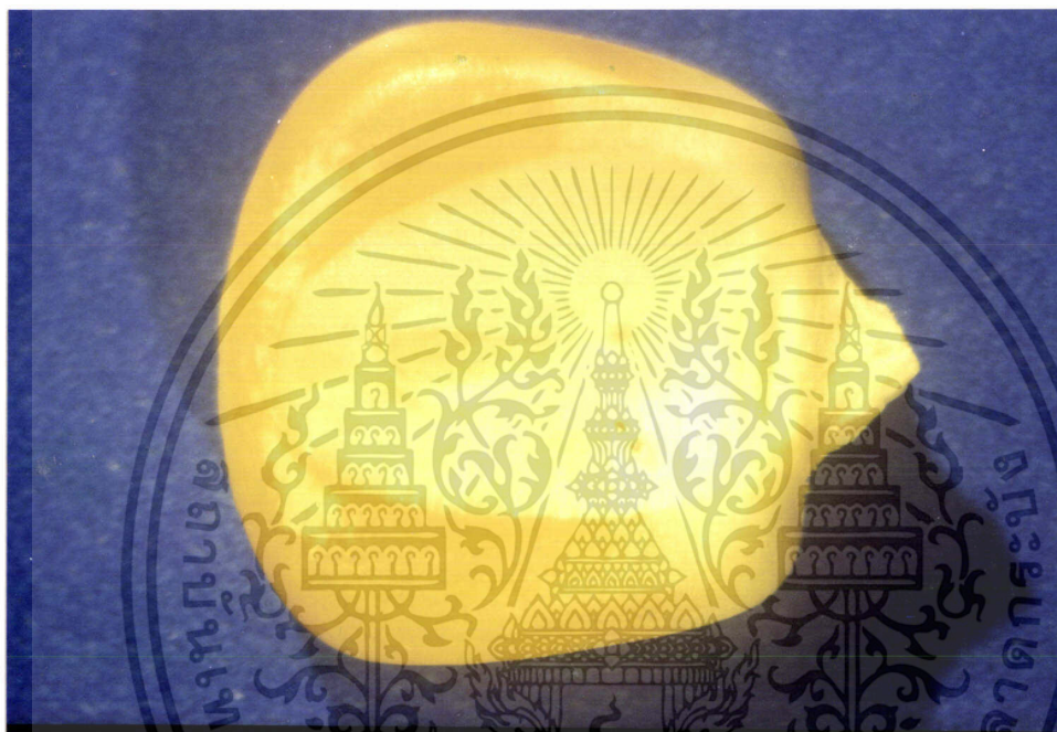
ภาพที่ 12 แสดงเมล็ดข้าวโพดก่อนถูกดัดแปลงข้าวโพดเข้าทำลาย

เอกสารนี้เป็นเอกสารที่สงวนไว้สำหรับการใช้งานเพื่อการศึกษาเท่านั้น ไม่อนุญาตให้นำไปใช้ประโยชน์ด้านการค้า ไม่ว่ากรณีใดๆ ทั้งสิ้น อีกทั้งห้ามมิให้ดัดแปลงเนื้อหา และต้องอ้างอิงถึงเจ้าของเอกสารทุกครั้งที่มีการนำไปใช้