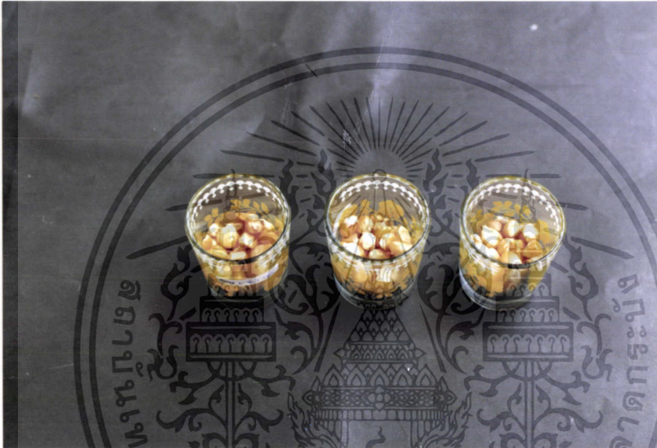
ภาพที่ 3 แสดงการเตรียมการทดลองใส่เมล็ดข้าวโพดในขวดแก้วปากกว้าง

เอกสารนี้เป็นเอกสารที่สงวนไว้สำหรับการใช้งานเพื่อการศึกษาเท่านั้น ไม่อนุญาตให้นำไปใช้ประโยชน์ด้านการค้า ไม่ว่ากรณีใดๆ ทั้งสิ้น อีกทั้งห้ามมิให้ดัดแปลงเนื้อหา และต้องอ้างอิงถึงเจ้าของเอกสารทุกครั้งที่มีการนำไปใช้