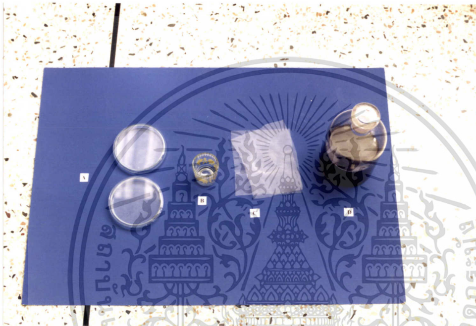
ภาพที่ 14 แสดงอุปกรณ์ต่างๆ ในการทดลอง