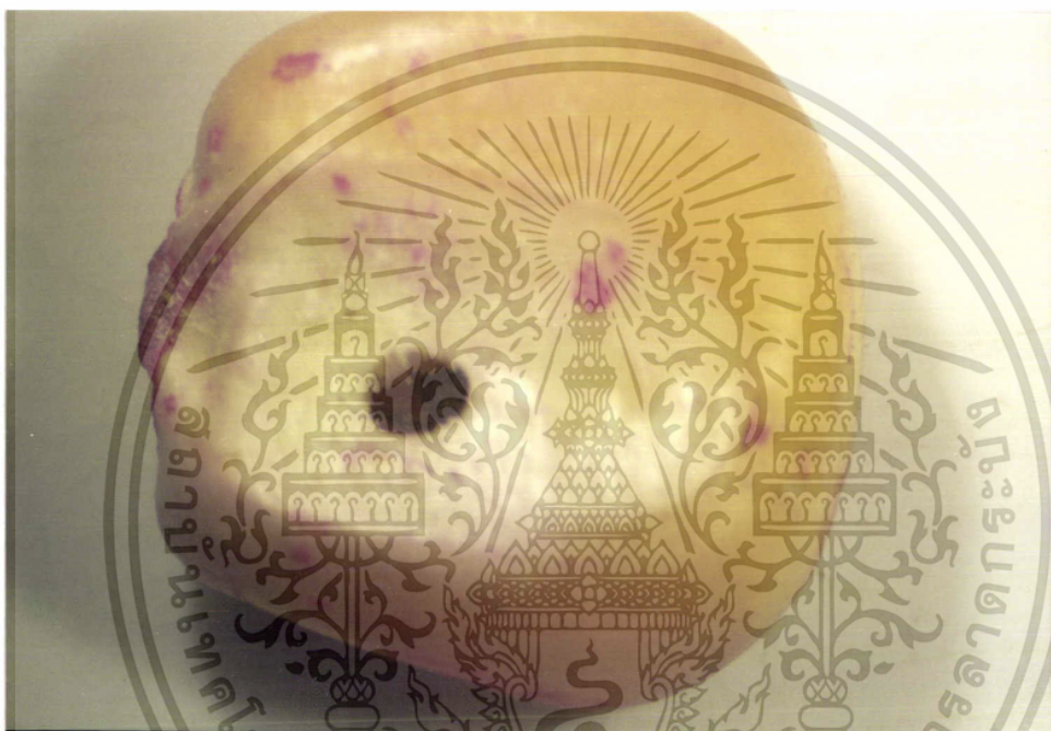
ภาพที่ ๗ แสดงรอยเจาะของด้วงงวงข้าวโพดเพื่อเข้าไปอาศัยกักกินอยู่ภายในเมล็ด

เอกสารนี้เป็นเอกสารที่สงวนไว้สำหรับการใช้งานเพื่อการศึกษาเท่านั้น ไม่อนุญาตให้นำไปใช้ประโยชน์ด้านการค้า ไม่ว่ากรณีใดๆ ทั้งสิ้น อีกทั้งห้ามมิให้ดัดแปลงเนื้อหา และต้องอ้างอิงถึงเจ้าของเอกสารทุกครั้งที่มีการนำไปใช้