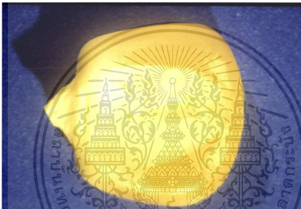
ภาพที่ 1 แสดงลักษณะของเม็ล็คพันธุข้าวโพดที่สมบูรณ์

เอกสารนี้เป็นเอกสารที่สงวนไว้สำหรับการใช้งานเพื่อการศึกษาเท่านั้น ไม่อนุญาตให้นำไปใช้ประโยชน์ด้านการค้า ไม่ว่ากรณีใดๆ ทั้งสิ้น อีกทั้งห้ามมิให้ดัดแปลงเนื้อหา และต้องอ้างอิงถึงเจ้าของเอกสารทุกครั้งที่มีการนำไปใช้