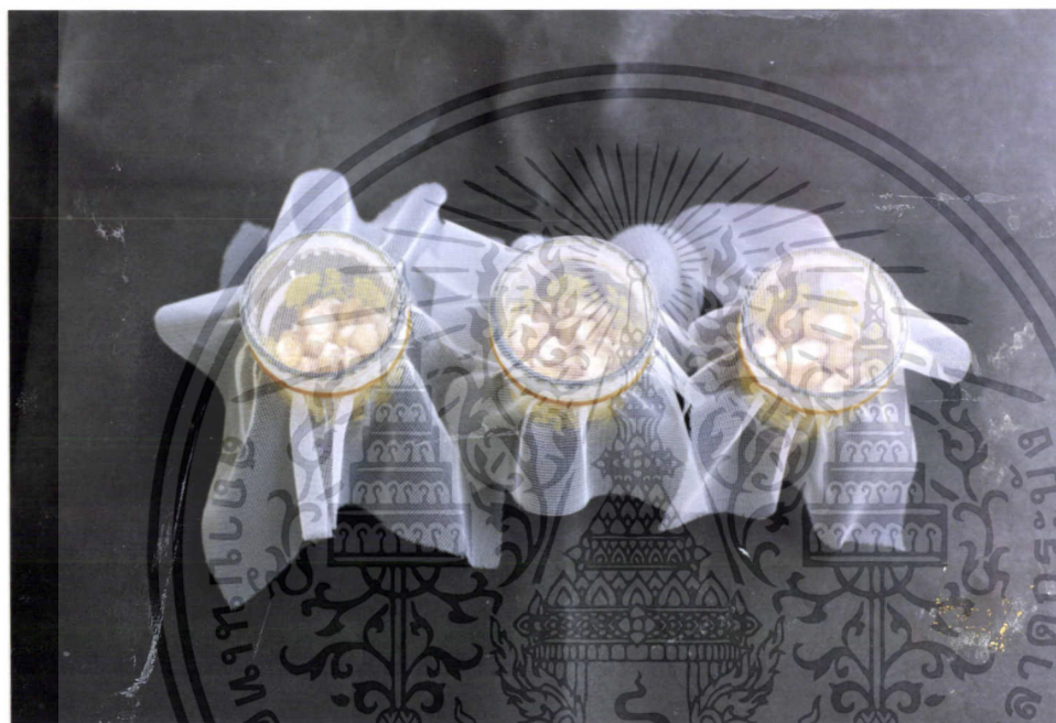
ภาพที่ 4 แสดงการปิดปากขวดแก้วด้วยผ้าขาวบาง

เอกสารนี้เป็นเอกสารที่สงวนไว้สำหรับการใช้งานเพื่อการศึกษาเท่านั้น ไม่อนุญาตให้นำไปใช้ประโยชน์ด้านการค้า ไม่ว่ากรณีใดๆ ทั้งสิ้น อีกทั้งห้ามมิให้ดัดแปลงเนื้อหา และต้องอ้างอิงถึงเจ้าของเอกสารทุกครั้งที่มีการนำไปใช้