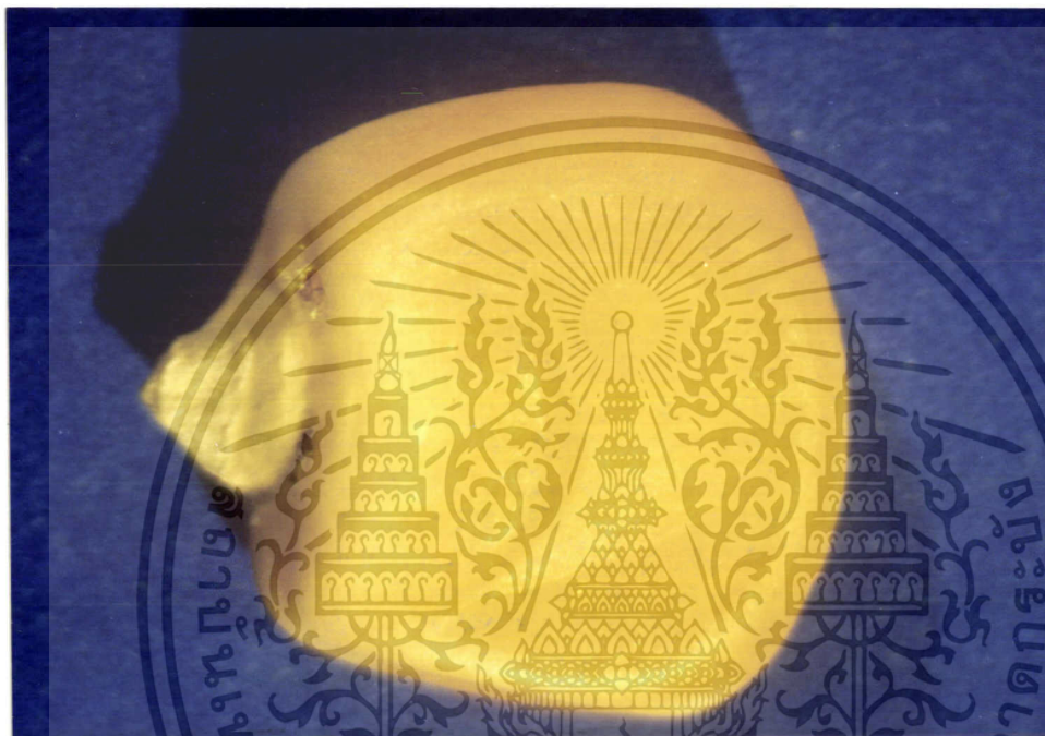
ภาพที่ ๑ แสดงลักษณะของเมล็ดพันธุ์ข้าวโพดที่สมบูรณ์

เอกสารนี้เป็นเอกสารที่สงวนไว้สำหรับการใช้งานเพื่อการศึกษาเท่านั้น ไม่อนุญาตให้นำไปใช้ประโยชน์ด้านการค้า ไม่ว่ากรณีใดๆ ทั้งสิ้น อีกทั้งห้ามมิให้ดัดแปลงเนื้อหา และต้องอ้างอิงถึงเจ้าของเอกสารทุกครั้งที่มีการนำไปใช้