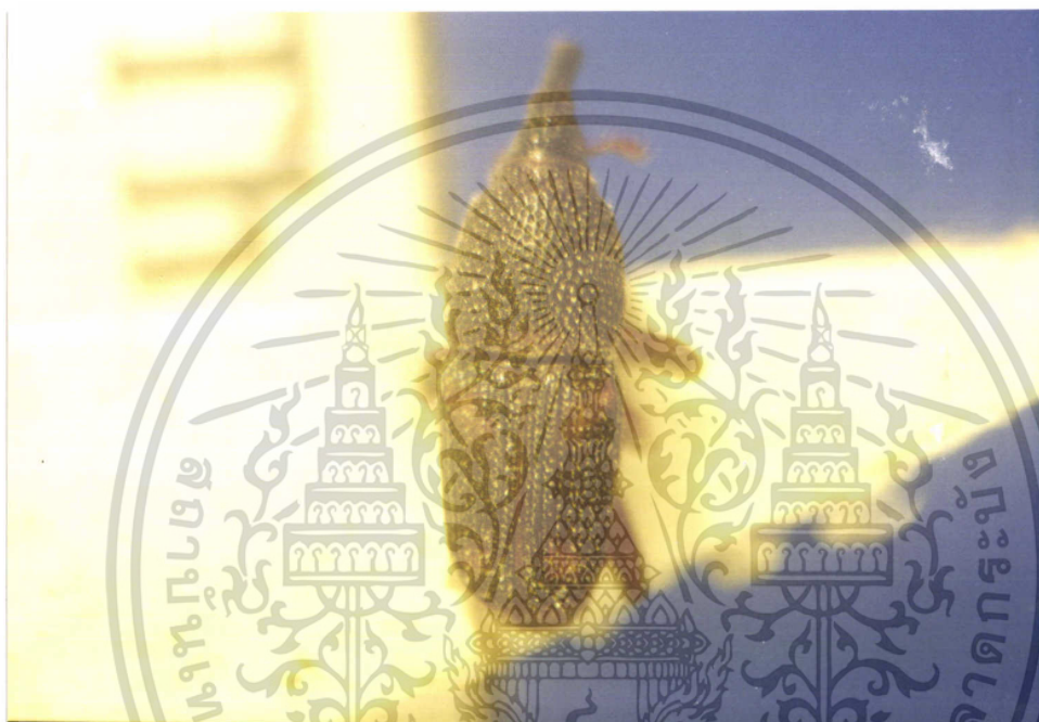
ภาพที่ 5 แสดงลักษณะตัวเต็มวัยของคิ้ววงวงข้าวโพด

เอกสารนี้เป็นเอกสารที่สงวนไว้สำหรับการใช้งานเพื่อการศึกษาเท่านั้น ไม่อนุญาตให้นำไปใช้ประโยชน์ด้านการค้า ไม่ว่ากรณีใดๆ ทั้งสิ้น อีกทั้งห้ามมิให้ดัดแปลงเนื้อหา และต้องอ้างอิงถึงเจ้าของเอกสารทุกครั้งที่มีการนำไปใช้