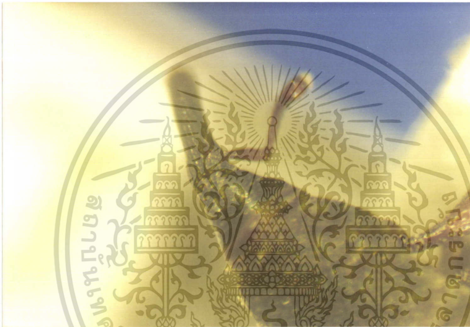
ภาพที่ 6 แสดงลักษณะตัวเต็มวัยของด้วงวงข้าวโพดเพศผู้

เอกสารนี้เป็นเอกสารที่สงวนไว้สำหรับการใช้งานเพื่อการศึกษาเท่านั้น ไม่อนุญาตให้นำไปใช้ประโยชน์ด้านการค้า ไม่ว่ากรณีใดๆ ทั้งสิ้น อีกทั้งห้ามมิให้ดัดแปลงเนื้อหา และต้องอ้างอิงถึงเจ้าของเอกสารทุกครั้งที่มีการนำไปใช้