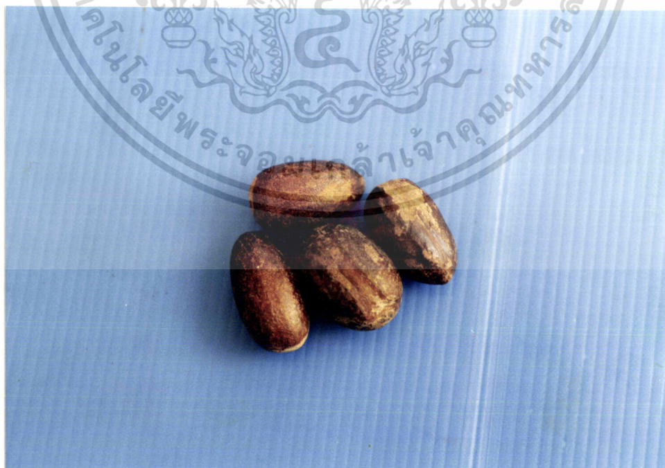
ภาพที่ 6 ลูกจันทน์เทศ ( Myristica fragrans Hoett.: Myristicaceae)

เอกสารนี้เป็นเอกสารที่สงวนไว้สำหรับการใช้งานเพื่อการศึกษาเท่านั้น ไม่อนุญาตให้นำไปใช้ประโยชน์ด้านการค้า ไม่ว่ากรณีใดๆ ทั้งสิ้น อีกทั้งห้ามมิให้ตัดแปลงเนื้อหา และต้องอ้างอิงถึงเจ้าของเอกสารทุกครั้งที่มีการนำไปใช้