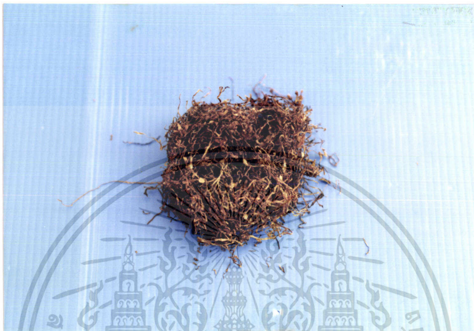
ภาพที่ 5 ยาสูบ ( Nicotinum tabaccum Linn.: Solanaceae)