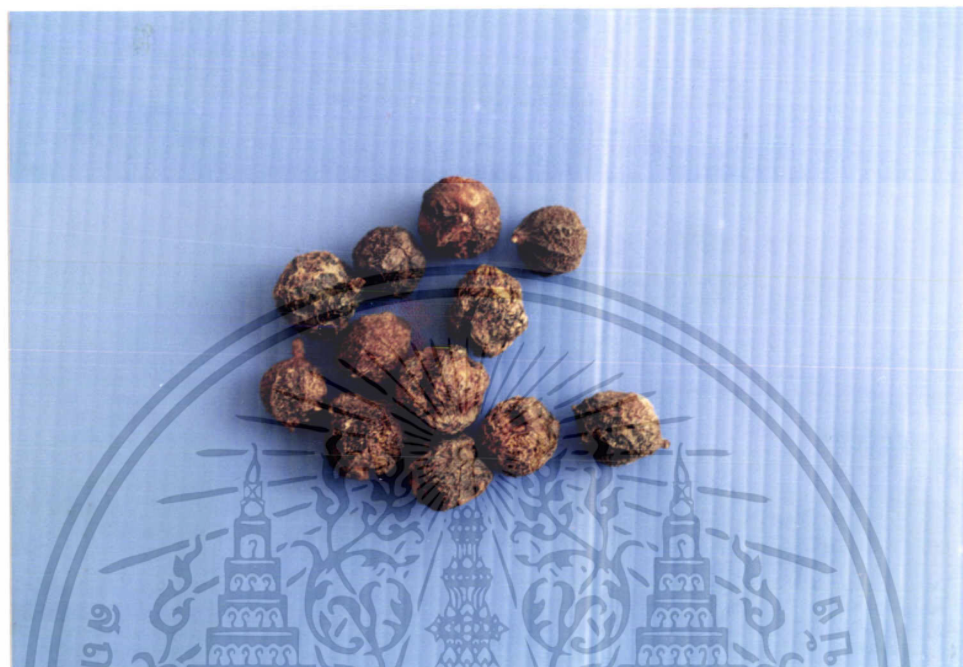
ภาพที่ 3 มะขามป้อม ( Phyllanthus emblica Linn.: Euphorbiaceae)