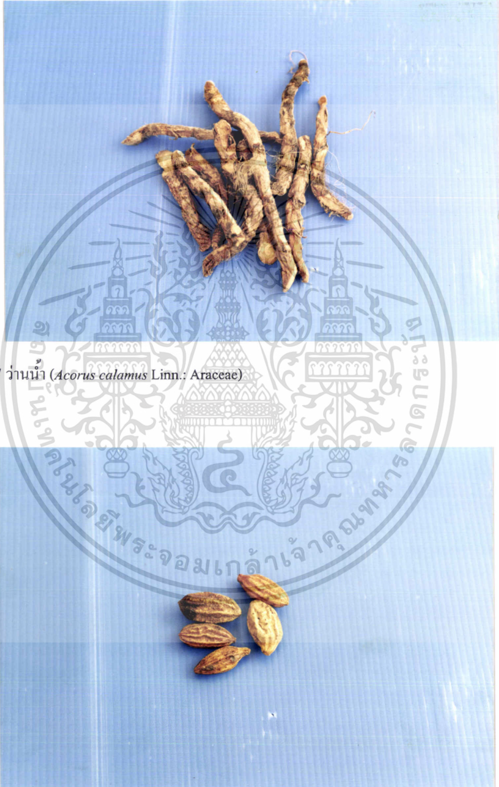
ภาพที่ 7 ว่านน้ำ ( Acorus calamus Linn.: Araceae)