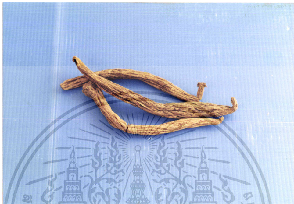
ภาพที่ 9 หนอนตายหยาก ( Stemona collinsae Craib.: Stemonaceae)