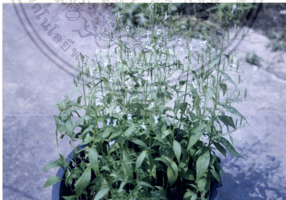
ภาพที่ 2 ฟ้าทะลายโจร ( Andrographis paniculata (Burn. F.) Nees.: Acanthaceae)

เอกสารนี้เป็นเอกสารที่สงวนไว้สำหรับการใช้งานเพื่อการศึกษาเท่านั้น ไม่อนุญาตให้นำไปใช้ประโยชน์ด้านการค้า ไม่ว่ากรณีใดๆ ทั้งสิ้น อีกทั้งห้ามมิให้ตัดแปลงเนื้อหา และต้องอ้างอิงถึงเจ้าของเอกสารทุกครั้งที่มีการนำไปใช้