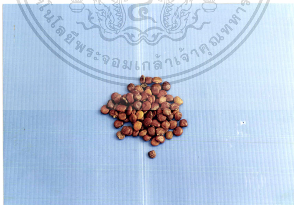
ภาพที่ 4 มันแกว ( Pachyrhizus erosus (Linn.) Urb.: Leguminosae)

เอกสารนี้เป็นเอกสารที่สงวนลิขสิทธิ์ไว้เพื่อการศึกษาเท่านั้น ไม่นิยมนำไปใช้ประโยชน์ด้านการค้า ไม่ว่ากรณีใดๆ ทั้งสิ้น อีกทั้งห้ามมิให้ตัดแปลงเนื้อหา และต้องอ้างอิงถึงเจ้าของเอกสารทุกครั้งที่มีการนำไปใช้