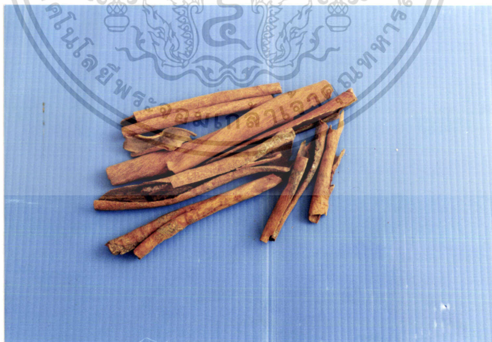
ภาพที่ 10 อบเชย ( Cinnamomum verom J.&Presl.: Lauraceae)

เอกสารนี้เป็นเอกสารที่สงวนไว้สำหรับการใช้งานเพื่อการศึกษาเท่านั้น ไม่อนุญาตให้นำไปใช้ประโยชน์ด้านการค้า ไม่ว่ากรณีใดๆ ทั้งสิ้น อีกทั้งห้ามมิให้ตัดแปลงเนื้อหา และต้องอ้างอิงถึงเจ้าของเอกสารทุกครั้งที่มีการนำไปใช้