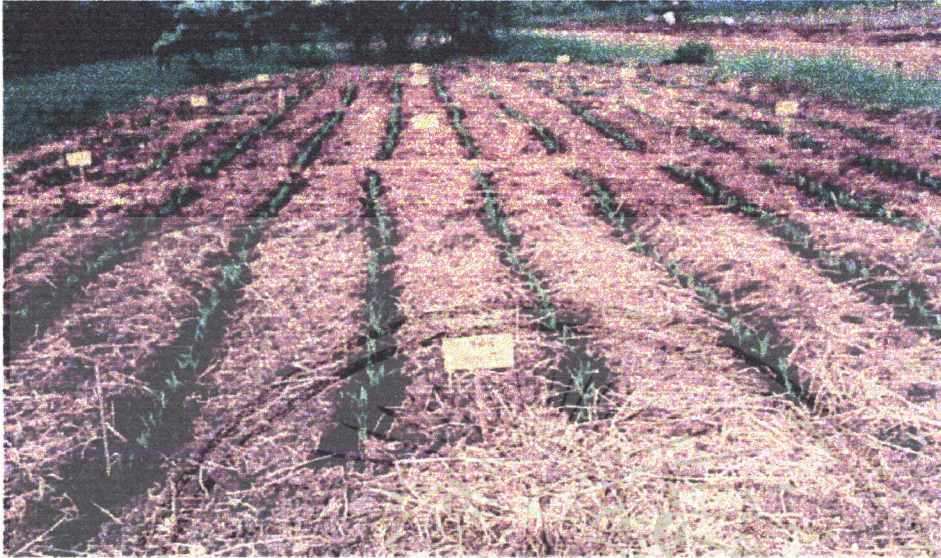
ภาพที่ 1 การเจริญเติบโตของข้าวโพดข้าวเหนียวขาวเมื่ออายุ 1 สัปดาห์หลังปลูก

เอกสารนี้เป็นเอกสารที่สงวนไว้สำหรับการใช้งานเพื่อการศึกษาเท่านั้น ไม่อนุญาตให้นำไปใช้ประโยชน์ด้านการค้า ไม่ว่ากรณีใดๆ ทั้งสิ้น อีกทั้งห้ามมิให้ตัดแปลงเนื้อหา และต้องอ้างอิงถึงเจ้าของเอกสารทุกครั้งที่มีการนำไปใช้