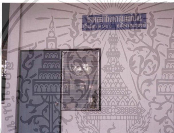
ภาพที่ 9 โรงทอผ้าไหมของกลุ่มแม่บ้านเกษตรกร บ้านปะอาว

ครัวเรือนทอผ้าไหม เป็นการทอผ้าไหมแบบพื้นบ้านเพื่อใช้ในครัวเรือนและเพื่อจำหน่าย โดยเกษตรกรจะรวมกลุ่มกันเป็นกลุ่มแม่บ้านทำการทอผ้าไหมเพื่อการจำหน่าย โดยใช้เวลาวางจากงานเกษตร ซึ่งในหมู่บ้านจะมีโรงทอผ้าของกลุ่มเอง (ภาพที่ 9) ผ้าไหมที่เกษตรกรแต่ละคนทอสำเร็จจะส่งให้กลุ่มเป็นตัวแทนจำหน่าย โดยนำมาเก็บไว้ในศูนย์แสดงผ้าไหมของหมู่บ้านเพื่อจำหน่ายให้กับลูกค้าที่เข้ามาซื้อโดยตรง