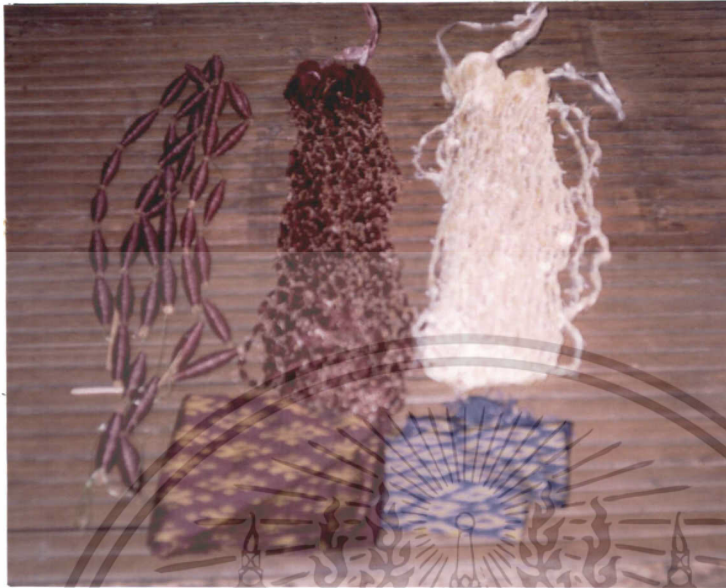
ภาพที่ 10 เส้นไหมมัดหมี่ที่ผ่านการย้อมสีแล้ว

2. การทอผ้าไหม มีกระบวนการผลิตหลายขั้นตอน โดยสรุปได้คือ การเตรียมไหมยืน การเตรียมไหมพุ่งและการทอ