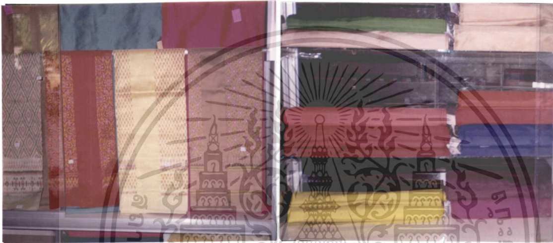
ภาพที่ 14 ผ้าไหมที่มีไว้เพื่อการจำหน่าย

ผ้าไหมที่เกษตรกรทอเสร็จเรียบร้อยแล้ว จะส่งให้กับกลุ่มเพื่อเตรียมการจำหน่ายให้กับลูกค้า (ภาพที่ 14) การผลิตผ้าไหมให้มีคุณภาพดีขึ้นอยู่กับความชำนาญ ฝีมือปราณีตของผู้ทอและวัตถุดิบ เป็นสำคัญ ถ้าวัตถุดิบเส้นไหมมีคุณภาพไม่ดีก็จะทำให้ผ้าไหมที่ผลิตได้มีคุณภาพไม่ดีด้วย (กระทรวงเกษตรและสหกรณ์, 2538: 19)