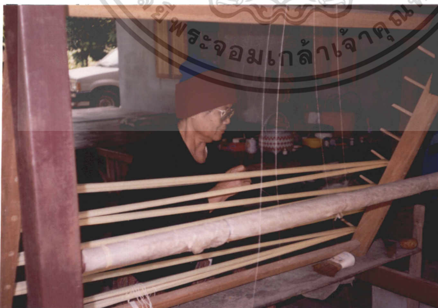
เอกสารนี้เป็นเอกสารที่สงวนไว้สำหรับการใช้งานเพื่อการศึกษาเท่านั้น ไม่อนุญาตให้นำไปใช้ประโยชน์ด้านการค้า ภาพที่ 11 การเตรียมเส้นไหมยืน

2.1 การเตรียมไหมยืน คือ การเตรียมไหมที่ใช้เป็นเส้นยืนตามความยาวของผ้า เกษตรกรจะใช้เส้นไหมลูกผสมเป็นเส้นยืนในการทอผ้าไหม (ภาพที่ 11)