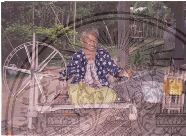
ภาพที่ 12 การกรอเส้นไหมจากอ๊กเข้าหลอดด้ายพุ่ง

กระบวนการเตรียมเส้นพุ่ง คือ กรอเส้นไหมที่ฟอกขาวและเชื่อมสีแล้วเข้าอ๊ก แล้วกรอจากอ๊กเข้าหลอดด้ายพุ่ง (ภาพที่ 12) สำหรับไปใช้ทอต่อไปด้วยเครื่องกรอที่เรียกว่า ไนกรอไหม