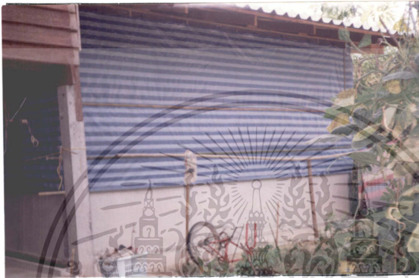
ภาพที่ 4 โรงเลียงใหม่ของเกษตรกร

โดยน้ำหนัก) และเกลบเผาเอาไว้ให้พร้อมที่จะโรยตัวใหม่ เพื่อลดความชื้นในกระดังใหม่และช่วยป้องกันโรคจากเชื้อรา (สมโพธิ, 2533: 320)