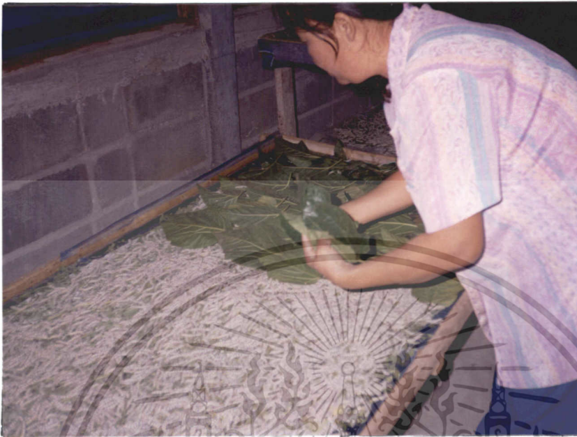
ภาพที่ 5 การให้ใบหม่อนแก่หนอนไหม

1.3 จำนวนใบหม่อน หนอนไหมวัย 1 จำนวน 20,000 ตัวจะกินใบหม่อนประมาณ 340 กรัม วัย 2 กินใบหม่อนประมาณ 1,600 กรัม และ 6,800 กรัมสำหรับวัย 3 ไหมวัยอ่อนนั้นต้องการกินใบหม่อนอ่อน จึงควรใช้ใบอ่อนนุ่มที่อยู่ปลายกิ่งในกิ่งหนึ่งๆ คือ