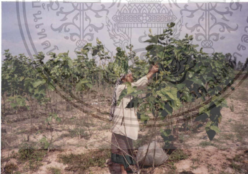
ภาพที่ 2 แปลงหม่อนที่เกษตรกรทำการปลูก

กิ่งหม่อนปลูกควรมีอายุ ตั้งแต่ 4 เดือนถึง 1 ปีและเลือกเอาส่วนของกิ่งที่เป็นสีน้ำตาล โดยแต่ละท่อนมีตาประมาณ 5-6 ตา มีความยาวประมาณ 20-30 เซนติเมตร และส่วนที่ปักลงในดินควรใช้มีดหรือกรรไกรที่คมตัดเป็นปากฉลาม เพื่อป้องกันเปลือกชำรุด ซึ่งจะทำให้เกิดการเจริญเติบโตของรากไม่ดีเท่าที่ควร เตรียมดินโดยไถพรวนแล้วขุดเป็นร่องให้มีขนาด กว้าง 50 ซม. ลึก 80 ซม. ใช้เศษหญ้า ใบไม้แห้ง ปุ๋ยหมักหรือปุ๋ยคอกใส่ไร่ละ 2,000-3,000 กิโลกรัมแล้วเอาดินกลบ ในกรณีที่สวนหม่อมมีขนาดเล็ก ไม่จำเป็นต้องทำถนนระหว่างแปลง (ภาพที่ 2) แต่ถ้าสวนหม่อมมีขนาด 6 ไร่ขึ้นไป ควรจัดแบ่งสวนหม่อมออกเป็นแปลงๆ และจัดทำถนนระหว่างแปลงให้รถเข้าออกได้ เพื่อความสะดวกในการขนย้ายปุ๋ยและใบหม่อน