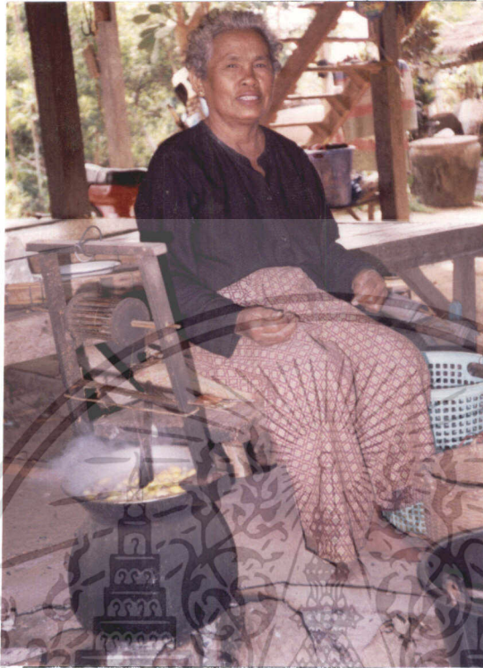
ภาพที่ 7 การสาวไหมด้วยมือของเกษตรกร