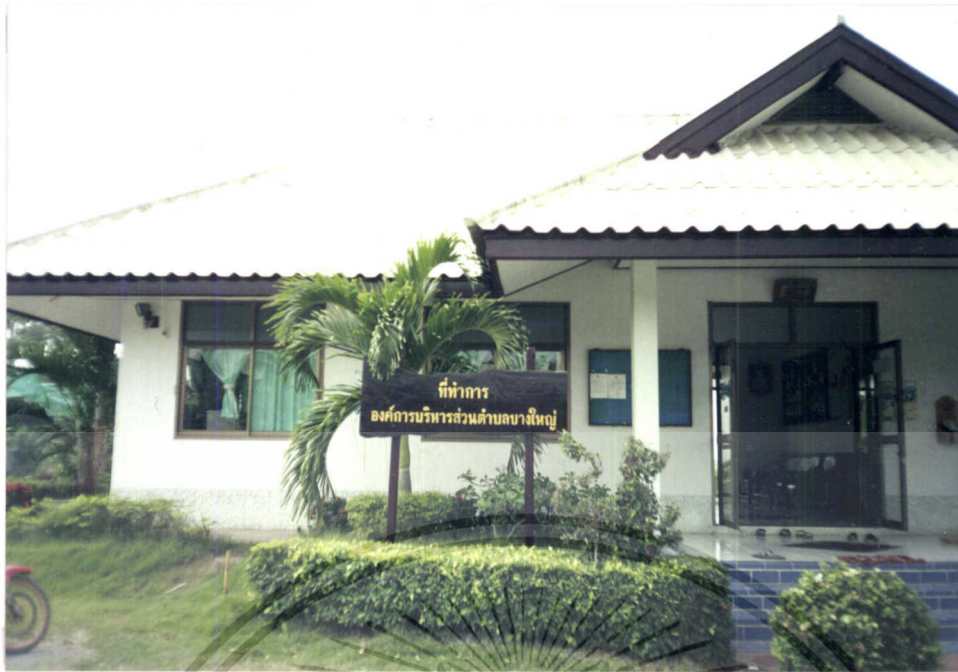
ภาพแสดงที่ทำการองค์การบริหารส่วนตำบล