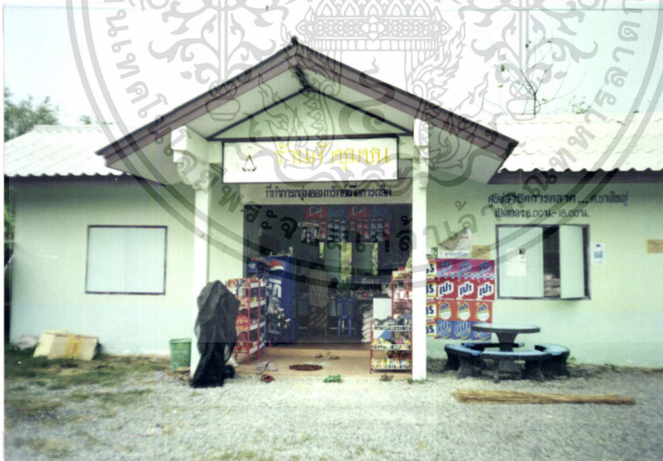
ภาพแสดงสหกรณ์ร้านค้าชุมชน

เอกสารนี้เป็นเอกสารที่สงวนไว้สำหรับการใช้งานเพื่อการศึกษาเท่านั้น ไม่อนุญาตให้นำไปใช้ประโยชน์ด้านการค้า ไม่ว่ากรณีใดๆ ทั้งสิ้น อีกทั้งห้ามมิให้ตัดแปลงเนื้อหา และต้องอ้างอิงถึงเจ้าของเอกสารทุกครั้งที่มีการนำไปใช้