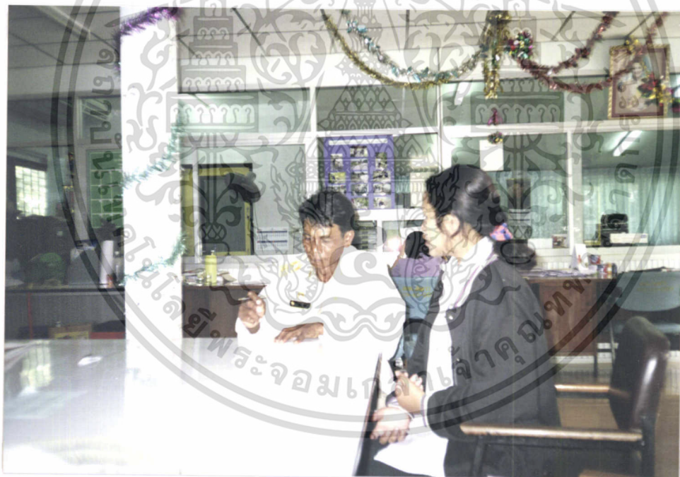
ภาพแสดงการสัมภาษณ์สมาชิกองค์การบริหารส่วนตำบล

เอกสารนี้เป็นเอกสารที่สงวนไว้สำหรับการใช้งานเพื่อการศึกษาเท่านั้น ไม่อนุญาตให้นำไปใช้ประโยชน์ด้านการค้า ไม่ว่ากรณีใดๆ ทั้งสิ้น อีกทั้งห้ามมิให้ตัดแปลงเนื้อหา และต้องอ้างอิงถึงเจ้าของเอกสารทุกครั้งที่มีการนำไปใช้