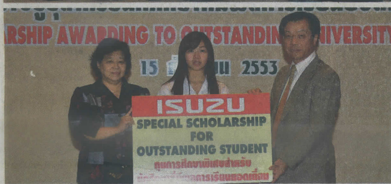
จุฬาลงกรณ์มหาวิทยาลัย