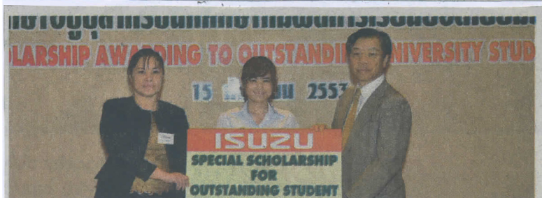
มหาวิทยาลัยเกษตรศาสตร์