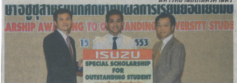
มหาวิทยาลัยเทคโนโลยีพระจอมเกล้า เจ้าคุณทหารลาดกระบัง