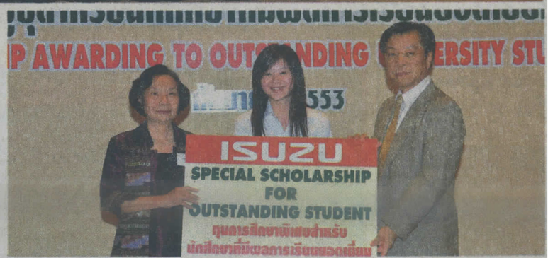
มหาวิทยาลัยธรรมศาสตร์