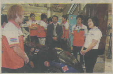
ตัวอย่างรถที่แข่งในยุโรป

แต่ยืนยันว่าเป็นเรื่องจริงที่เกิดขึ้นในการแข่งขันเชลล์อีโค-มาราธอน การแข่งขันระดับโลกที่สนับสนุนให้นักเรียนนักศึกษาออกแบบ และสร้างยานพาหนะที่ใช้พลังงานอย่างคุ้มค่า เพื่อมาแข่งขันกันว่ายานพาหนะของใครจะไปได้ไกลที่สุดโดยใช้เชื้อเพลิงน้อยที่สุด