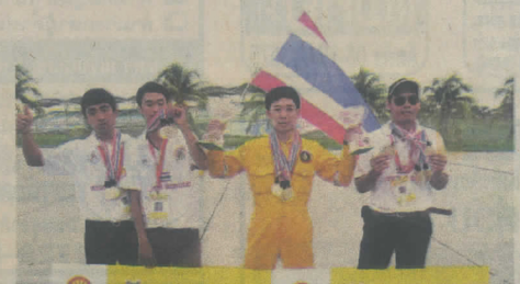
ทีมขส.ทบ.คว้าแชมป์ปี 2010 ที่มาเลเซีย

ในปีนี้ประเทศไทยส่งทีมนักเรียนและนักศึกษาลงสนามแข่งขัน รวม 17 ทีม จากสถาบันเทคโนโลยีพระจอมเกล้าเจ้าคุณทหารลาดกระบัง มหาวิทยาลัย