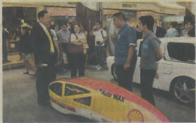
ทีมเทคนิคพัทลุง

ถ้ามีใครพูดว่าการขับรถให้ไ้ระยะทาง 3,000 กิโลเมตร กับการใช้น้ำมันเชื้อเพลิง เพียง 1 ลิตร ฟังดูอาจเป็นเรื่องขำ