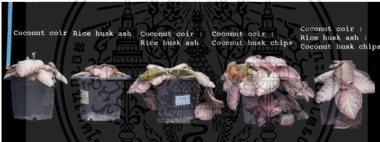
Figure 1 Growth of Episcia cupreata (Hook.) Hanst at 16 th week after planting: 1) coconut coir, 2) rice husk ash, 3) coconut coir : rice husk ash ratio 1 : 1, 4) coconut coir : coconut husk chips ratio 1 : 1, and 5) coconut coir : rice husk ash : coconut husk chips ratio 1 : 1 : 1.

จากการทดลอง พบว่า กรรมวิธีที่ใช้ขุยมะพร้าว : กาบมะพร้าวสับ อัตราส่วน 1 : 1 เป็นวัสดุปลูก ส่งผลให้การเจริญเติบโตทางด้านลำต้นสูงกว่ากรรมวิธีอื่นอย่างมีนัยสำคัญ ได้แก่ ความสูงทรงพุ่ม จำนวนข้อ จำนวนใบ และจำนวนไหล โดยมีความสูงทรงพุ่มสูงสุด คือ 4.80 เซนติเมตร จำนวนข้อ 4.0 ข้อ จำนวนใบ 10.66 ใบ และจำนวนไหล 3.66 ไหล เมื่อปลูกลาน 16 สัปดาห์ (Figure 1 และ 2) อาจเป็นเพราะวัสดุปลูกมีสมบัติทางกายภาพในเรื่องความพรุน (62.5 เปอร์เซ็นต์) ช่องว่างในอากาศ (25.0 เปอร์เซ็นต์) และน้ำที่ยึดไว้ในช่องว่าง (37.5 เปอร์เซ็นต์) ที่สูงกว่าวัสดุปลูกอื่น (Table 2) ทำให้วัสดุปลูกมีความสามารถในการถ่ายเทอากาศได้ดี เพราะค่าความพรุนสูง และมีความสามารถในการอุ้มน้ำรวมถึงช่องว่างในอากาศที่สูง ส่งผลให้ต้นพรหมญี่ปุ่นมีการเจริญเติบโตทางลำต้นได้ดี ซึ่งสอดคล้องกับการศึกษาผลของวัสดุต่าง ๆ ที่มีต่อการเจริญเติบโตของกาบหอยแครง พบว่า การใช้กาบมะพร้าวสับผสมเพอร์ไลต์ อัตราส่วน 1 : 1 เป็นวัสดุปลูกที่ดีที่สุดในด้านความกว้างของทรงพุ่ม ความสูง ความยาวของแผ่นใบ ความกว้างแผ่นใบ ความยาวกาบใบ ความกว้างของกาบใบ จำนวนใบ และการรอดตาย (สวัสดี พิมพ์สุวรรณ, 2555) และการใช้ขุยมะพร้าวหมักเป็นวัสดุเพาะกล้าของแตงกวา พบว่า การใช้วัสดุเพาะกล้าเป็นขุยมะพร้าวหมักผสมกับขุยมะพร้าวขนาดเล็กและขนาดใหญ่ให้จำนวนวันเฉลี่ยในการงอกที่มากกว่าการใช้พีทมอสเพียงอย่างเดียว (สุเมธ รอดหิรัญ และธรรมศักดิ์ ทองเกต, 2557)