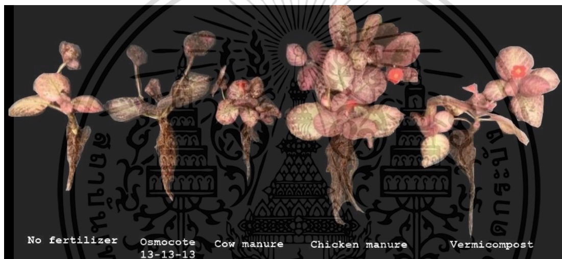
Figure 5 Root growth of Episcia cupreata (Hook.) Hanst at 16 th week after planting: 1) no fertilizer, 2) Osmocote 13-13-13, 3) cow manure, 4) chicken manure, and 5) vermicompost.