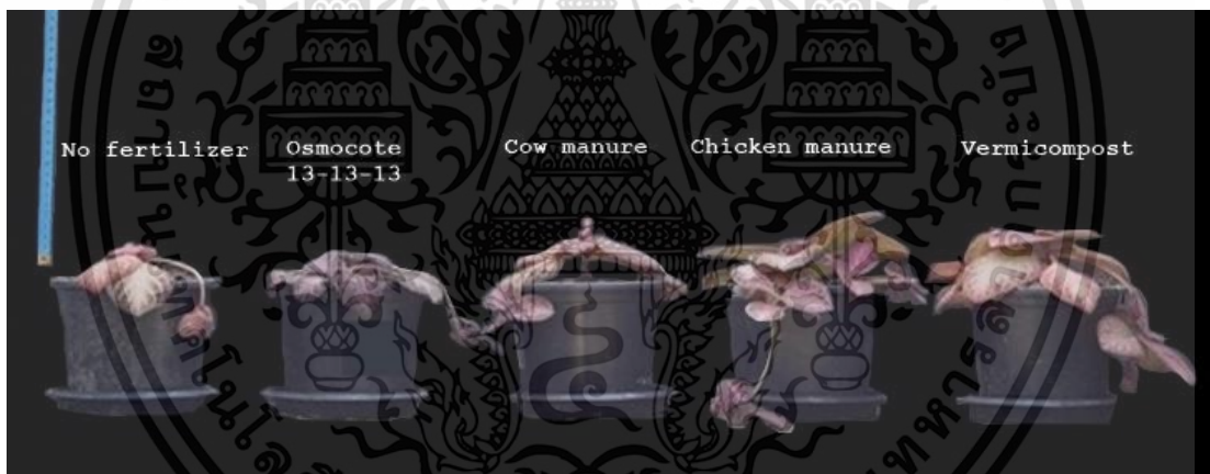
Figure 4 Growth of Episcia cupreata (Hook.) Hanst at 16 th week after planting: 1) no fertilizer, 2) Osmocote 13-13-13, 3) cow manure, 4) chicken manure, and 5) vermicompost.