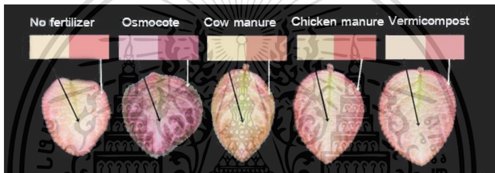
Figure 6 Leaf color of margin and middle of Episcia cupreata (Hook.) Hanst at 16 th week after planting.

1/ Means with the same letter within row are not significantly different at P<0.05 by least significant difference. ns = non-significant at P<0.05.