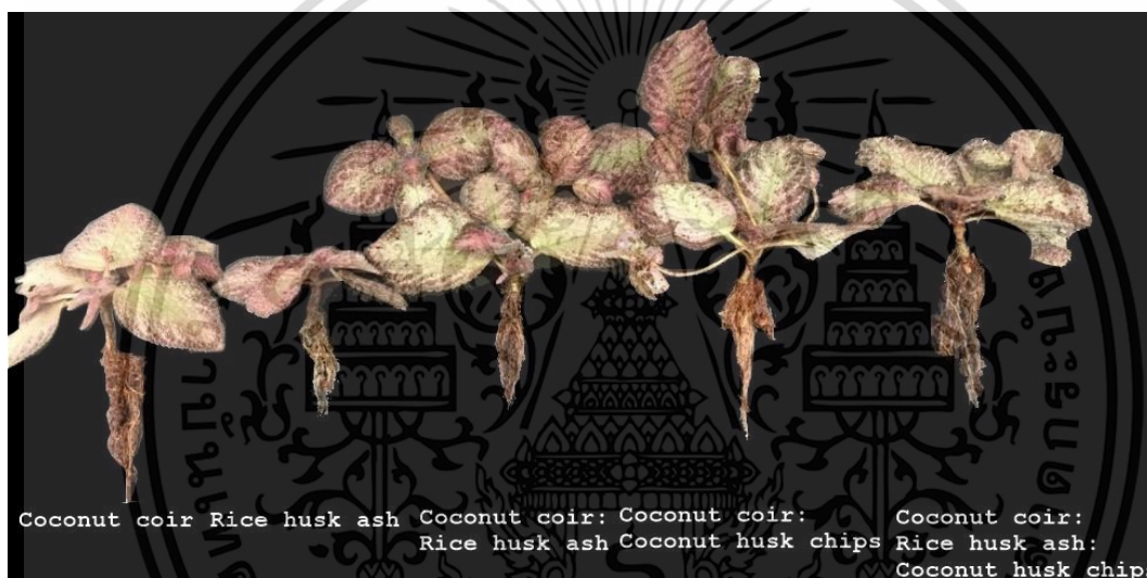
Figure 3 Root growth of Episcia cupreata (Hook.) Hanst at 16 th week after planting: 1) coconut coir, 2) rice husk ash, 3) coconut coir : rice husk ash ratio 1 : 1, 4) coconut coir : coconut husk chips ratio 1 : 1, and 5) coconut coir : rice husk ash : coconut husk chips ratio 1 : 1 : 1.