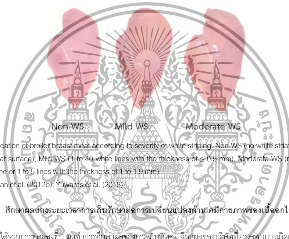
Figure 1 Classification of broiler breast meat according to severity of white striping. Non-WS (no white striation found on the meat surface), Mild WS (1 to 40 white lines with the thickness of \leq 0.5 mm), Moderate WS (more than 40 white line or 1 to 5 lines with the thickness of 1 to 1.9 mm)

สำรวจเนื้ออกไก่จาก 4 บริษัท คือ บริษัท A, บริษัท B, บริษัท C และ บริษัท D ที่วางจำหน่ายแบบแพ็คเกจในห้างสรรพสินค้า เขตลาดกระบัง กรุงเทพมหานคร ทำการสำรวจทั้งหมด 15 ครั้ง เริ่มตั้งแต่วันที่ 7 พฤศจิกายน พ.ศ. 2561 - 20 มกราคม พ.ศ. 2562 โดยจะนับจำนวนเนื้ออกไก่ทั้งหมดที่วางจำหน่ายในแต่ละครั้ง ทำการจดบันทึกวันที่สำรวจ จำนวนชิ้นเนื้อทั้งหมด และทำการจัดระดับความรุนแรงของการเกิดตำหนิริ้วสีขาวออกเป็น 3 ชุดการทดลอง ดังนี้ ชุดการทดลองที่ 1 เกิดตำหนิริ้วสีขาวระดับปกติ (Non-WS) คือ ไม่พบตำหนิริ้วสีขาว ชุดการทดลองที่ 2 เกิดตำหนิริ้วสีขาวระดับเบาบาง (Mild WS) คือ พบตำหนิริ้วสีขาวจำนวน 1-40 เส้น ที่มีความหนาขนาด \leq 0.5 มิลลิเมตร และชุดการทดลองที่ 3 เกิดตำหนิริ้วสีขาวระดับปานกลาง (Moderate WS) คือ พบตำหนิริ้วสีขาวจำนวนมากกว่า 40 เส้น หรือมีตำหนิริ้วสีขาวจำนวน 1-5 เส้นที่มีความหนาของขนาด 1-1.9 มิลลิเมตร (Figure 1) แสดงผลการทดลองเป็นร้อยละของการเกิดตำหนิริ้วสีขาวในระดับต่าง ๆ