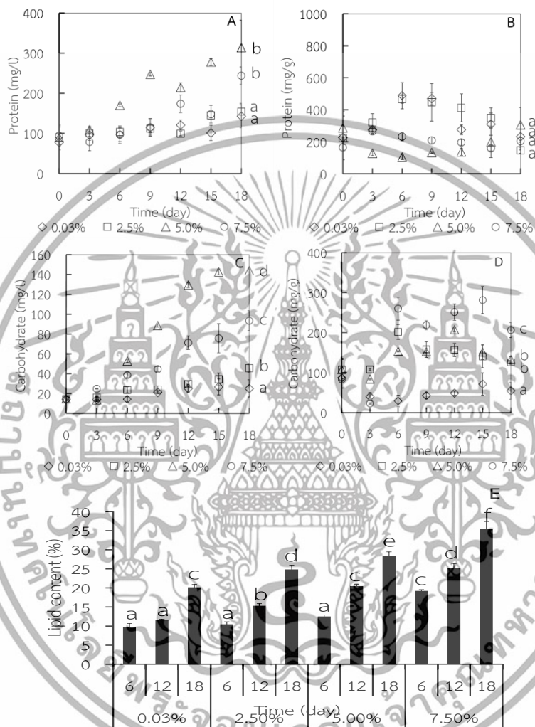
Figure 2 Protein (A-B), carbohydrate (C-D) and lipid content (E) of S. dimorphus KMITL cultivated under CO 2 at different concentrations (0.03-7.50%). Different small letters on the lines indicate significant difference at 95 % confidence level (P<0.05). Error bars represent±S.D. of four replicates.

และสาหร่ายสามารถสะสมคาร์บอนในเซลล์ได้มากกว่านี้ เพราะแสงมีผลต่อปริมาณการใช้คาร์บอนไดออกไซด์ของสาหร่าย โดยจากการทดลองนี้สาหร่ายที่ได้รับคาร์บอนไดออกไซด์ 5.00 เปอร์เซ็นต์ มีปริมาณคาร์บอนในเซลล์สูงสุด 33.83±0.56 เปอร์เซ็นต์ ซึ่งสูงกว่าและแตกต่างอย่างมีนัยสำคัญทางสถิติกับชุดที่ได้รับคาร์บอนไดออกไซด์ 0.03 และ 2.50 เปอร์เซ็นต์ (Table 1) ส่วนปริมาณไฮโดรเจนและไนโตรเจน พบสูงสุดในสาหร่ายที่ได้รับคาร์บอนไดออกไซด์ 5.00 เปอร์เซ็นต์ โดยมีค่าเท่ากับ 5.87±0.08 และ 5.69±0.02 เปอร์เซ็นต์ ตามลำดับ และพบว่าอัตราส่วนคาร์บอนต่อไนโตรเจน (CN ratio) ของสาหร่ายชนิดนี้มีค่าอยู่ในช่วง 4.77-6.70