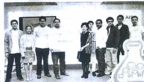
ทีม Flowz รองชนะเลิศ

เริ่มต้นด้วยการเปิดเวทีให้ผู้เข้าร่วมแต่ละคนออกมานำเสนอไอเดียที่ต้องการจะปั้นเป็นธุรกิจคนละ 1 นาที ต่อหน้าเพื่อนๆ ทั้ง 120 คน จากนั้นให้แต่ละคนโหวดให้อิเดียที่ตนเองชื่นชอบและอยากเข้าร่วมปั้นให้เป็นจริง ซึ่งในครั้งนี้มีไอเดียที่ได้รับการเลือกตั้งทั้งหมด 16 ไอเดียซึ่งเป็นที่มาของ 16 ทีม