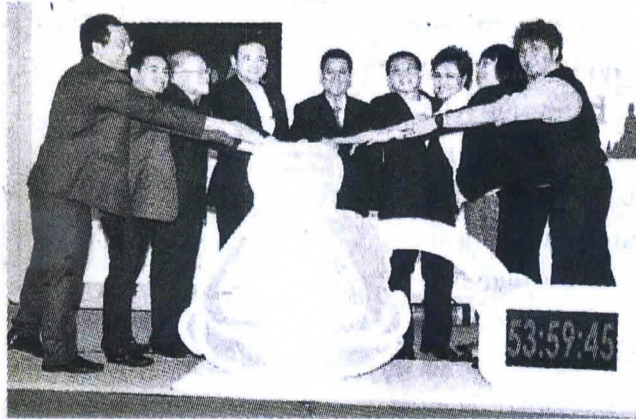
พิธีเปิดงานอย่างเป็นทางการ