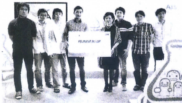
Shopspot Team รองชนะเลิศ