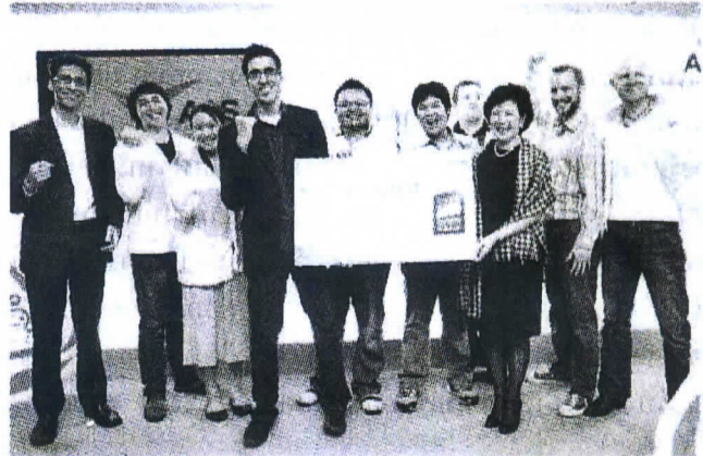
ทีม Chatter box ชนะเลิศ