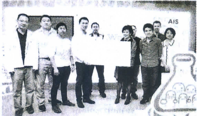
ทีม Got it รองชนะเลิศ