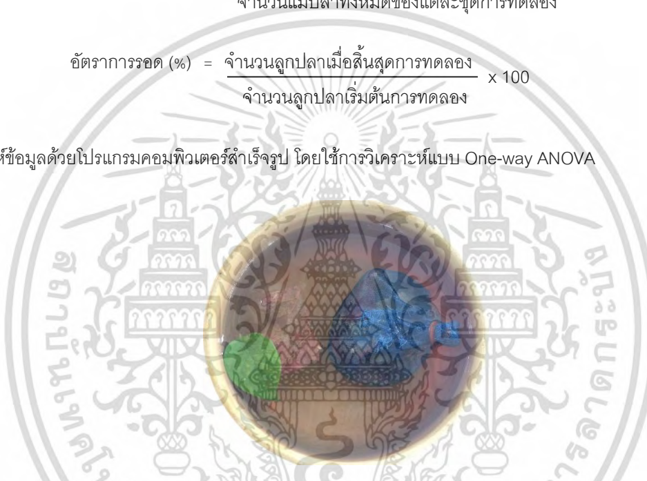
Figure 1 The preparation of T. catappa leaves for B. splendens breeding.

และวิเคราะห์ข้อมูลด้วยโปรแกรมคอมพิวเตอร์สำเร็จรูป โดยใช้การวิเคราะห์แบบ One-way ANOVA