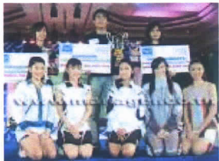
โฉมหน้าผู้ได้รับรางวัลพร้อมผลงานของจริง