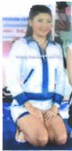
ผลงานของรองชนะเลิศอันดับ 1