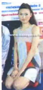
ผลงานของรองชนะเลิศอันดับ 2