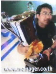
"ต่อ" กับถ้วยรางวัลชนะเลิศ