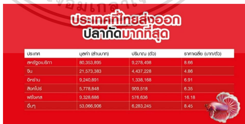
ภาพที่ 1.1 การส่งออกปลากัดของประเทศไทย

จากข้อมูลจำนวนสัตว์เลี้ยงในประเทศไทยในตารางที่ 1.1 พบว่าประเด็นแรกคือ สัตว์เลี้ยงภายในประเทศค่อนข้างมีความหลากหลาย นอกจาก สุนัข และ แมว ที่ทุกคนรู้จักกันอย่างดียังมีสัตว์เลี้ยงลูกด้วยนม ตัวอย่างเช่น กระต่าย กระรอก ชูการ์ไรเดอร์ หรือ หนู เป็นต้น และประเด็นที่สองคือ จำนวนสัตว์เลี้ยงในภาพรวมเราจะพบว่าแนวโน้มสูงขึ้นอย่างเป็นนัยสำคัญจากแนวโน้มที่เพิ่มขึ้นของการเลี้ยงสัตว์ของประชากร จึงทำให้เกิดธุรกิจเกี่ยวกับสัตว์เลี้ยงขึ้นมากมาย โดยรวมทั้งการส่งออกสัตว์เลี้ยง เช่น ปลากัดสวยงามของไทยคิดเป็นสัตว์น้ำสวยงามที่มีการส่งออกมากที่สุด โดยมียอดการส่งออกถึง 22.8 ล้านดอลลาร์สูงถึงประมาณ 180 ล้านบาท คิดเป็นมูลค่า 22.16 ของปริมาณการส่งออกสัตว์น้ำสวยงามของไทยในปี 2561 ดังภาพที่ 1.1