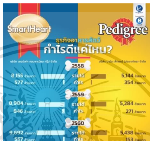
ภาพที่ 1.2 รายได้-กำไรของผู้นำเข้าและผลิตอาหารสัตว์แบรนด์สมาร์ทาร์ทและเพดดิกรี

นอกจากนี้ยังมีธุรกิจที่เกี่ยวกับสัตว์เลี้ยงและมีแนวโน้มในการเติบโตในปี 2562 เช่น อาหาร สัตว์เกรดพรีเมียม คาเฟ่สัตว์เลี้ยง คลินิกดูแลสุขภาพสัตว์เลี้ยง ห้างสรรพสินค้าสำหรับสัตว์เลี้ยง รีสอร์ทและโรงแรมสำหรับสัตว์เลี้ยง และประกันสัตว์เลี้ยงที่ช่วยคุ้มครองในส่วนค่ารักษาพยาบาล สัตว์เลี้ยงและคู่กรณี ในเหตุที่สัตว์เลี้ยงไปทำร้ายผู้อื่นอีกด้วย (Marketeeronline. 2562) โดยธุรกิจที่เกี่ยวกับสัตว์เลี้ยงที่เห็นได้ชัดคือธุรกิจของอาหารสัตว์ที่มีกำไรเพิ่มขึ้นดังภาพที่ 1.2