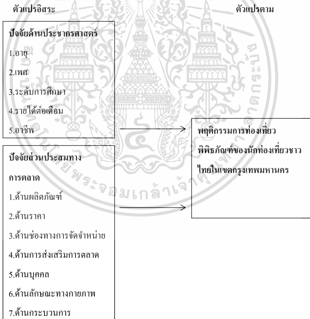
ภาพที่ 1.2 กรอบแนวคิดที่ใช้ในการวิจัย

ในการวิจัยเรื่องส่วนประสมทางการตลาดที่มีผลต่อพฤติกรรมการท่องเที่ยวพืชรักข์ของนักท่องเที่ยวชาวไทยในเขตกรุงเทพมหานคร มีกรอบแนวคิดแสดงความสัมพันธ์ระหว่างตัวแปรอิสระกับตัวแปรตามดังนี้