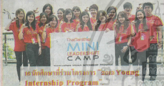
16 นักศึกษาที่ร่วมโครงการ “2018 Young Internship Program”

เปิดโอกาสให้คนรุ่นใหม่ได้สัมผัสการทำงานจริง และได้พัฒนาตนเองก่อนเข้าสู่การทำงานจริง บริษัทไทยน้ำทิพย์ จำกัด จึงจัดกิจกรรมใหม่ในโครงการ “2018 Young Internship Program” ที่เปิดโอกาสให้นักศึกษาได้พัฒนาทักษะการเรียนรู้รุ่นนอกตำราเรียน ด้วยการมาทำ