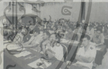
อบรมก่อนเดินทาง

ออกน้อยก็ต้องประกันรายได้ว่าจะมีรายได้ไม่น้อยกว่า 7.7 หมื่นบาท ซึ่งในปีนี้ได้รับข้อมูลว่ามีผลไม่ออกเป็นจำนวนมาก คนงานจะมีรายได้ค่อนข้างแน่นอน”