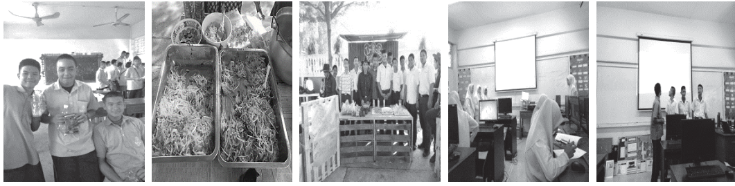
รูปที่ 2 ตัวอย่างกิจกรรมในแผนการจัดการเรียนรู้ทั้ง 5 แผน

จากรูปที่ 2 การจัดการเรียนรู้ในแต่ละแผนการจัดการเรียนรู้มีจุดมุ่งหมายและกระบวนการจัดการเรียนรู้ ดังนี้