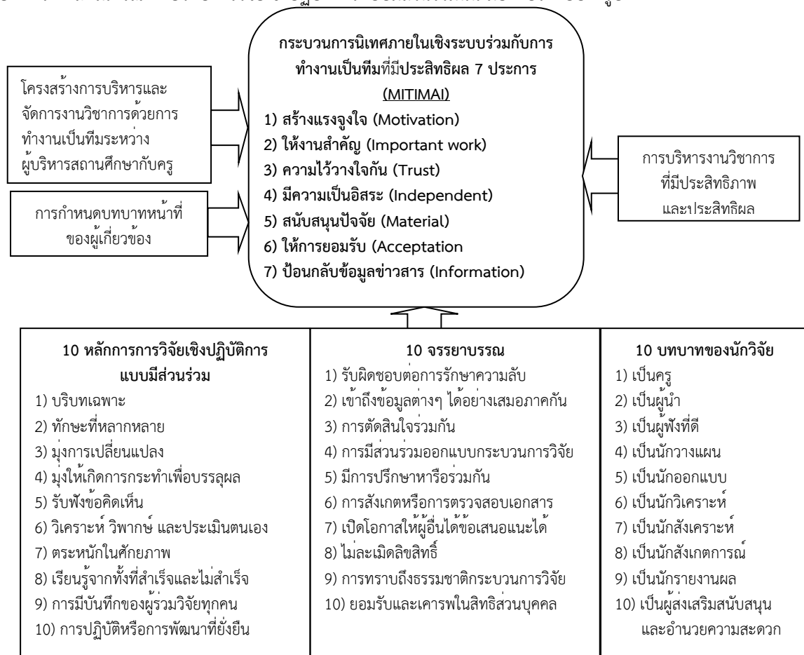
รูปที่ 2 องค์ประกอบองค์ความรู้จากการปฏิบัติด้วยรูปแบบการบริหารงาน

จากการใช้รูปแบบการบริหารงานวิชาการโดยใช้กระบวนการนิเทศภายในเชิงระบบร่วมกับการทำงานเป็นทีมระหว่างผู้บริหารสถานศึกษากับครู ผู้วิจัยและผู้ร่วมวิจัยได้ร่วมกันสรุปองค์ความรู้จากการปฏิบัติ ทั้งในกรณีที่เกี่ยวข้องกับการพัฒนารูปแบบการบริหารงานวิชาการ โดยใช้กระบวนการนิเทศภายในเชิงระบบร่วมกับการทำงานเป็นทีมระหว่างผู้บริหารสถานศึกษากับครู เป็นตัวสอดแทรก และในกรณีที่เกี่ยวข้องกับการวิจัยเชิงปฏิบัติการแบบมีส่วนร่วม นั้น มีองค์ประกอบดังรูปที่ 2