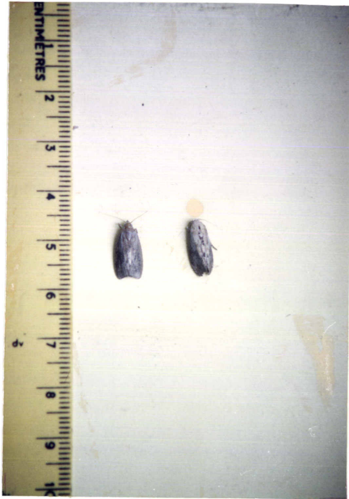
ภาพที่ 11 ลักษณะรูปร่างของตัวเต็มวัยเพศผู้และเพศเมียของหนอนผีเสื้อกินไขผึ้ง G. mellonella