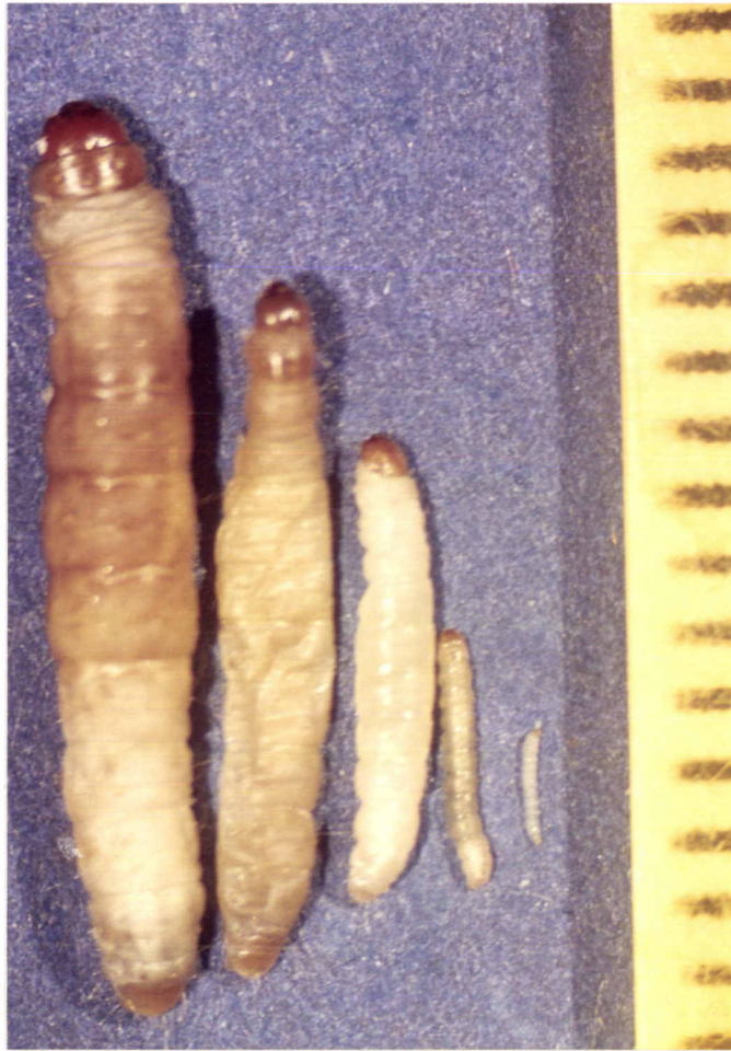
ภาพที่ 4 ขนาดของหนอนผีเสื้อกินไขผึ้ง G. mellonella ในแต่ละระยะ