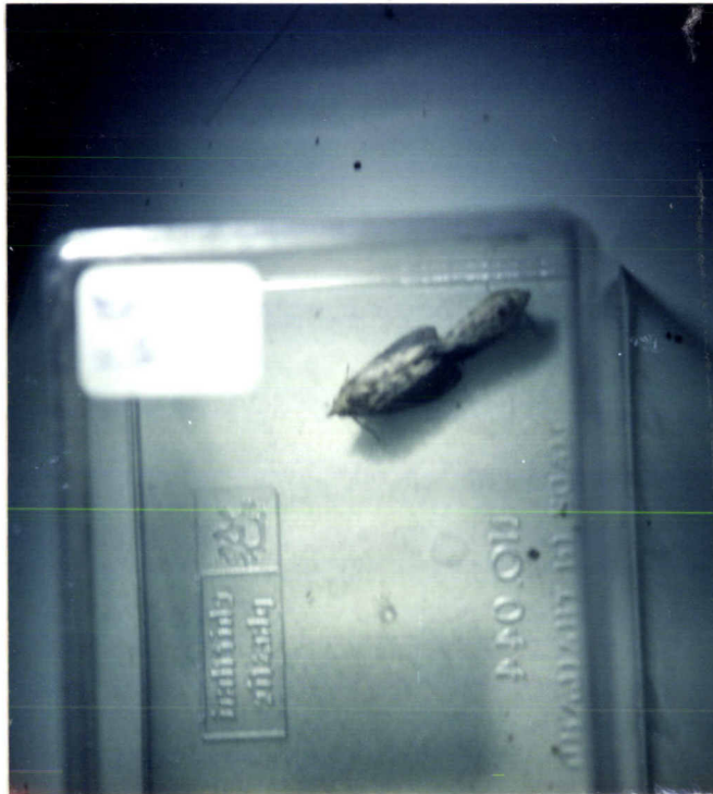
ภาพที่ 1 ลักษณะการผสมพันธุ์ของหนอนผีเสื้อกินไขผึ้ง G. mellonella