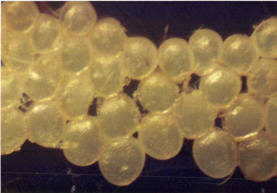
ภาพที่ 2 ลักษณะรูปร่างไขของหนอนผีเสื้อกินไขผึ้ง G. mellonella ( x 4)