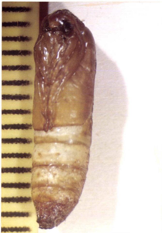
ภาพที่ ๑ ลักษณะรูปร่างของดักแด้ของหนอนผีเสื้อกินขยะ G. mellonella