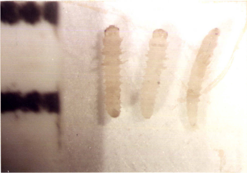
ภาพที่ 3 ลักษณะรูปร่างของหนอนผีเสื้อกินไขผึ้ง G. mellonella ที่เพิ่งฟักออกจากไข่