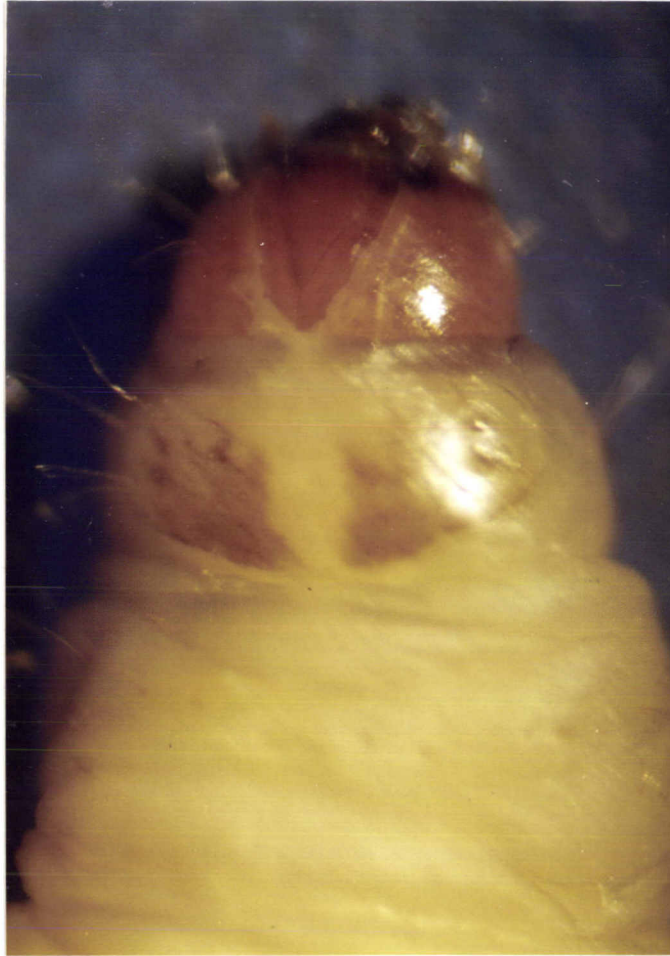
ภาพที่ 6 ลักษณะของ cervical shield บนอกปล้องแรกในระยะหนอนวัยสุดท้ายของหนอนผีเสื้อกิน ไขผึ้ง G. mellonella