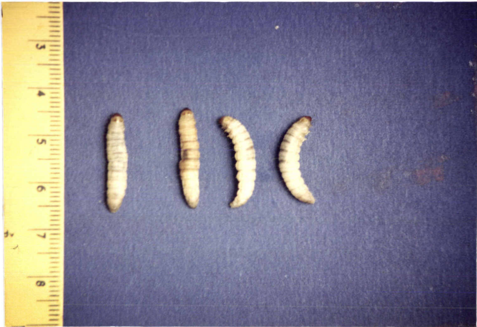
ภาพที่ 8 ลักษณะรูปร่างของหนอนวัยสุดท้ายของหนอนผีเสื้อกินไผ่ฝ้าง G. mellonella