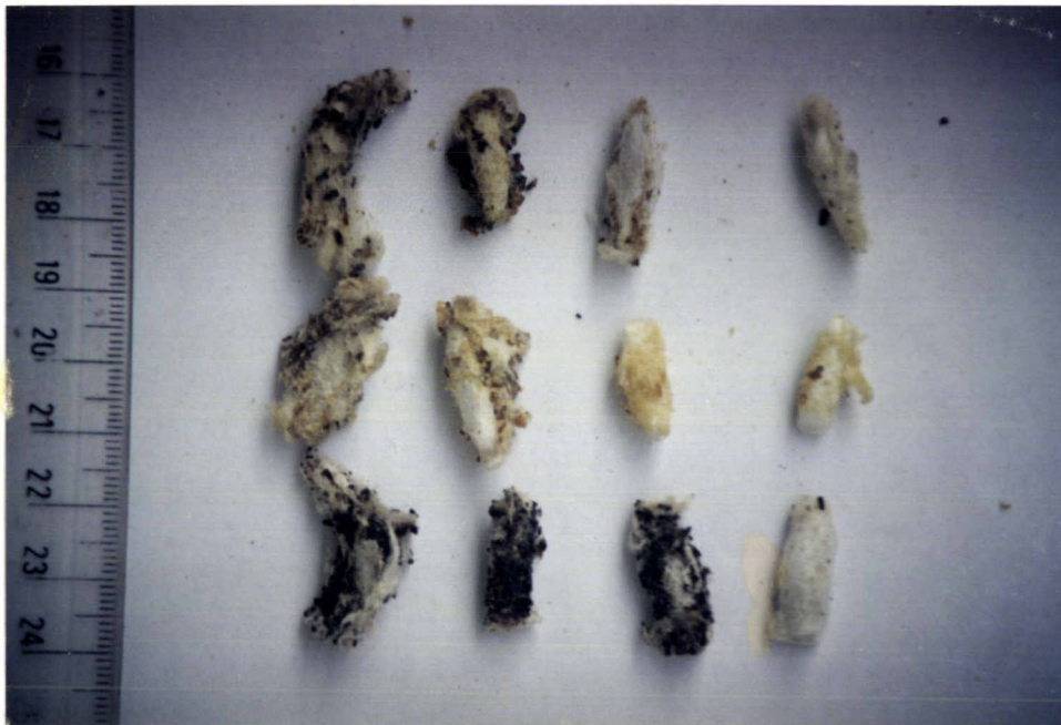
ภาพที่ 10 ลักษณะรูปร่างของ cocoon ของหนอนผีเสื้อกินไผ่ G. mellonella