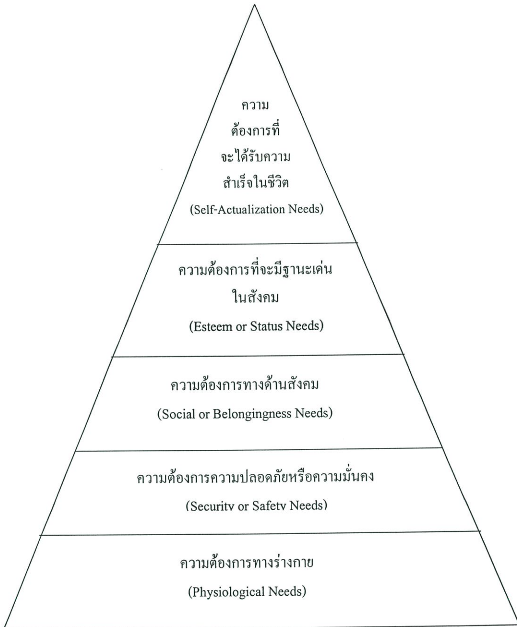
ภาพที่ 2.1 แสดงความต้องการของมนุษย์ เรียงลำดับชั้นจากต่ำไปหาสูง (Hierarchy of Needs)

สาระสำคัญของทฤษฎีความต้องการตามลำดับชั้นของมาสโลว์ สรุปได้ว่าความต้องการทั้ง 5 ชั้นของมนุษย์มีความสำคัญไม่เท่ากัน บุคคลแต่ละคนจะปฏิบัติตนให้สอดคล้องกับลำดับความต้องการในแต่ละประเภทที่เกิดขึ้น การจูงใจตามทฤษฎีนี้จะต้องพยายามตอบสนองความต้องการลำดับชั้นที่แตกต่างกันไป และความต้องการตั้งแต่ระดับที่ 1 ถึง 5 จะมีความสำคัญแก่บุคคลมากน้อยเพียงใด ขึ้นอยู่กับความพึงพอใจที่ได้รับจากการสนองความต้องการในลำดับต้น ๆ