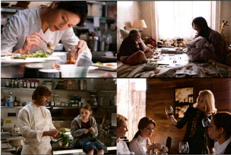
ภาพที่ 14 ตัวอย่างภาพยนตร์เรื่อง No Reservation