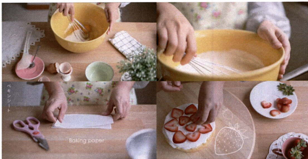
ภาพที่ 13 ตัวอย่างภาพที่มีการใช้แสงธรรมชาติ

ที่มา : ยูทูป.คอม Video & Recipe 008 – Strawberry Shortcake [ออนไลน์], สืบค้น 12 พฤษภาคม 2557. เข้าถึงได้จาก http://www.youtube.com/watch?v=Wc6F_dLJo8o