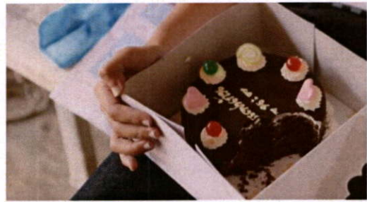
ภาพที่ 29 ภาพตัวอย่างบางส่วนของภาพยนตร์