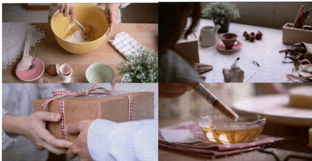
ภาพที่ 15 ตัวอย่างภาพที่มีการใช้สีผสมขาว