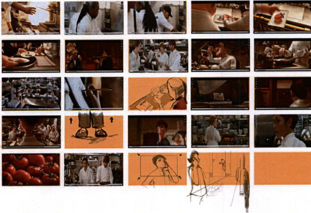
ภาพที่ 26 Storyboard ของ Scene1