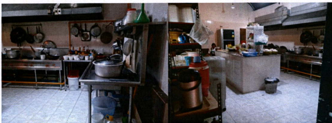
ภาพที่ 24 ครัวร้านอาหาร

สถานที่ที่เลือกใช้ในการถ่ายทำคือร้านอาหารของน้ำที่รู้จักกัน น้ำเปิดร้านเสต็ก แต่ว่าเมื่อกิจการดีขึ้น ก็เพิ่มความหลากหลายด้วยเมนูกับข้าวด้วย ทำให้มีครัวที่ลักษณะคล้ายร้านอาหารตามสั่งอยู่ด้วย