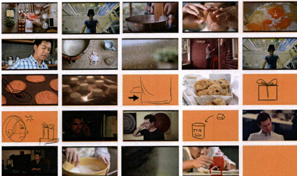
ภาพที่ 27 Storyboard ของ scene ต่อเท่านั้นที่ครองโลก 1