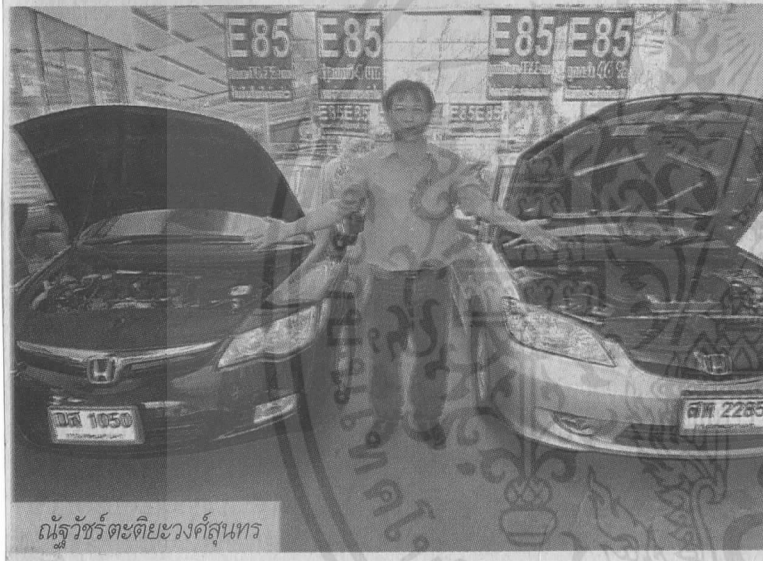
ณ้ลู่่ว้ร้ระด่ยระงค้สุนทร