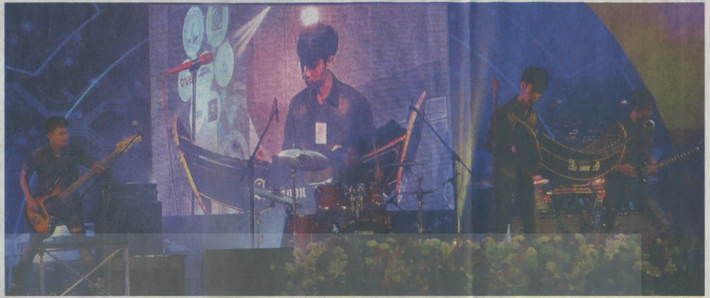
วง As Soon As จาก ร.ร.ราชวินิต บางแก้ว คำว่าแซมปีชานะลิค

การนำเอามาใช้ประกอบองค์ความรู้ในการคิดสังเคราะห์ดนตรีจะช่วยกระตุ้นให้มีการค้นคว้าสร้างสรรค์นวัตกรรมดนตรี และนำเทคโนโลยีมาพัฒนาการแสดงดนตรีให้ก้าวสู่สากลมากยิ่งขึ้น โดยวัตถุประสงค์ในการจัดประกวด Thailand Futuristic Music Contest 2015 ประกอบด้วย หนึ่ง-เปิดเวทีที่ท้าทายคนรุ่นใหม่ให้แสดงออกซึ่งความคิดสร้างสรรค์ การสังเคราะห์และสร้างเสียงดนตรีโดยผสมผสานองค์ความรู้และอุปกรณ์