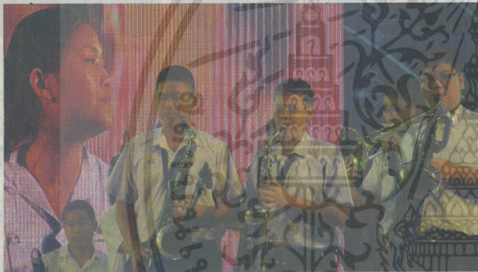
วง Horwang School Big Band จาก ร.ร.หอวัง ได้รางวัลรองชนะเลิศอันดับที่ 2

ต่างๆ สอง-กระตุ้นให้เกิดแนวคิดที่หลากหลายและการพัฒนาสีสันแห่งดนตรีในอนาคต สาม-เพื่อยกระดับดนตรีสู่มาตรฐานสากลให้ทัดเทียมกับนานาประเทศในอนาคต "ยกตัวอย่าง แต่ก่อนอุปกรณ์ที่พวกเราเคยใช้สำหรับการแสดง หรือ Pro Audio ที่ใช้ในอีเว้นท์และการแสดงคอนเสิร์ตมีราคาแพงและใช้ยาก มีก๊อปปี้ตัวหนึ่งเต็มไปด้วยสายยุ่งเหยิงมากมายและมีปุ่มปรับที่ซับซ้อนเมื่อโลกของดิจิทัลเข้ามา ทำให้มีก๊อปปี้ตัวหนึ่ง ได้มีการวิจัยและพัฒนาทางวิศวกรรมดนตรีอย่างก้าวหน้าจนมีขนาดที่เล็กลงแต่มีประสิทธิภาพมากขึ้น จากสายต่อพ่วงที่ยุ่งเหยิงจำนวนมาก ปัจจุบันมีเพียงสายเคเบิลเส้นเดียวก็สามารถส่งสัญญาณที่ครอบคลุมการใช้งานได้ทั้งหมด" สำหรับคณะกรรมการตัดสิน งานประกวดครั้งนี้ประกอบด้วย โสฬส ปูนเกษมบุตร ไพโรตเซอร์, ชัยบรรพต พิษผลทรัพย์ อาจารย์ประจำคณะดุริยางคศาสตร์ มหาวิทยาลัยศิลปากร, ทนงศักดิ์ ใจชื้นแสน ผู้เชี่ยวชาญ