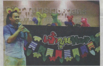
ละครเรื่อง หนูไปรษณีย์ โดยคณะเจ้าหนูทอง