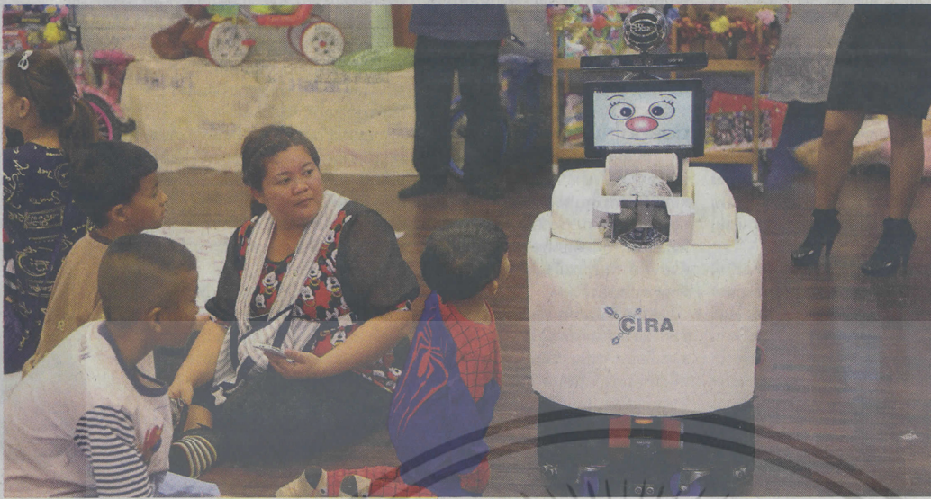
หุ่นยนต์ไซรา ทักทายเด็กในงาน