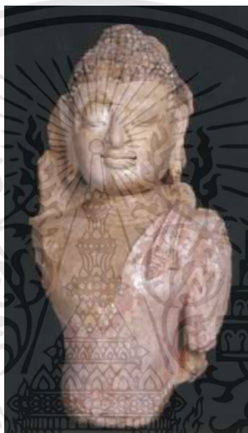
ภาพที่ 2.5 : พระพุทธรูปปูนปั้นสมัยสุโขทัย

ศิลปะปูนปั้น เป็นเทคนิคการประดับตกแต่งที่ช่างไทยนิยมนำมาใช้ในการตกแต่งลวดลายบนงานสถาปัตยกรรมที่ก่อสร้างด้วยอิฐหรือศิลาแลง มีปรากฏตั้งแต่สมัยทวารวดีและยังคงเป็นที่นิยมสืบต่อกันมาทุกยุคสมัยจะพบเห็นได้ตามโบราณสถานโดยทั่วไป ลวดลายบนสถาปัตยกรรมที่ทำจากปูนปั้นมีทั้งที่เป็นรูปบุคคล รูปสัตว์ ลวดลายพันธุ์พฤกษา เป็นภาพเล่าเรื่องและอื่น ๆ อีกมาก มีทั้งที่ทำเป็นภาพนูนสูง นูนต่ำ หรือทำเป็นประติมากรรมลอยตัว ทั้งนี้ขึ้นอยู่กับคตินิยมและฝีมือช่าง