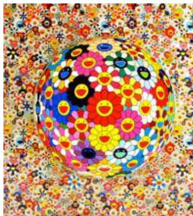
ภาพที่ 2.13 : Flower ball (3D)

[Online]. Available : www.manager.co.th/celebonline