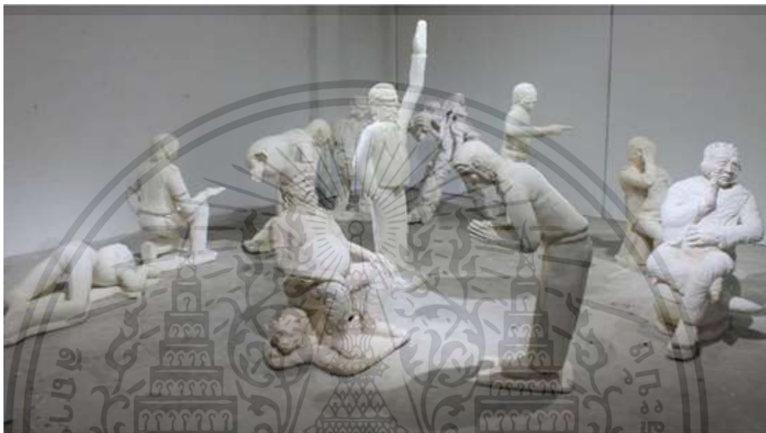
ภาพที่ 4.10 : การวิเคราะห์เส้น

เส้นเป็นทัศนธาตุเบื้องต้นที่สำคัญที่สุด เส้นเป็นแกนของทัศนศิลป์ทุก ๆ แขนง เส้นสามารถแสดงความรู้สึกและสร้างรูปทรงต่าง ๆ ขึ้น ศิลปินบางคนใช้เส้นเป็นแกนสำคัญในการสร้างสรรค์ผลงาน เพราะสามารถกระทำได้อย่างรวดเร็วและตรงใจ (ชลุค นิ่มเสมอ, 2554 : 47)