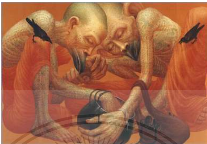
ภาพที่ 2.9 : ภิกษุสันดานกา

[Online]. Available : http-www.thaksinawat.com