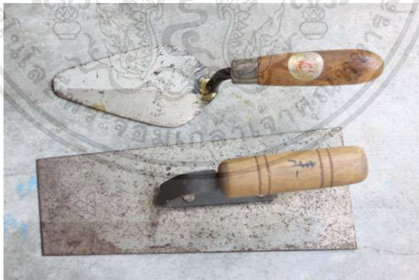
ภาพที่ 3.13 : เกรียง

เอกสารนี้เป็นเอกสารที่สงวนไว้สำหรับการใช้งานเพื่อการศึกษาเท่านั้น ไม่อนุญาตให้นำไปใช้ประโยชน์ด้านการค้า ไม่ว่าจะกรณีใดๆทั้งสิ้น อีกทั้งห้ามมิให้ดัดแปลงเนื้อหา และต้องอ้างอิงถึงเจ้าของเอกสารทุกครั้งที่มีการนำไปใช้