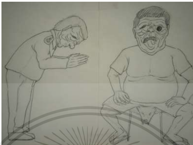
ภาพที่ 3.9 : ภาพร่างโครงการที่ 2 ชั้นที่ 5