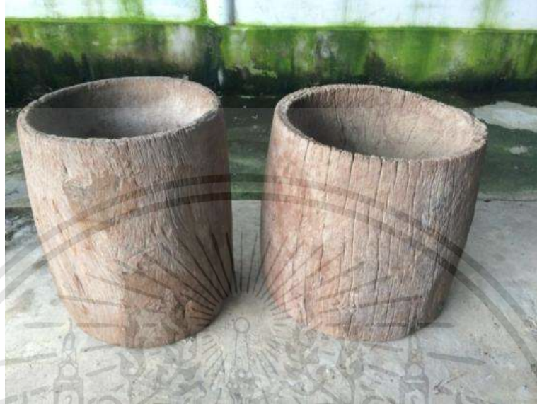
ภาพที่ 3.10 : ครกตำปูน