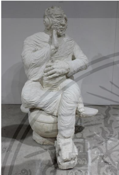
ภาพที่ 4.6 : รูปทรง ก.

รูปทรง คือ รูปที่เกิดจากโครงสร้างที่มีเอกภาพและสุนทรียภาพเป็น โครงสร้างทั้งภายใน ภายนอก อาจเกิดจากส่วนประกอบส่วนเดียว หรือหลายส่วนก็ได้ (ชูลูด นิ่มเสมอ, 2554 : 30)