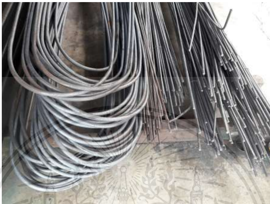
ภาพที่ 3.14 : เหล็กเส้น

[Online]. Available : www. http://submahatrading.com