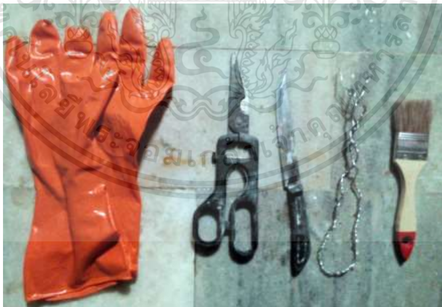
ภาพที่ 3.17 : เครื่องมือเบ็ดเตล็ด

เอกสารนี้เป็นเอกสารที่สงวนไว้สำหรับการใช้งานเพื่อการศึกษาเท่านั้น ไม่อนุญาตให้นำไปใช้ประโยชน์ด้านการค้า ไม่ว่าจะกรณีใดๆทั้งสิ้น อีกทั้งห้ามมิให้ดัดแปลงเนื้อหา และต้องอ้างอิงถึงเจ้าของเอกสารทุกครั้งที่มีการนำไปใช้