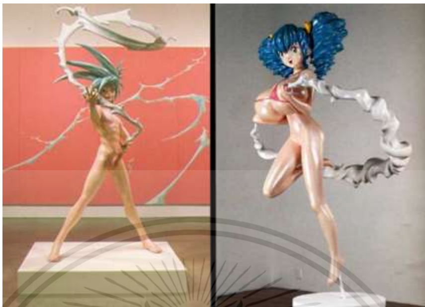
ภาพที่ 2.15 : Hiropon/ My lonesome cowboy

[Online]. Available : www.jeremyriad.com/blog/art/sculptures