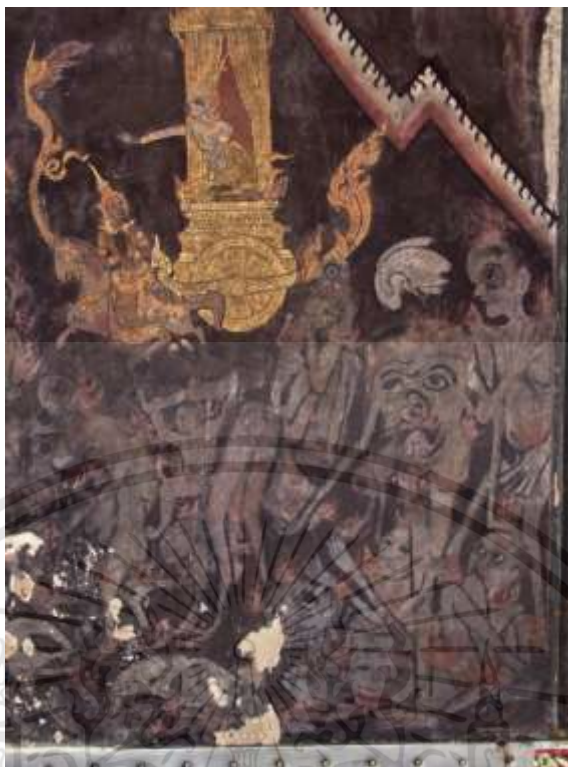
ภาพที่ 2.3 : จิตรกรรมฝาผนัง วัดดิสานุการาม