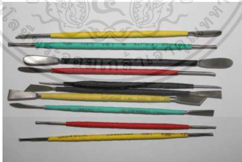
ภาพที่ 3.11 : เครื่องมือปั้น

เอกสารนี้เป็นเอกสารที่สงวนไว้สำหรับการใช้งานเพื่อการศึกษาเท่านั้น ไม่อนุญาตให้นำไปใช้ประโยชน์ด้านการค้า ไม่ว่าจะกรณีใดๆทั้งสิ้น อีกทั้งห้ามมิให้ดัดแปลงเนื้อหา และต้องอ้างอิงถึงเจ้าของเอกสารทุกครั้งที่มีการนำไปใช้