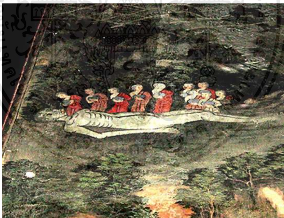
ภาพที่ 2.2 : จิตรกรรมฝาผนัง วัดสุทัศนเทพวราราม

[Online]. Available : http://sbayjai.com/forum/index.php?topic=1231.0