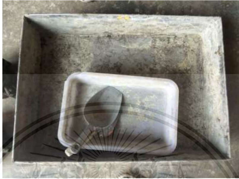
ภาพที่ 3.12 : กระบะผสมปูน