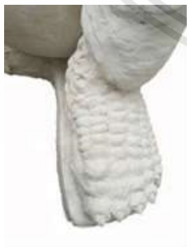
ภาพที่ 4.8 : ลักษณะผิว ข.

ค. ลักษณะพื้นผิวตามตัว แขน ขา จะเป็นพื้นผิวที่หยาบ พูพอง ไม่เหมือนคนปกติทั่วไปให้ความรู้สึกน่ากลัว ไม่อยากเข้าใกล้