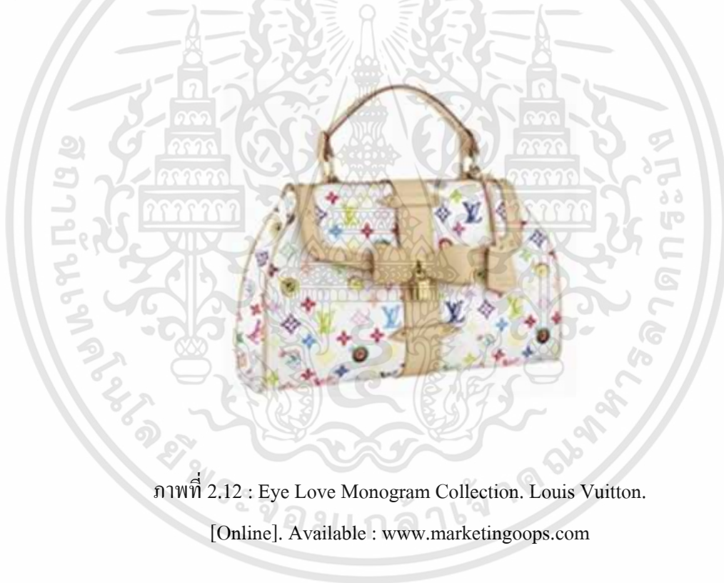
ภาพที่ 2.12 : Eye Love Monogram Collection. Louis Vuitton.