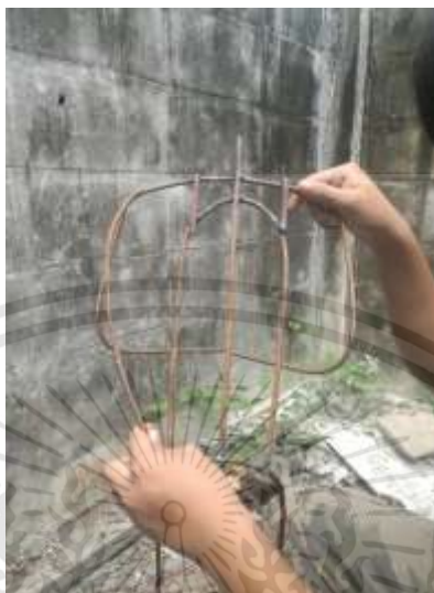
ภาพที่ 3.18 : กระบวนการสร้างงาน ขั้นตอนที่ 1

จากภาพต้นแบบชุดที่ 2 ภาพร่างชิ้นที่ 5 นำมาขยายด้วยวิธีการดังนี้