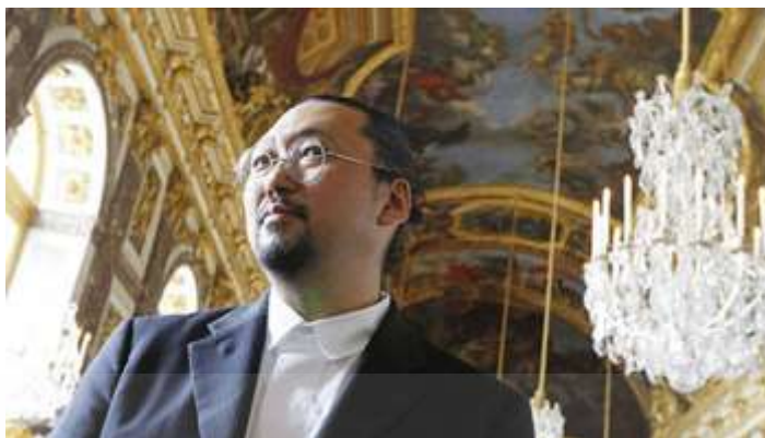
ภาพที่ 2.11 : ทาคาชิ มุราคามิ (Takashi Murakami)