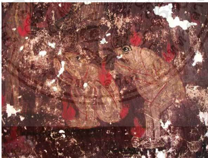
ภาพที่ 2.4 : จิตรกรรมฝาผนัง วัดดุสิตาราม

เอกสารนี้เป็นเอกสารที่สงวนไว้สำหรับการใช้งานเพื่อการศึกษาเท่านั้น ไม่อนุญาตให้นำไปใช้ประโยชน์ด้านการค้า ไม่ว่าจะกรณีใดๆทั้งสิ้น อีกทั้งห้ามมิให้ดัดแปลงเนื้อหา และต้องอ้างอิงถึงเจ้าของเอกสารทุกครั้งที่มีการนำไปใช้