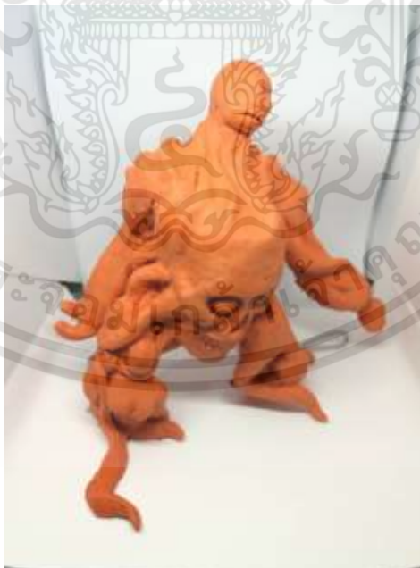
ภาพที่ 3.3 : ภาพร่างโครงการที่ 1 ชั้นที่ 3

เอกสารนี้เป็นเอกสารที่สงวนไว้สำหรับการใช้งานเพื่อการศึกษาเท่านั้น ไม่อนุญาตให้นำไปใช้ประโยชน์ด้านการค้า ไม่ว่าจะกรณีใดๆทั้งสิ้น อีกทั้งห้ามมิให้ดัดแปลงเนื้อหา และต้องอ้างอิงถึงเจ้าของเอกสารทุกครั้งที่มีการนำไปใช้