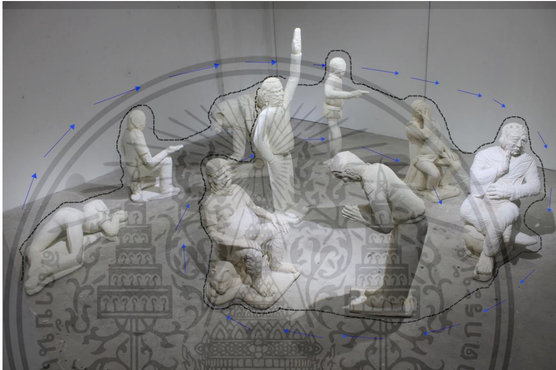
ภาพที่ 4.4 : ภาพแสดงการเคลื่อนไหว

การเคลื่อนไหวมักเกิดจากความเคลื่อนไหวของสายตาของผู้ดูเคลื่อนที่ไปตามทิศทางของเส้นหรือน้ำหนักอ่อนแก่ การเคลื่อนไหวมักจะเคลื่อนจากภายนอกสู่ภายในภาพ ทำให้รูปทรงที่อยู่ตรงกลางนั้นดูโดดเด่น (ชูลูด นิ่มเสมอ, 2554 : 103)