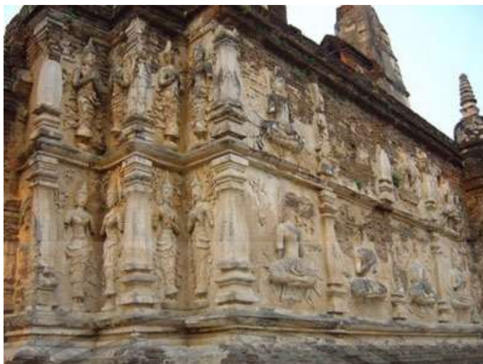
ภาพที่ 2.6 : ลวดลายปูนปั้น วัดเจ็ดยอด จ.เชียงใหม่

[Online]. Available : http://www.bloggang.com