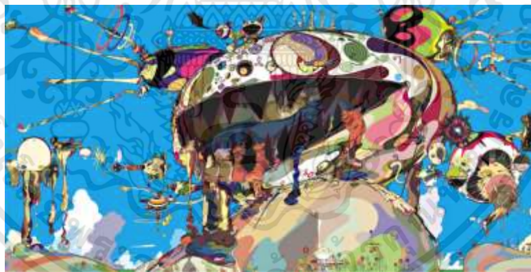
ภาพที่ 2.14 : Tan Tan Bo Puking.

Takashi Murakami ได้ออกแบบพรมปักมือขนาด 2x3 ตารางเมตร เพื่อหลุยส์ วิตตอง โดยเฉพาะ พรมสุดหรูนี้มีชื่อว่า Flower ball ถูกถักทอด้วยพรมชั้นเลิศจากนิวซีแลนด์ ด้วยเทคนิคการทอแบบ เย็บด้ายคู่เป็นห่วงเล็ก ๆ ประมาณ 20 ห่วงต่อหนึ่งตารางเซนติเมตร ซึ่งหลอมรวมความรู้และความชำนาญ วัฒนธรรมดั้งเดิม ความหรรษาสง่างาม และศิลปะ ไว้ด้วยกันอย่างงดงาม