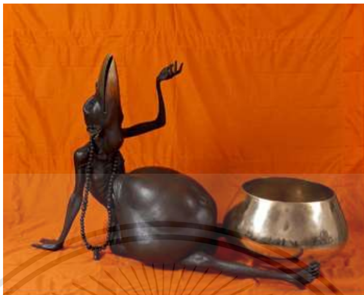
ภาพที่ 2.10 : ลานบุญ-ลานกรรม