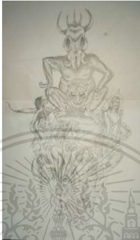
ภาพที่ 3.2 : ภาพร่างโครงการที่ 1 ชั้นที่ 2