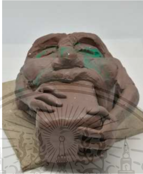
ภาพที่ 3.5 : ภาพร่างโครงการที่ 2 ชั้นที่ 1