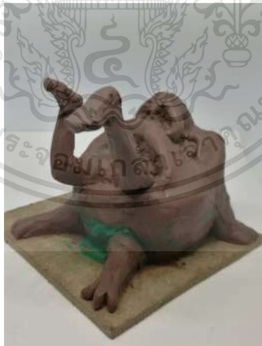
ภาพที่ 3.6 : ภาพร่างโครงการที่ 2 ชั้นที่ 2

เอกสารนี้เป็นเอกสารที่สงวนไว้สำหรับการใช้งานเพื่อการศึกษาเท่านั้น ไม่อนุญาตให้นำไปใช้ประโยชน์ด้านการค้า ไม่ว่าจะกรณีใดๆทั้งสิ้น อีกทั้งห้ามมิให้ดัดแปลงเนื้อหา และต้องอ้างอิงถึงเจ้าของเอกสารทุกครั้งที่มีการนำไปใช้