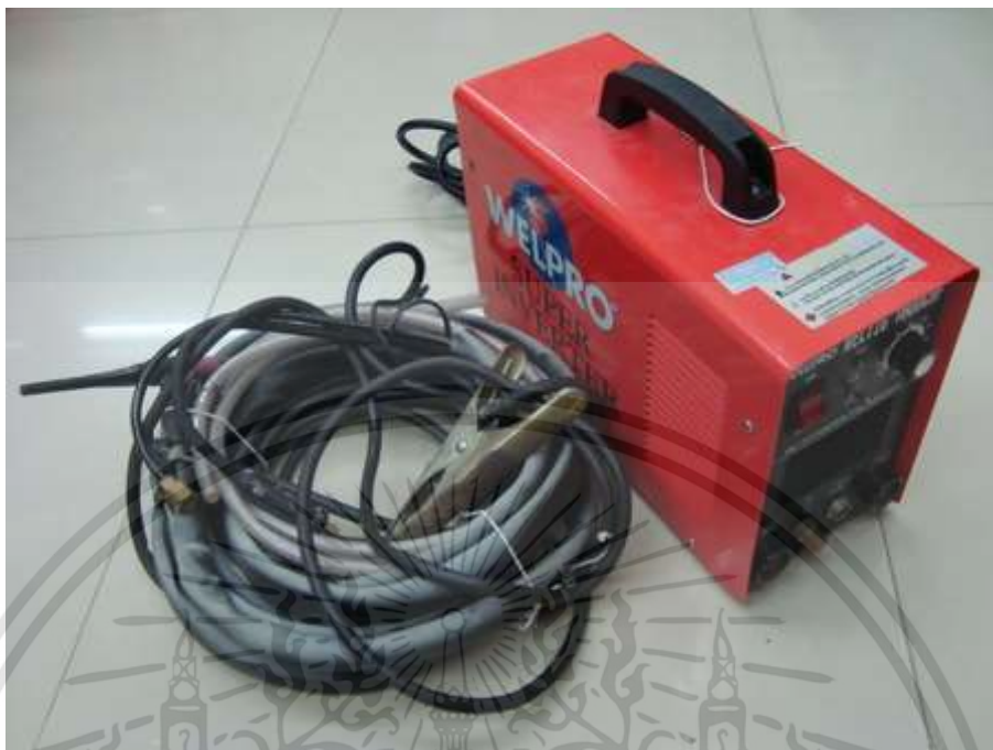
ภาพที่ 3.16 : ตู้เชื่อมเหล็ก