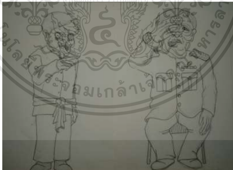
ภาพที่ 3.8 : ภาพร่างโครงการที่ 2 ชั้นที่ 4

เอกสารนี้เป็นเอกสารที่สงวนไว้สำหรับการใช้งานเพื่อการศึกษาเท่านั้น ไม่อนุญาตให้นำไปใช้ประโยชน์ด้านการค้า ไม่ว่าจะกรณีใดๆทั้งสิ้น อีกทั้งห้ามมิให้ดัดแปลงเนื้อหา และต้องอ้างอิงถึงเจ้าของเอกสารทุกครั้งที่มีการนำไปใช้