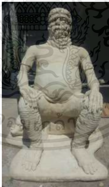
ภาพที่ 3.21 : กระบวนการสร้างงาน ขั้นตอนที่ 4

ขั้นตอนที่ 3 เมื่อนะตะแกรงรวดมาหุ้มโครงสร้างโดยทั่วแล้ว ก็นำปูนซีเมนต์มาขึ้นรูปไว้ชั้นแรกบาง ๆ รอจนแห้งสนิท