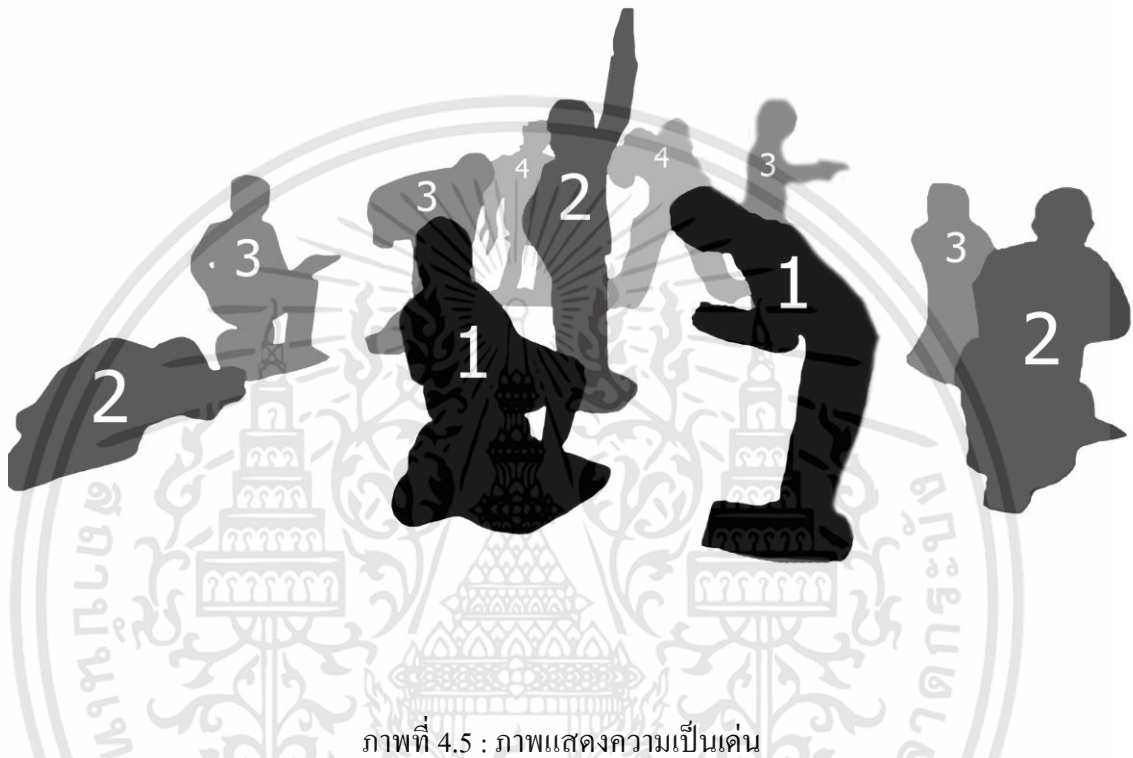
ภาพที่ 4.5 : ภาพแสดงความเป็นเด่น

ความเป็นเด่น คือ บริเวณหรือส่วนประกอบภายในภาพผลงานที่มีความสำคัญ เป็นส่วนที่ดึงดูดสายตามากที่สุด ซึ่งในการสร้างสรรค์ผลงานนั้น การสร้างจุดเด่นภายในผลงานเป็นเรื่องที่สำคัญ เพราะเป็นการดึงดูดและชักจูงให้ผู้ดูเกิดความสนใจ (ฟารุต สมักรไทย, ออนไลน์ : 18)