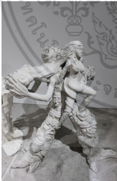
ภาพที่ 4.7: รูปทรง ข.

ก. รูปทรงบุคคลที่คิดเพี้ยนไปจากมนุษย์ปกติ แบ่ง ออกเป็น 3 ส่วน คือ ส่วนใบหน้า ส่วนผิวและส่วนเสื้อผ้า หมายถึง มนุษย์ในท่าทางที่บ่งบอกถึงความเป็นบุคคล การกระทำที่ก่อให้เกิดบาป รูปทรงที่เกิดขึ้นจะผิดเพี้ยน ไปจากธรรมชาติเพราะเนื่องมาจากผลจากบาป