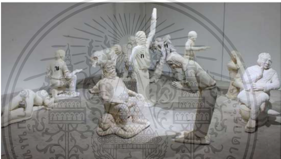
ภาพที่ 4.11 :: การวิเคราะห์สี

สี ถือเป็นปรากฏการณ์ธรรมชาติอย่างหนึ่ง โดยสามารถแบ่งสีได้ออกเป็น 2 ประเภทคือ สีที่เกิดขึ้นจากการหักเหของแสงกับสีที่เกิดขึ้นจากตัววัตถุ สีนั้นถือเป็นทัศนธาตุที่มีความสำคัญมากที่สุดอย่างหนึ่ง โดยเป็นทัศนธาตุที่มีคุณสมบัติของทัศนธาตุอื่น ๆ รวมอยู่ด้วย โดยสีนั้นสามารถถ่ายทอดอารมณ์ความคิด ความรู้สึกหรือแม้กระทั่งเป็นสัญลักษณ์ของบางสิ่ง (ชูลุด นิมเมสมอ, 2554 : 48)