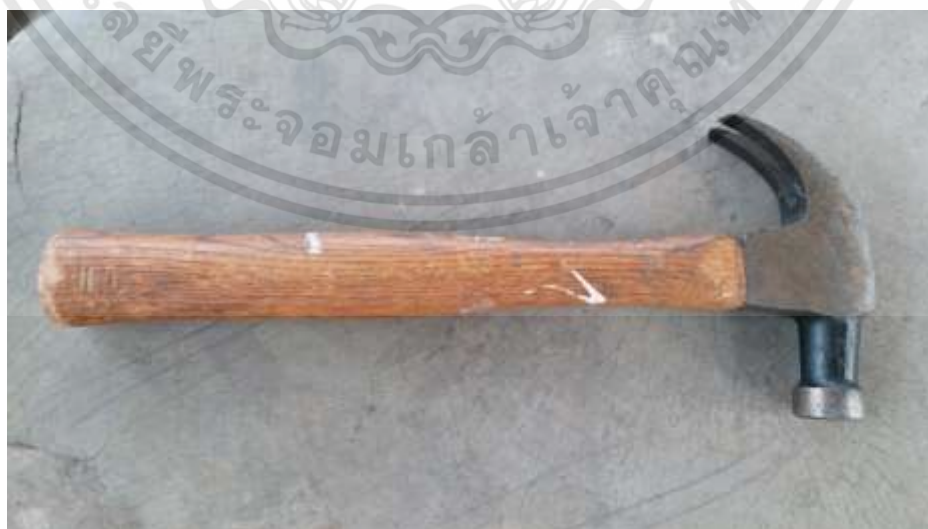
ภาพที่ 3.15 : ค้อน

เอกสารนี้เป็นเอกสารที่สงวนไว้สำหรับการใช้งานเพื่อการศึกษาเท่านั้น ไม่อนุญาตให้นำไปใช้ประโยชน์ด้านการค้า ไม่ว่าจะกรณีใดๆทั้งสิ้น อีกทั้งห้ามมิให้ดัดแปลงเนื้อหา และต้องอ้างอิงถึงเจ้าของเอกสารทุกครั้งที่มีการนำไปใช้