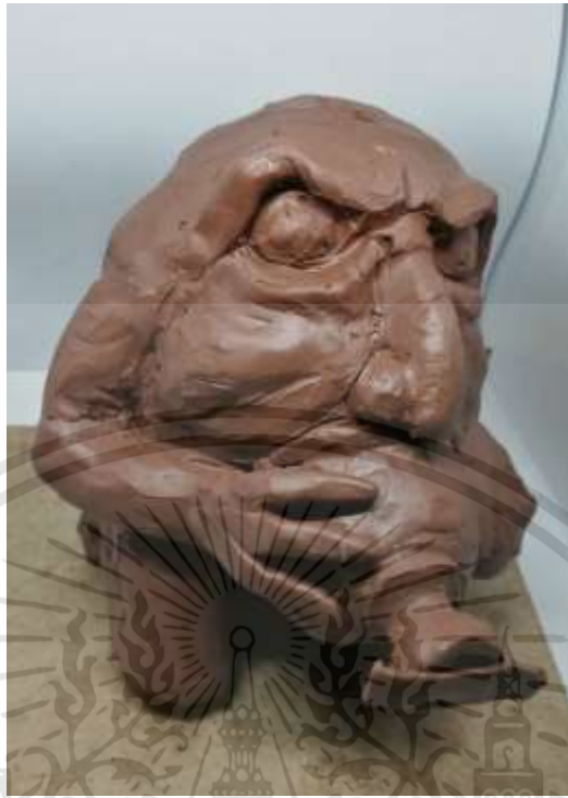
ภาพที่ 3.7 : ภาพร่างโครงการที่ 2 ชั้นที่ 3