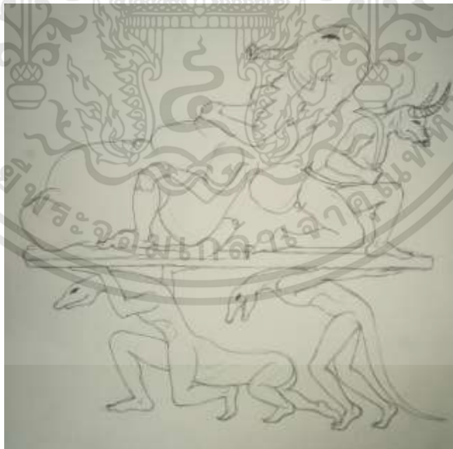
ภาพที่ 3.1 : ภาพร่างโครงการที่ 1 ชั้นที่ 1

เอกสารนี้เป็นเอกสารที่สงวนไว้สำหรับการใช้งานเพื่อการศึกษาเท่านั้น ไม่อนุญาตให้นำไปใช้ประโยชน์ด้านการค้า ไม่ว่ากรณีใดๆทั้งสิ้น อีกทั้งห้ามมิให้ดัดแปลงเนื้อหา และต้องอ้างอิงถึงเจ้าของเอกสารทุกครั้งที่มีการนำไปใช้