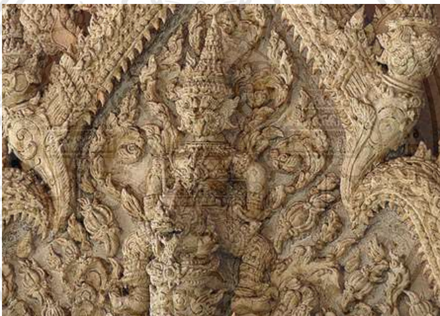
ภาพที่ 2.7 : ลวดลายปูนปั้นที่หน้าบรรณ วัดมหาธาตุวรวิหาร,เพชรบุรี

ปูนสดแบบไทย เป็นปูนสูตรปูนขาวผสมกับทรายละเอียด กาวหนังสัตว์ เส้นใยพืช น้ำตาล ข้าวเหนียวต้มและน้ำ (สูตรนี้ได้จากช่างปั้นชาวเพชรบุรีเมื่อครั้งซ่อมใหญ่วัดพระศรีรัตนศาสดารามในงานสมโภชกรุงรัตนโกสินทร์ครบ 200 ปี) ปูนชนิดนี้มีความคงทนต่อสภาพแดดและฝนเหมาะแก่การใช้งานภายนอกอาคารได้ดี และสามารถใช้งานในอาคารได้ด้วย เนื่องจากเป็นปูนมีการซึมซับน้ำ และมีช่องทางระบายระเหยน้ำได้ดี ไม่มีผลต่อการยืดหรือหดตัวของเนื้อปูนที่เกิดจากการเปลี่ยนแปลงของอุณหภูมิบ่อยๆแต่ก่อนช่างใช้งานได้ยาก ช่างจึงต้องมีทักษะในการใช้งานกับวัสดุชนิดนี้เป็นพิเศษ เนื้อปูนชนิดนี้สามารถเก็บไว้เพื่อใช้งานได้นานเป็นเดือน โดยเก็บหมักไว้ในที่อับชื้น (งานช่างปั้นปูนสด, 2556)