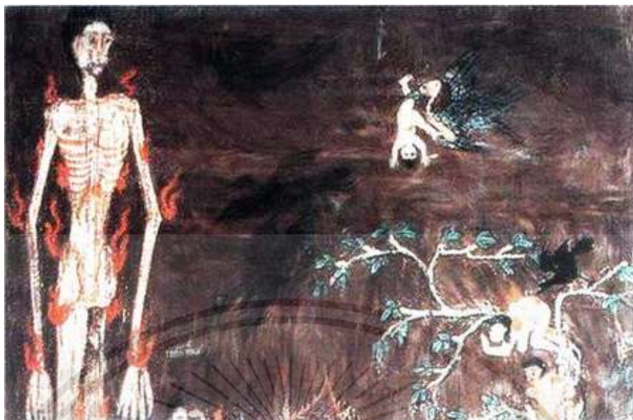
ภาพที่ 2.1 : จิตรกรรมฝาผนัง วัดคูสิดาราม

[Online]. Available : http://sbayjai.com/forum/index.php?topic=1231.0