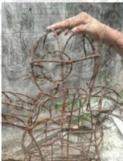
ภาพที่ 3.19 : กระบวนการสร้างงาน ขั้นตอนที่ 2

ขั้นตอนที่ 1 นำเหล็กเส้นมาตัดตามรูปทรงของคน ตามแบบที่ร่างไว้แบบเชื่อมให้ติดเข้าด้วยกัน