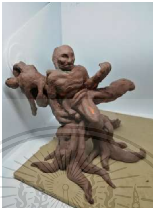
ภาพที่ 3.4 : ภาพร่างโครงการที่ 1 ชั้นที่ 4