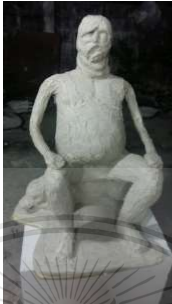
ภาพที่ 3.20 : กระบวนการสร้างงาน ขั้นตอนที่ 3

ขั้นตอนที่ 3 เมื่อนะตะแกรงรวดมาหุ้มโครงสร้างโดยทั่วแล้ว ก็นำปูนซีเมนต์มาขึ้นรูปไว้ชั้นแรกบาง ๆ รอจนแห้งสนิท