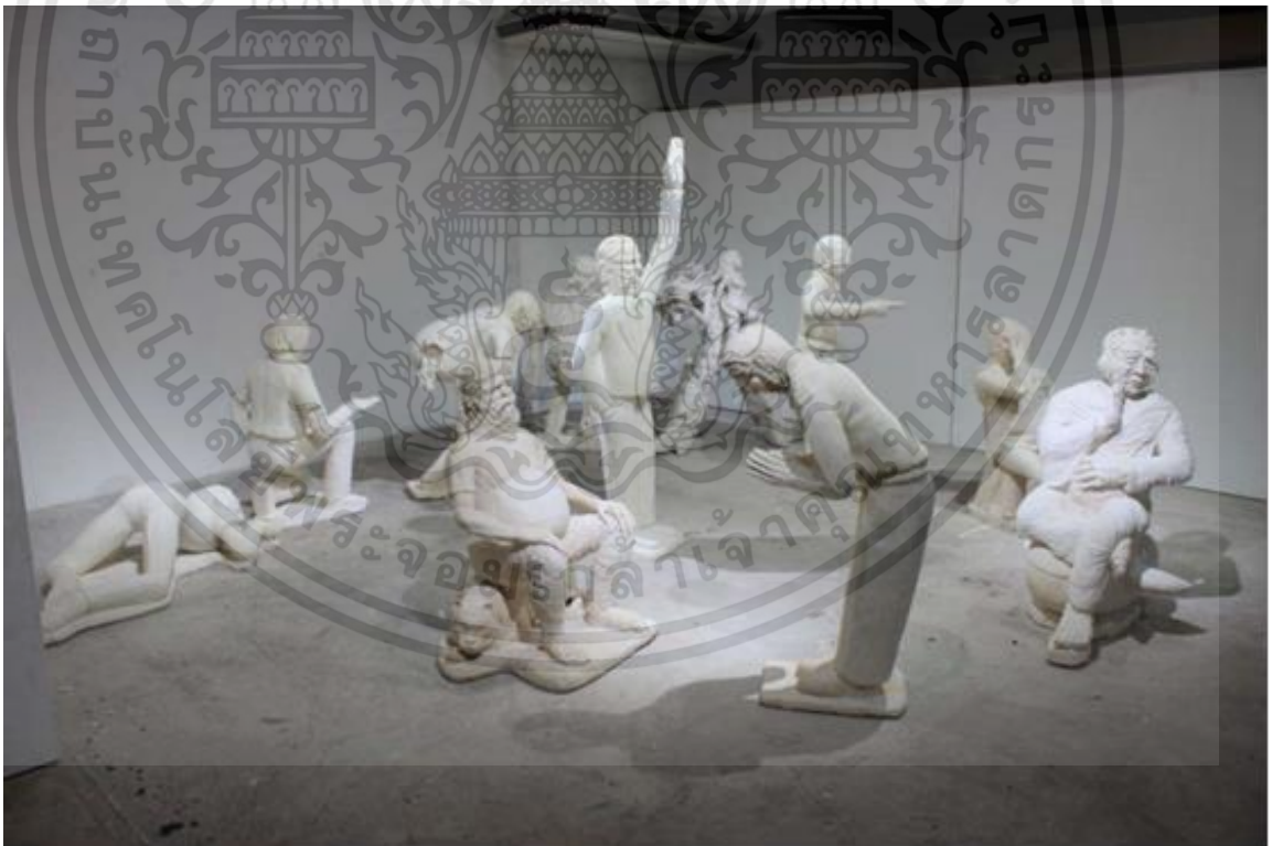
ภาพที่ 4.1 : วิเคราะห์องค์ประกอบศิลป์ ภาพผลงาน "باب"

เอกสารนี้เป็นเอกสารที่สงวนไว้สำหรับการใช้งานเพื่อการศึกษาเท่านั้น ไม่อนุญาตให้นำไปใช้ประโยชน์ด้านการค้า ไม่ว่าจะกรณีใดๆทั้งสิ้น อีกทั้งห้ามมิให้ดัดแปลงเนื้อหา และต้องอ้างอิงถึงเจ้าของเอกสารทุกครั้งที่มีการนำไปใช้