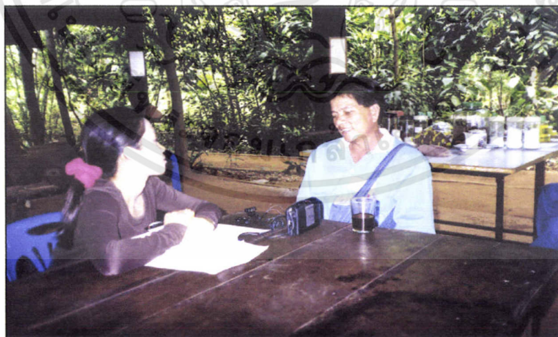
หมู่บ้านหลุมมะขาม

เอกสารนี้เป็นเอกสารที่สงวนไว้สำหรับการใช้งานเพื่อการศึกษาเท่านั้น ไม่อนุญาตให้นำไปใช้ประโยชน์ด้านการค้า ไม่ว่ากรณีใดๆทั้งสิ้น อีกทั้งห้ามมิให้ดัดแปลงเนื้อหา และต้องอ้างอิงถึงเจ้าของเอกสารทุกครั้งที่มีการนำไปใช้