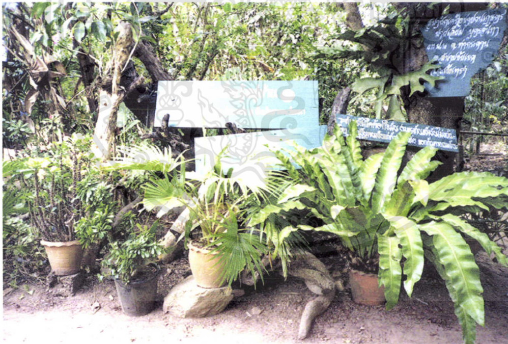
ศูนย์การเรียนรู้หมู่บ้าน

เอกสารนี้เป็นเอกสารที่สงวนไว้สำหรับการใช้งานเพื่อการศึกษาเท่านั้น ไม่อนุญาตให้นำไปใช้ประโยชน์ด้านการค้า ไม่ว่าจะกรณีใดๆทั้งสิ้น อีกทั้งห้ามมิให้ดัดแปลงเนื้อหา และต้องอ้างอิงถึงเจ้าของเอกสารทุกครั้งที่มีการนำไปใช้