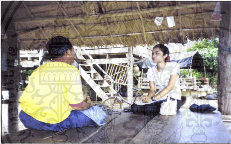
หมู่บ้านทุ่งเหียง