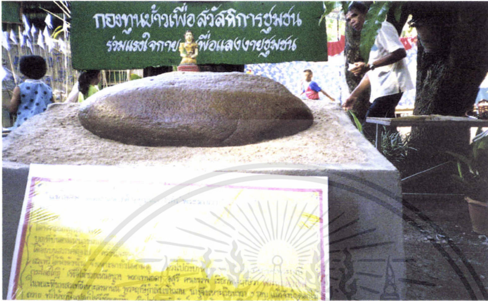
กองทุนข้าวเพื่อสวัสดิการชุมชน