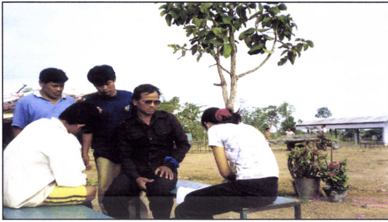
หมู่บ้านทุ่งส่อหงสา