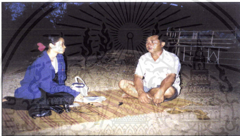
หมู่บ้านนายาว