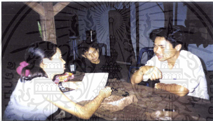
หมู่บ้านท่ากรอย