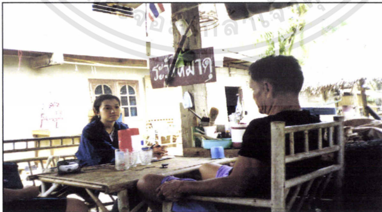
ผู้นำหมู่บ้านท่าเตินท์

เอกสารนี้เป็นเอกสารที่สงวนไว้สำหรับการใช้งานเพื่อการศึกษาเท่านั้น ไม่อนุญาตให้นำไปใช้ประโยชน์ด้านการค้า ไม่ว่ากรณีใดๆทั้งสิ้น อีกทั้งห้ามมิให้ตัดแปลงเนื้อหา และต้องอ้างอิงถึงเจ้าของเอกสารทุกครั้งที่มีการนำไปใช้