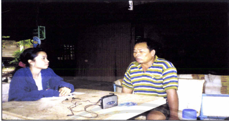
ผู้นำหมู่บ้านไทรทอง