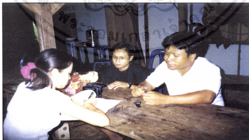
หมู่บ้านนาอีสาน

เอกสารนี้เป็นเอกสารที่สงวนไว้สำหรับการใช้งานเพื่อการศึกษาเท่านั้น ไม่อนุญาตให้นำไปใช้ประโยชน์ด้านการค้า ไม่ว่ากรณีใดๆทั้งสิ้น อีกทั้งห้ามมิให้ดัดแปลงเนื้อหา และต้องอ้างอิงถึงเจ้าของเอกสารทุกครั้งที่มีการนำไปใช้