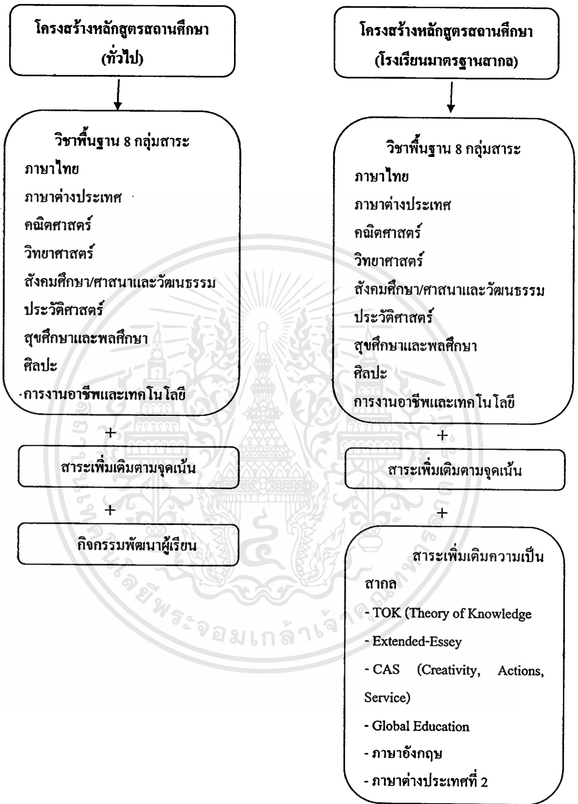
ภาพที่ 2.1 แสดงโครงสร้างหลักสูตรสถานศึกษาโรงเรียนมาตรฐานสากล