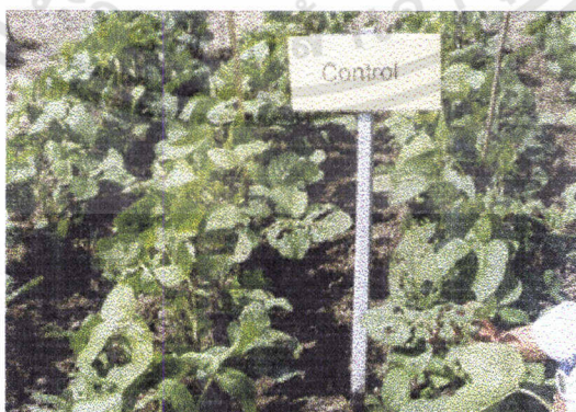
ภาพที่3 แสดงลักษณะการเข้าทำลายถั่วเหลืองฝักสดของแมลงศัตรูพืชในวิธีการไม่