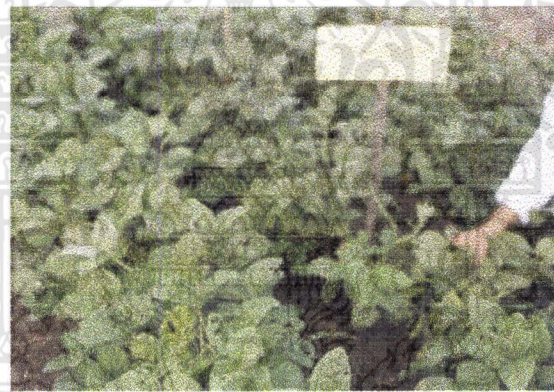
ภาพที่ 8 แสดงผลผลิตของถั่วเหลืองฝักสดในวิธีการฉีดพ่นสารเคมี

เอกสารนี้เป็นเอกสารที่สงวนไว้สำหรับการใช้งานเพื่อการศึกษาเท่านั้น ไม่อนุญาตให้นำไปใช้ประโยชน์ด้านการค้า ไม่ว่ากรณีใดๆทั้งสิ้น อีกทั้งห้ามมิให้ดัดแปลงเนื้อหา และต้องอ้างอิงถึงเจ้าของเอกสารทุกครั้งที่มีการนำไปใช้