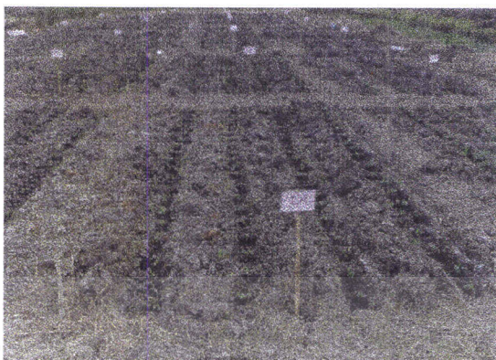
ภาพที่1 แสดงต้นถั่วเหลืองฝักสดอายุ 5 วัน