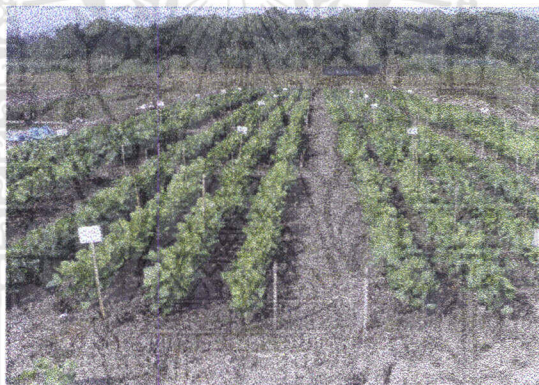
ภาพที่2 แสดงต้นถั่วเหลืองฝักสดอายุ 14 วัน