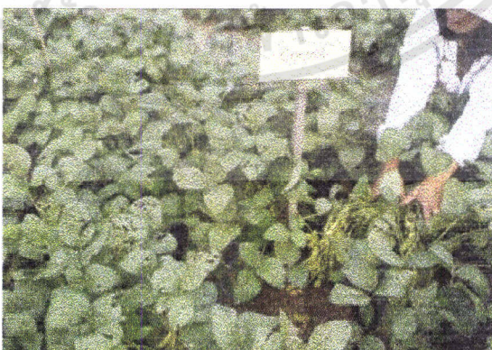
ภาพที่6 แสดงผลผลิตของด้วงเหลืองฝักสดในวิธีการ ไม่ฉีดพ่นสาร

เอกสารนี้เป็นเอกสารที่สงวนไว้สำหรับการใช้งานเพื่อการศึกษาเท่านั้น ไม่อนุญาตให้นำไปใช้ประโยชน์ด้านการค้า ไม่ว่าจะกรณีใดๆทั้งสิ้น อีกทั้งห้ามมิให้ดัดแปลงเนื้อหา และต้องอ้างอิงถึงเจ้าของเอกสารทุกครั้งที่มีการนำไปใช้