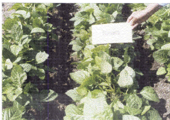
ภาพที่4 แสดงลักษณะการเข้าทำลายด้วงเหลืองฝักสดของแมลงศัตรูพืชในวิธีการใช้สารสกัดจากเมล็ดสะเดา