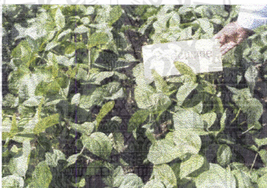
ภาพที่5 แสดงลักษณะการเข้าทำลายด้วงเหลืองฝักสดของแมลงศัตรูพืชในวิธีการฉีดพ่นสารเคมี