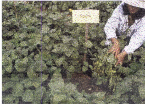
ภาพที่ 7 แสดงผลผลิตของถั่วเหลืองฝักสดในวิธีการใช้สารสกัดจากเมล็ดสะเดา