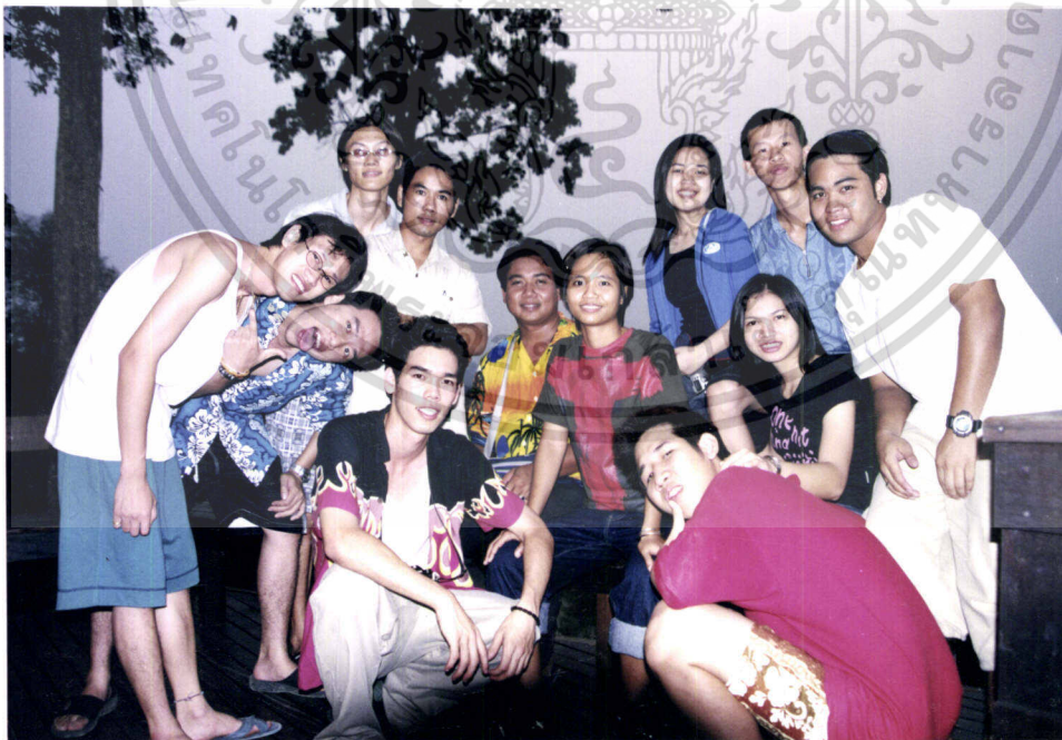
ภาพที่ 7.8 บรรยากาศขณะเดินทางถึงยังสวนป่าทองผาภูมิ

เอกสารนี้เป็นเอกสารที่สงวนไว้สำหรับการใช้งานเพื่อการศึกษาเท่านั้น ไม่อนุญาตให้นำไปใช้ประโยชน์ด้านการค้า ไม่ว่าจะกรณีใดๆทั้งสิ้น อีกทั้งห้ามมิให้ดัดแปลงเนื้อหา และต้องอ้างอิงถึงเจ้าของเอกสารทุกครั้งที่มีการนำไปใช้