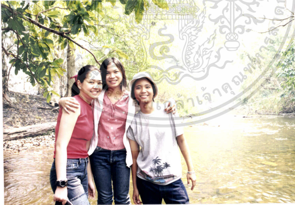
ภาพที่ 7.12 บรรยากาศบริเวณลำธารแม่น้ำน้อย

เอกสารนี้เป็นเอกสารที่สงวนไว้สำหรับการใช้งานเพื่อการศึกษาเท่านั้น ไม่อนุญาตให้นำไปใช้ประโยชน์ด้านการค้า ไม่ว่ากรณีใดๆทั้งสิ้น อีกทั้งห้ามมิให้ดัดแปลงเนื้อหา และต้องอ้างอิงถึงเจ้าของเอกสารทุกครั้งที่มีการนำไปใช้