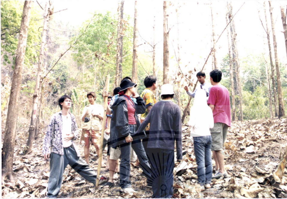
ภาพที่ 7.11 การบรรยายความรู้ระหว่างการทำกิจกรรม