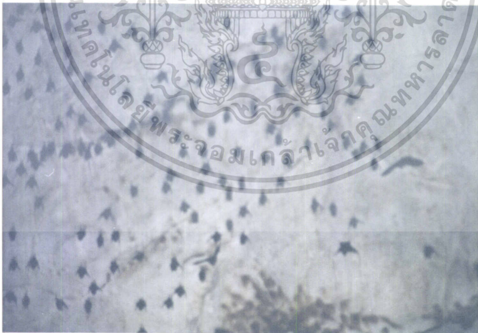
ภาพที่ 7.10 ค้างคาวคุณกิตติ

เอกสารนี้เป็นเอกสารที่สงวนไว้สำหรับการใช้งานเพื่อการศึกษาเท่านั้น ไม่อนุญาตให้นำไปใช้ประโยชน์ด้านการค้า ไม่ว่ากรณีใดๆทั้งสิ้น อีกทั้งห้ามมิให้ดัดแปลงเนื้อหา และต้องอ้างอิงถึงเจ้าของเอกสารทุกครั้งที่มีการนำไปใช้