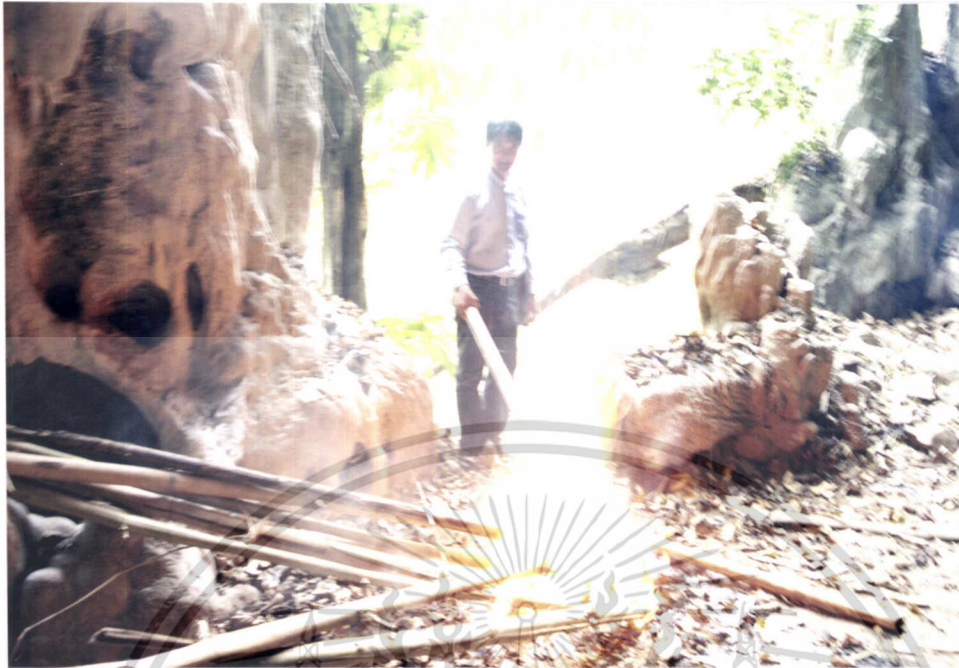
ภาพที่ 7.9 การเตรียมอุปกรณ์ให้แสงสว่างเพื่อใช้ภายในถ้ำ