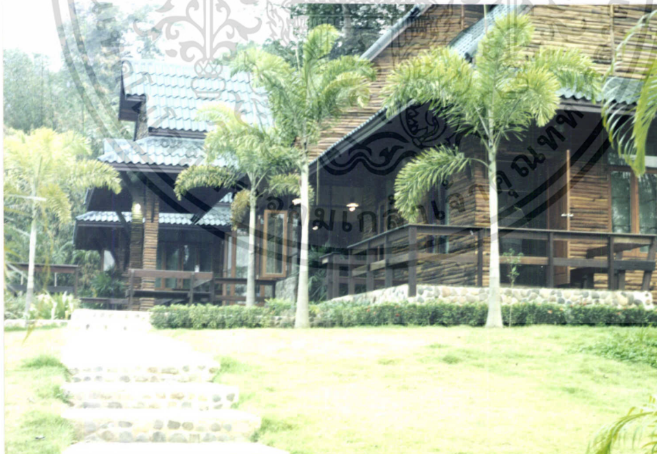
ภาพที่ 7.2 บ้านพักหลังใหญ่ (บ้านราชพฤกษ์)

เอกสารนี้เป็นเอกสารที่สงวนไว้สำหรับการใช้งานเพื่อการศึกษาเท่านั้น ไม่อนุญาตให้นำไปใช้ประโยชน์ด้านการค้า ไม่ว่าจะกรณีใดๆทั้งสิ้น อีกทั้งห้ามมิให้ดัดแปลงเนื้อหา และต้องอ้างอิงถึงเจ้าของเอกสารทุกครั้งที่มีการนำไปใช้