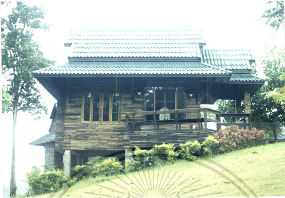
ภาพที่ 7.3 บ้านพักหลังเล็ก (บ้านจันทร์กะพ้อ)