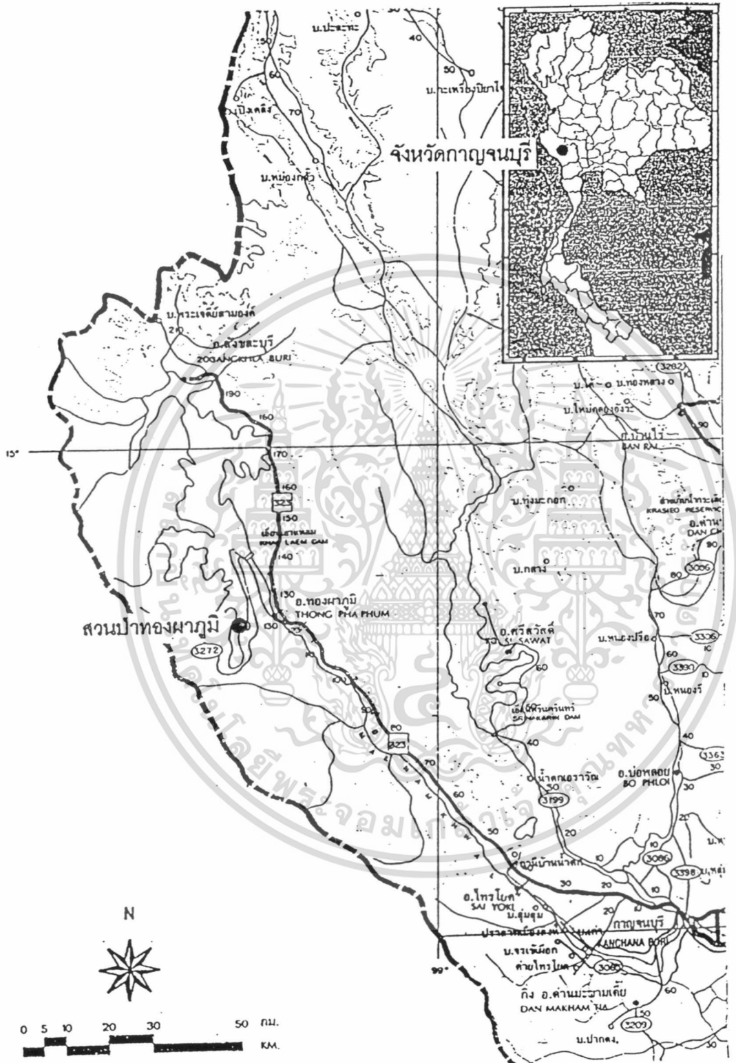
ภาพที่ 6.1 ตำแหน่งและที่ตั้งของสวนป่าทองผาภูมิ

เอกสารนี้เป็นเอกสารที่สงวนไว้สำหรับการใช้งานเพื่อการศึกษาเท่านั้น ไม่อนุญาตให้นำไปใช้ประโยชน์ด้านการค้า ไม่ว่ากรณีใดๆทั้งสิ้น อีกทั้งห้ามมิให้ดัดแปลงเนื้อหา และต้องอ้างอิงถึงเจ้าของเอกสารทุกครั้งที่มีการนำไปใช้