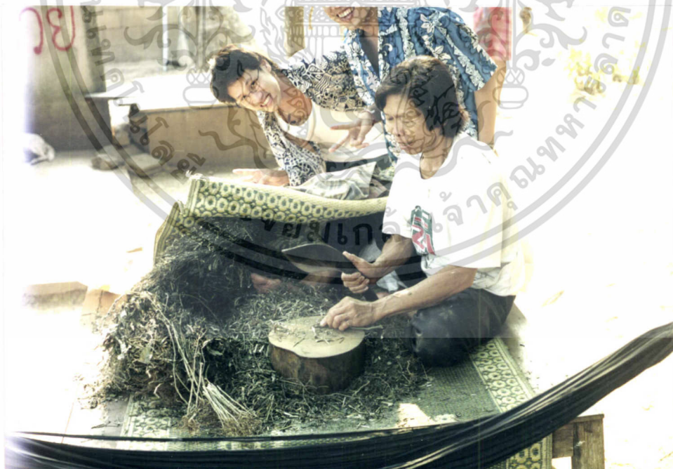
ภาพที่ 7.6 การแปรรูปสมุนไพรพื้นบ้าน (ฟ้าทะลายโจร)

เอกสารนี้เป็นเอกสารที่สงวนไว้สำหรับการใช้งานเพื่อการศึกษาเท่านั้น ไม่อนุญาตให้นำไปใช้ประโยชน์ด้านการค้า ไม่ว่าจะกรณีใดๆทั้งสิ้น อีกทั้งห้ามมิให้ดัดแปลงเนื้อหา และต้องอ้างอิงถึงเจ้าของเอกสารทุกครั้งที่มีการนำไปใช้