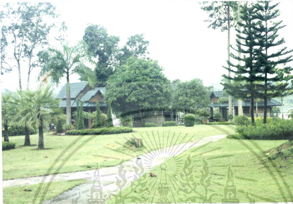
ภาพที่ 7.1 บรรยากาศบริเวณศูนย์ศึกษาธรรมชาติ สวนป่าทองผาภูมิ