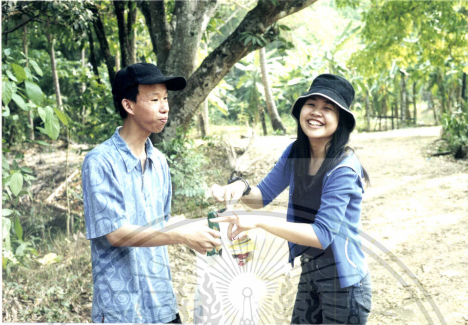
ภาพที่ 7.5 การเก็บขยะเพื่อรักษาความสะอาด