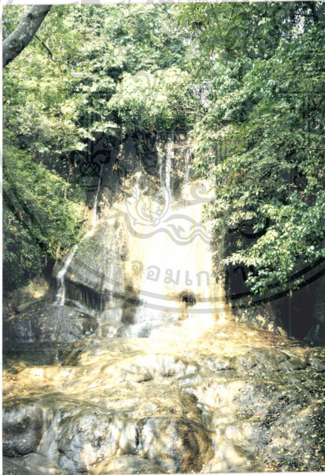
ภาพที่ 7.4 น้ำตกโทรโขคน้อย

เอกสารนี้เป็นเอกสารที่สงวนไว้สำหรับการใช้งานเพื่อการศึกษาเท่านั้น ไม่อนุญาตให้นำไปใช้ประโยชน์ด้านการค้า ไม่ว่าจะกรณีใดๆทั้งสิ้น อีกทั้งห้ามมิให้ดัดแปลงเนื้อหา และต้องอ้างอิงถึงเจ้าของเอกสารทุกครั้งที่มีการนำไปใช้