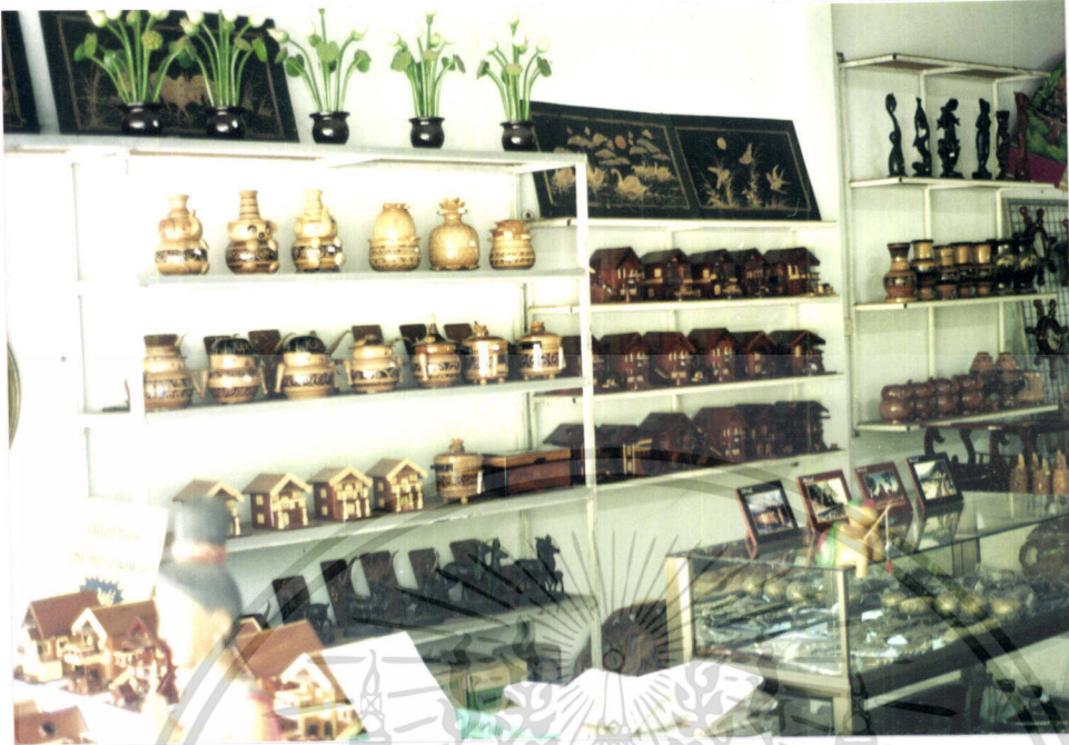
ภาพที่ 7.7 การนำทรัพยากรที่หาได้จากท้องถิ่นมาแปรรูปเป็นผลิตภัณฑ์