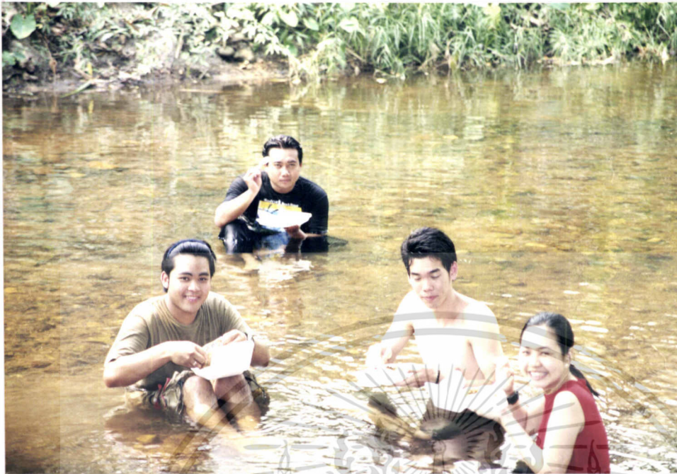
ภาพที่ 7.13 การรับประทานอาหารกลางวันท่ามกลางธรรมชาติ

เอกสารนี้เป็นเอกสารที่สงวนไว้สำหรับการใช้งานเพื่อการศึกษาเท่านั้น ไม่อนุญาตให้นำไปใช้ประโยชน์ด้านการค้า ไม่ว่ากรณีใดๆทั้งสิ้น อีกทั้งห้ามมิให้ดัดแปลงเนื้อหา และต้องอ้างอิงถึงเจ้าของเอกสารทุกครั้งที่มีการนำไปใช้