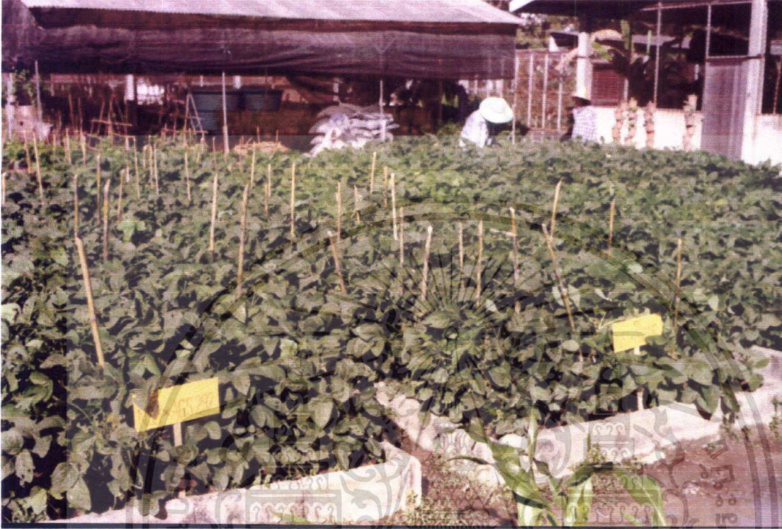
ภาพที่ 2 สภาพแปลงปลูกที่ใช้ในการคัดเลือก

เอกสารนี้เป็นเอกสารที่สงวนไว้สำหรับการใช้งานเพื่อการศึกษาเท่านั้น ไม่อนุญาตให้นำไปใช้ประโยชน์ด้านการค้า ไม่ว่าจะกรณีใดๆทั้งสิ้น อีกทั้งห้ามมิให้ดัดแปลงเนื้อหา และต้องอ้างอิงถึงเจ้าของเอกสารทุกครั้งที่มีการนำไปใช้