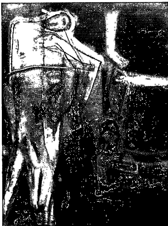
ภาพที่4.1 แสดงโครงสร้างขององค์ประกอบหลัก