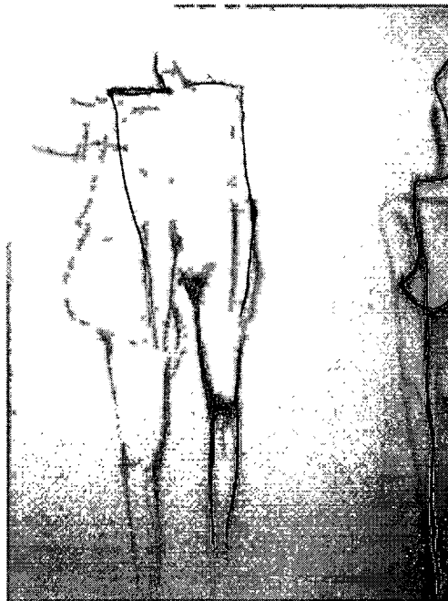
ภาพที่3.2 ตัวอย่างภาพร่างลายเส้น

วิธีการสร้างสรรค์ผลงานคือ การเตรียมอุปกรณ์การวาดภาพให้พร้อม เพื่อที่จะสามารถแสดงอารมณ์ เจตนาอารมณ์ ความรู้สึกนึกคิดที่จะแสดงออกอย่างฉับพลัน และรวดเร็ว วิธีการผลิตสร้างผลงานศิลปะจึงสร้างทั้งภาพร่างและการสร้างผลงานจริงลงมือปฏิบัติไปพร้อมๆกัน โดยให้ความอิสระในเรื่องของการเทีร์่างภาพด้วยดินสอ ให้เทคนิคต่างๆเกิดขึ้นมาด้วยความบังเอิญ โดยไม่ต้องคาดคะเน ควบคุม กำหนดขอบเขต จำกัดพื้นที่รูปร่าง รูปทรงในการสร้างสรรค์ผลิตผลงานศิลปะ