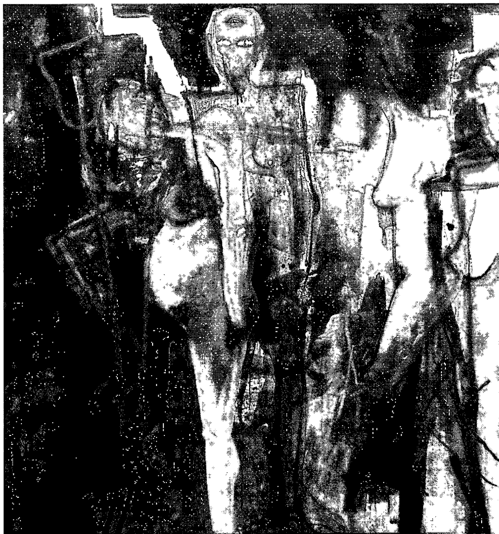
ภาพที่4.7 กรรมเป็นเงา หมายเลข 3. 2552. สีนํ้ามันบนผ้าใบ.140 x 160 เซนติเมตร