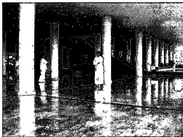
ภาพที่ 3.1 ตัวอย่างภาพการเดินทาง ไปศึกษาหาข้อมูล

ที่มาของข้อมูลได้มาจากการศึกษาที่เกี่ยวกับศาสนาในเรื่องของกฎแห่งกรรม การอ่านบทความที่เขียนโดยผู้มีประสบการณ์ต่างๆในเรื่องของกรรม บางครั้งการออกไปศึกษาค้นหาข้อมูลโดยการ ฟังเทศน์ ซึ่งเทศนา โดยพระและผู้ถือศีล ที่มีเนื้อหาสาระเกี่ยวกับการเกิด แก่ เจ็บ ตาย การเวียนว่ายตายเกิด ภูษชาติ จากการที่ได้ศึกษาในเรื่องนี้ ทั้งการอ่าน การฟัง ทำให้เกิดความเข้าใจในเรื่องนี้ในระดับหนึ่ง จึงนำมา ผสมผสานเข้ากับการจินตนาการ มาคิดต่อยอดจากการที่ได้ไปค้นคว้าศึกษาข้อมูลที่ได้มา และนำออกมาสู่การถ่ายทอดมาเป็นผลงานจิตรกรรม