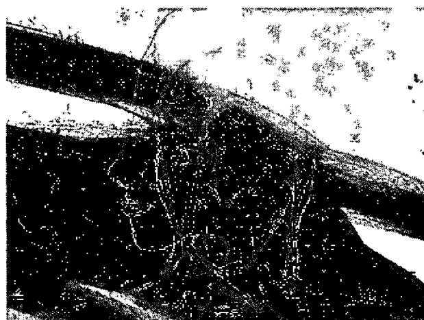
ภาพที่3.4 ตัวอย่างภาพร่างลายเส้น