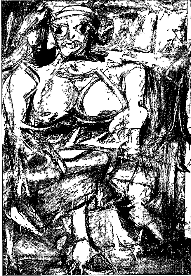
ภาพที่ 2.5 WILLEM DE KOONING. WOMAN I. 1953. สีน้ำมันบนผ้าใบ. 194x124 เซนติเมตร