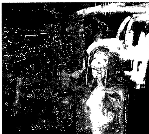
ภาพที่4.2 แสดงโครงสร้างขององค์ประกอบหลัก

โครงสร้างหลักประกอบด้วยรูปทรงมีเป็นรูปร่างคนเป็นหลักจะถูกจัดวางอยู่ด้านใดด้านหนึ่งของภาพ และจะเป็นตำแหน่งเดียวที่มีการลงสีให้สอดคล้องกับรูปทรงนั้นๆ ดังในตัวอย่างเป็นรูปทรงคนก็จะมี การลงสีให้คล้ายกับสีของเนื้อคน นี่คือการจัดวางองค์ประหลัของผลงาน