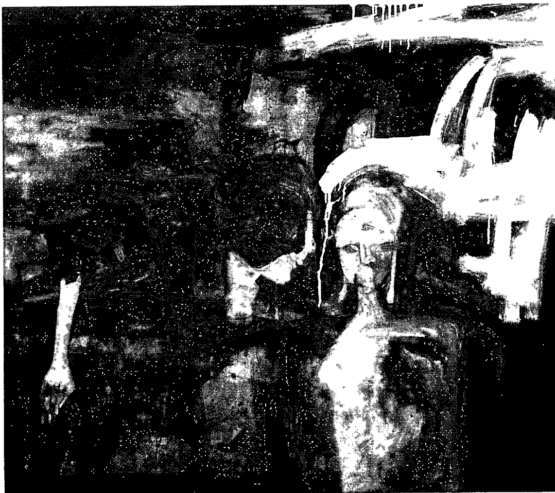
ภาพที่ 4.8 กรรมเป็นเงา หมายเลข 4. 2552. สีน้ำมันบนผ้าใบ. 140 x 160 เซนติเมตร