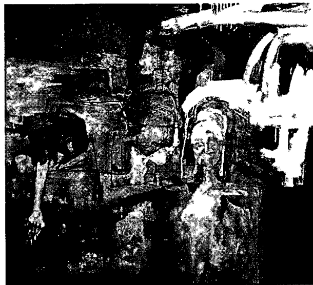
ภาพที่4.4 แสดงจังหวะอ่อนแก่

จะเห็นได้ว่าน้ำหนักอ่อนที่สุดก็คือสีขาวและสีขาวจะถูกลวงอยู่ในตำแหน่งที่ชิดกับสีที่เข้มที่สุด เพื่อให้เกิดความชัดเจน ตัดกันระหว่างรูปทรงด้านหน้าบนพื้นหลัง หรือเพื่อให้เป็นการเชื่อมระหว่างน้ำหนักอ่อน กลาง ไปจนเข้มที่สุด ทำให้มีมิติของภาพ ความตื้น ความลึก