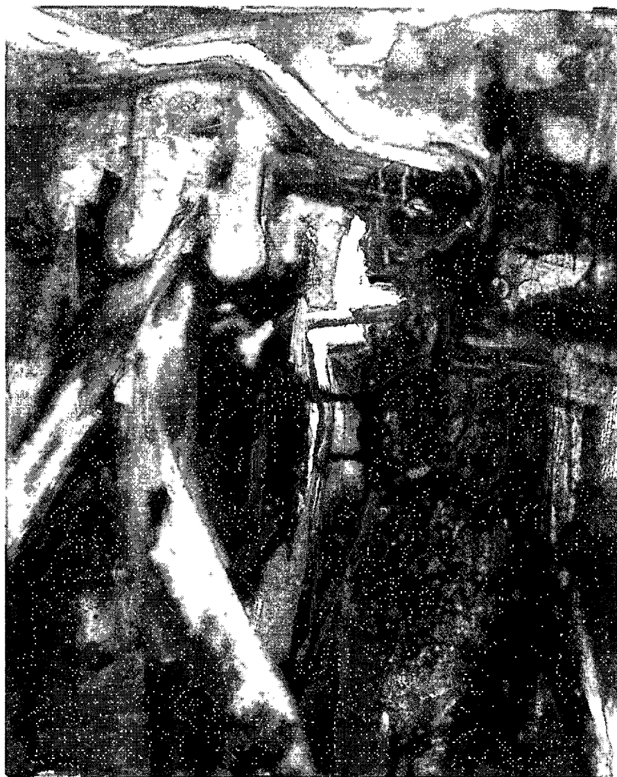
ภาพที่ 4.9 กรรรมเป็นเงา หมายเลข 5. 2552. สีน้ำมันบนผ้าใบ. 80 x 100 เซนติเมตร