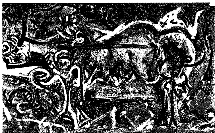
ภาพที่ 2.2 JACKSON POLLOCK. THE SHE - WOLF. 1943. สีน้ำมันบนผ้าใบ. 104x170 เซนติเมตร

Action Painting ศิลปินกลุ่มนี้จะเป็นศิลปินอเมริกันเสียส่วนใหญ่ แต่พัฒนาการของศิลปะแบบนี้ นั้น คงมาจาก อิทธิพลจากศิลปะหลายๆแนวทางก่อนหน้านี้นี้ ไม่ว่าจะเป็น Dadaists, Futurists, Surrealists และอื่นๆ อีกหลาย แนวทาง ศิลปินในแบบ Action Painting ที่ทำงานในแนวนี้ได้โดดเด่นมากก็คือ Jackson Pollock เป็น ศิลปิน Abstract Expressionism ในแบบ Action Painting กล่าวคือ เขาเป็นศิลปินที่ใช้สี โดยการหยดสีลงบน ผืนผ้าใบ ในขณะที่ตัวเขาก็เดินเข้าไปบนผืนผ้าใบ ที่วางแผ่ไว้กับผืนนั้นด้วย ซึ่งเขาไม่ได้ใช้