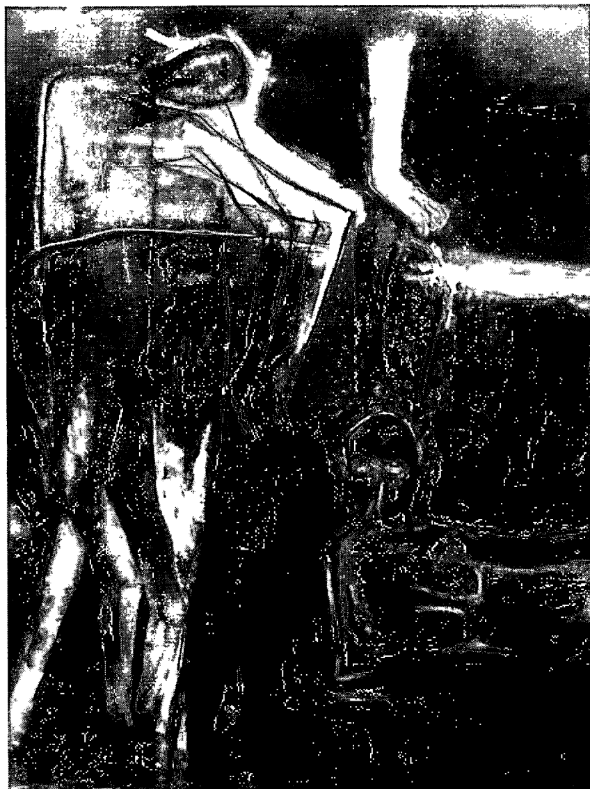
ภาพที่4.5 กรรมเป็นเงา หมายเลข 1. 2552. สีน้ำมันบนผ้าใบ.140 x 160 เซนติเมตร