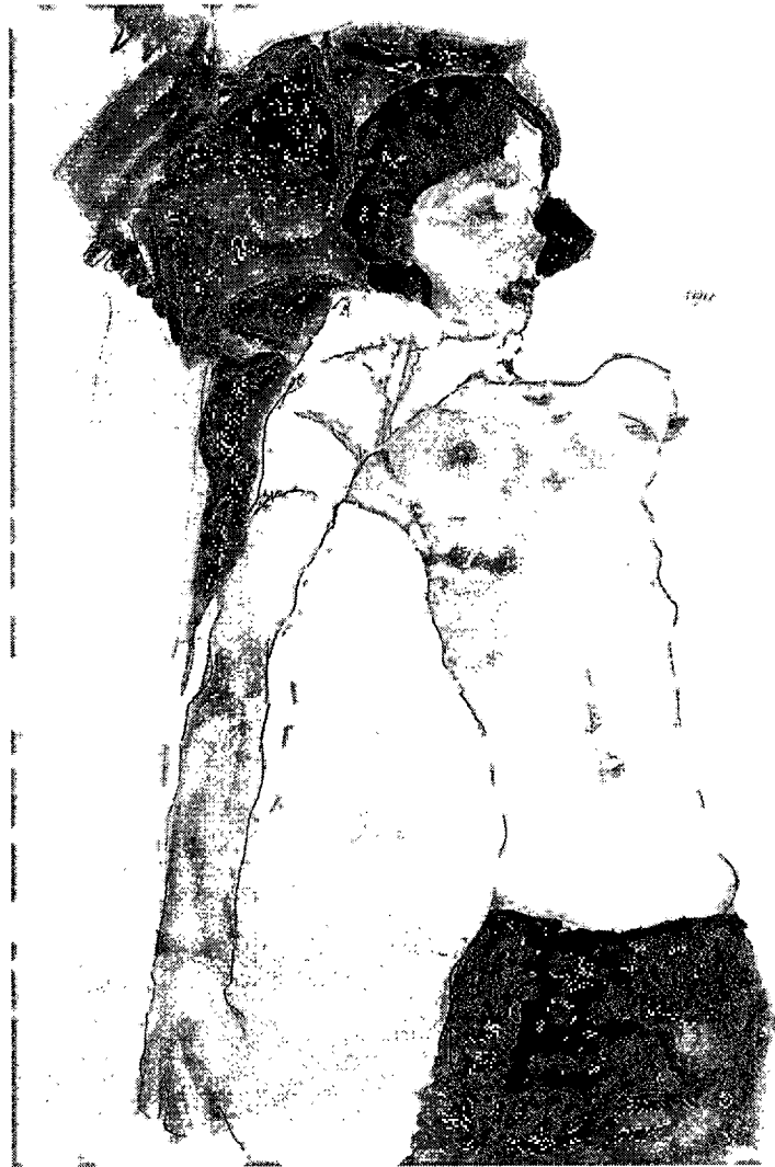
ภาพที่ 2.9 SEMI – NUDE GIRL, RECHLINING 1911. สีน้ำและดินสอพบนกระดาษ. 115x78 เซนติเมตร

ผลงานศิลปะของ EGON SCHIELE นี้ ข้าพเจ้าได้รับอิทธิพลจากรูปแบบการลงสีชาวข้างรูปทรงคน ทำให้รูปทรงคนนี้มีความเด่นชัดขึ้นมา ประกอบกับลายเส้นที่วาดขึ้นมาอย่างเรียบง่ายแต่ลงตัวนี้ ข้าพเจ้าได้นำมาประยุกต์ปรับใช้ในงานศิลปะ