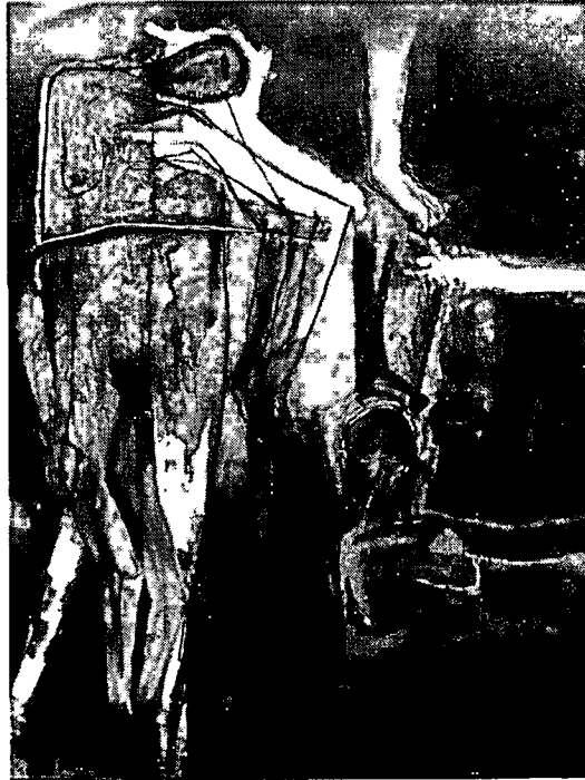
ภาพที่4.3 แสดงจังหวะน้ำหนักอ่อนแก่