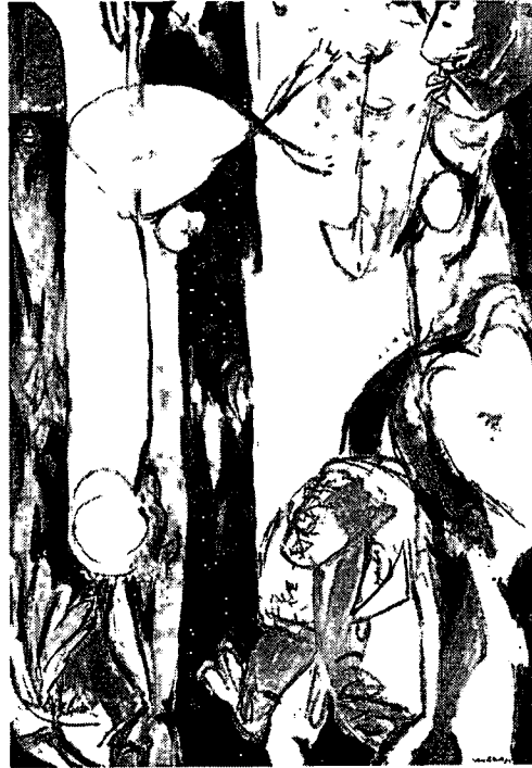
ภาพที่2.3 JACKSON POLLOCK. ESTER AND THE TOTEM. 1953. สีน้ำมันบนผ้าใบ. 213x174

วิธีการระบายสีตามปกติ สีที่ Pollock ใช้หยดลงบนผืนผ้าใบนี้ จะเป็นการหยดสีที่มีแนวสาน และ ซ้อนกัน เป็นชั้นๆอยู่ทั่วๆ ไป ซึ่งทำให้เกิดพื้นที่ ที่ว่างบนผืนผ้าใบขึ้น และบริเวณพื้นที่ว่างนี้เอง ได้เกิดงานศิลปะ ขึ้นมา ด้วยลีลาความเคลื่อนไหวของเขา ที่ถูกบันทึกไว้