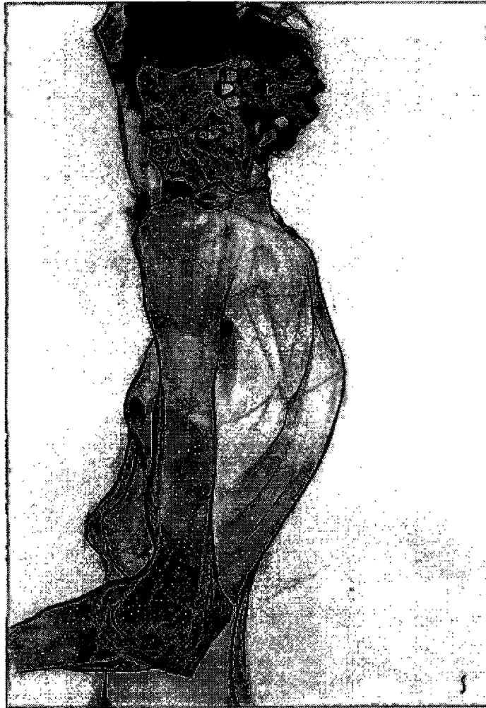
ภาพที่ 2.8 SELF – PORTARAIT WITH ARM TWISTING ABOVE HEAD 1910. สีน้ำและดินสอพบน กระดาษ. 107x74 เซนติเมตร

อย่างมากแก่เขาเป็นอย่างมาก และเขาก็เสียชีวิตด้วยโรคเดียวกัน ในวันที่ 31 ตุลาคม ของปีเดียวกัน เป็นการ ปิดฉากชีวิตอันน่าเศร้าของศิลปินผู้ยิ่งใหญ่นาม EGON SCHIELE