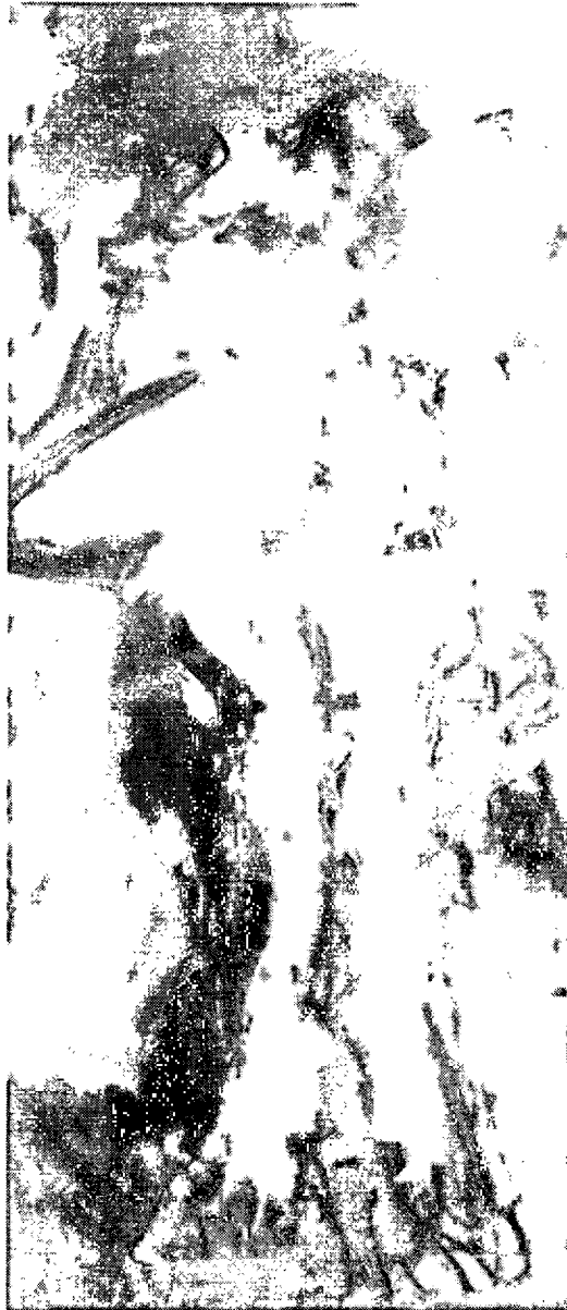
ภาพที่ 2.7 WILLEM DE KOONING . WOMAN ACCABANAC. 1966. สีน้ำมันบนผ้าใบ. 200x88 เซนติเมตร