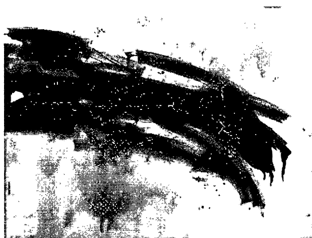
ภาพที่3.3 ตัวอย่างภาพร่างการแสดงออกอย่างฉับพลัน