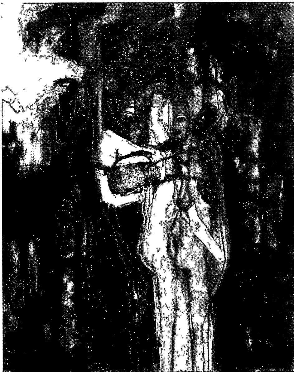
ภาพที่ 4.6 กรรมเป็นเงา หมายเลข 2. 2552. สีน้ำมันบนผ้าใบ. 140 x 160 เซนติเมตร