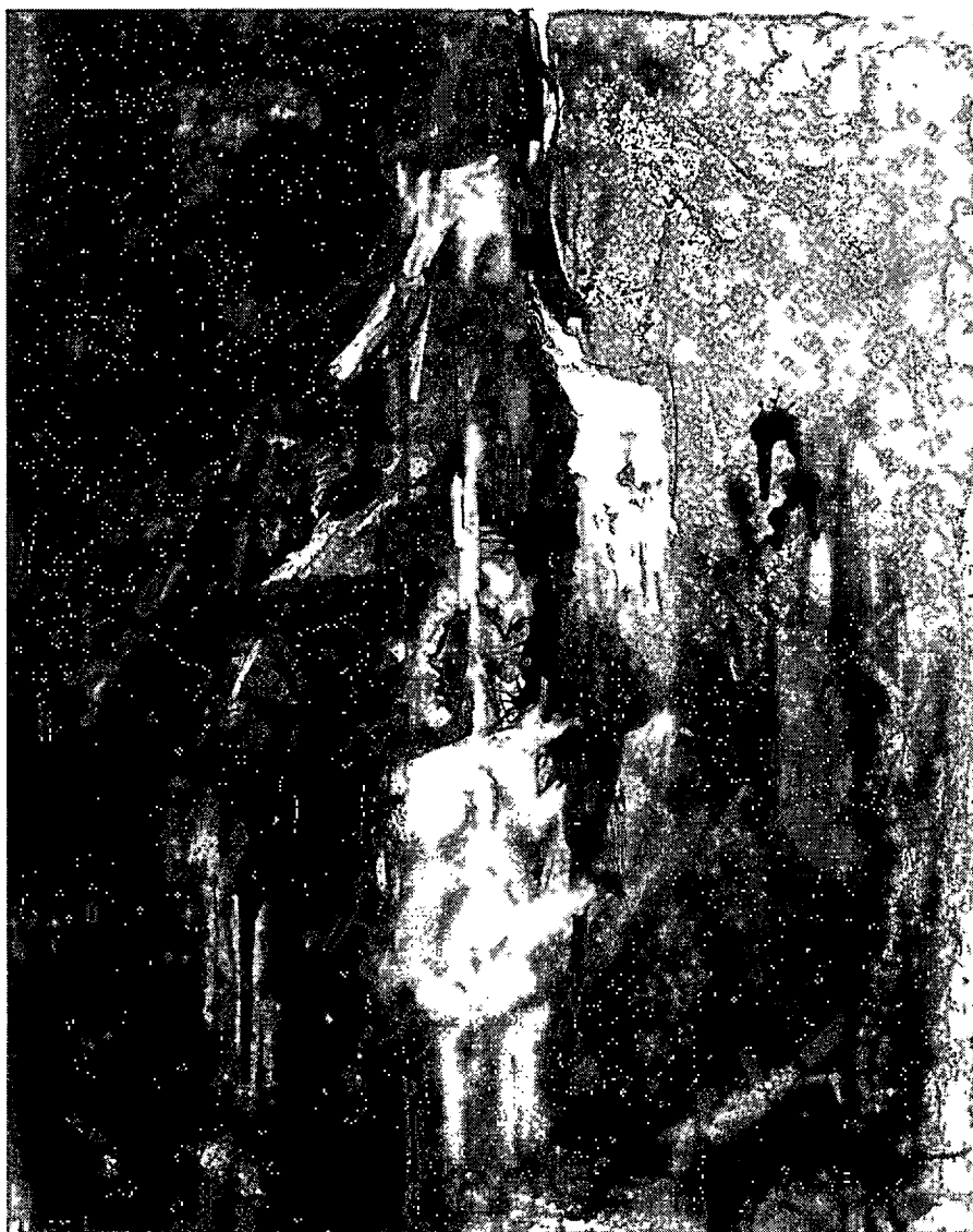
ภาพที่ 4.10 กรรมเป็นเงา หมายเลข 6. 2552. สีนํ้ามันบนผ้าใบ. 80 x 100 เซนติเมตร