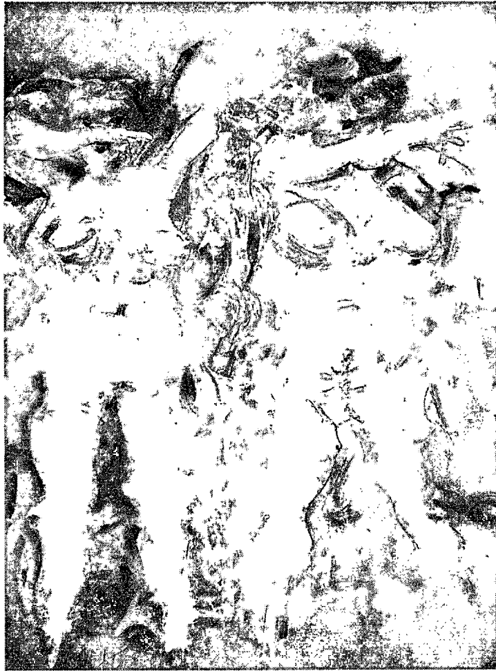
ภาพที่ 2.6 WILLEM DE KOONING. CLAM DIGGERS. 1963. สีน้ำมันบนผ้าใบ. 130x93 เซนติเมตร

ผลงานศิลปะของ WILLEM DE KOONING นี้จะเห็นได้ถึงความโดดเด่นในเรื่องของรอยที่แปร่งในการทัวคัพักัน ความกล้าหาญในการลงสีทิ้งให้เป็นรอยแปร่งนี้ มีความพิเศษ ข้าพเจ้าจึงนำเอาความเป็นลักษณะพิเศษของ WILLEM DE KOONING มาทดลองในผลงาน