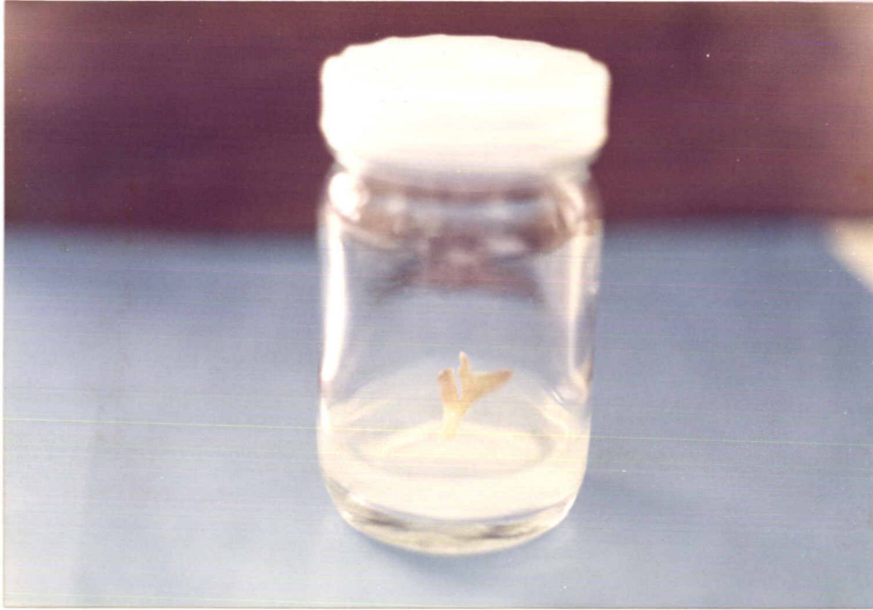
6-Azauracil ที่ระดับความเข้มข้น 10 mg/l