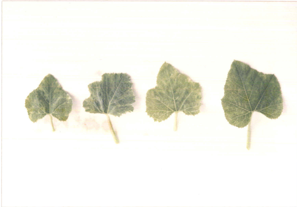
ภาพผนวกที่ 2 แสดงลักษณะใบต่างฟักทองเนื่องจากได้รับการปลูกเชื้อและถ่ายทอดเชื้อ Papaya Ring Spot Virus (PRSV)