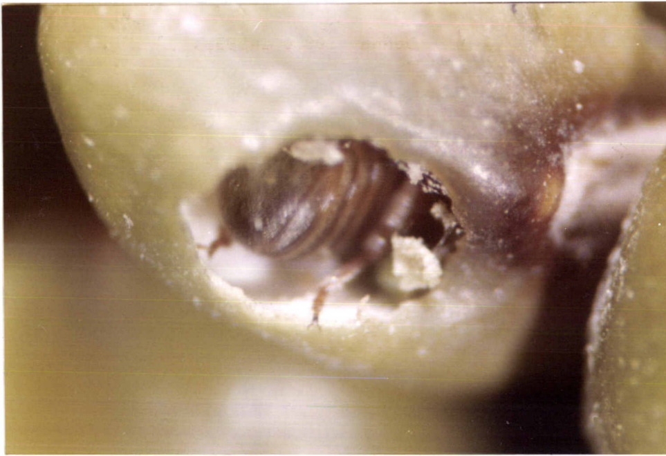
ภาพที่ 2. ลักษณะของการทำลายของด้วงถั่วเขียวในเมล็ดถั่วเขียว