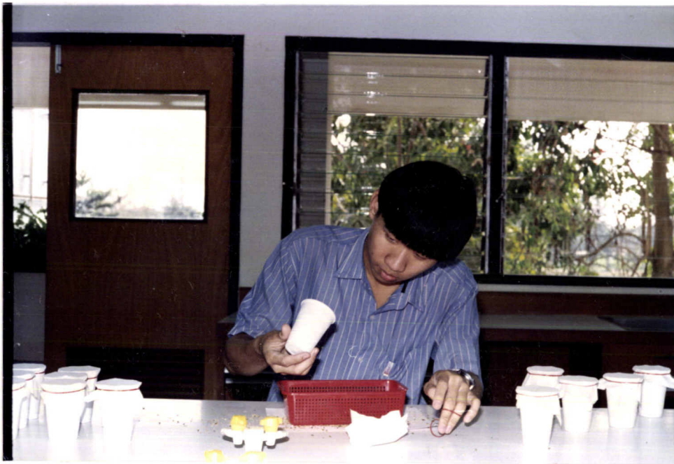
ภาพที่ 5. วิธีการร่อนด้วงถั่วเขียว ออกจากเมล็ดถั่วเขียวที่คลุกด้วยฟิซสมุนไพรร หลังจากปล่อยด้วงจำนวน 10 คู่ ลงไปเป็นเวลา 1 วัน เพื่อทดสอบประสิทธิภาพของฟิซสมุนไพรร