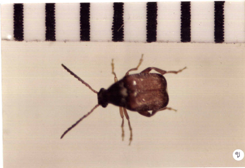
ภาพที่ 1. ตัวเต็มวัยของด้วงถั่วเขียว