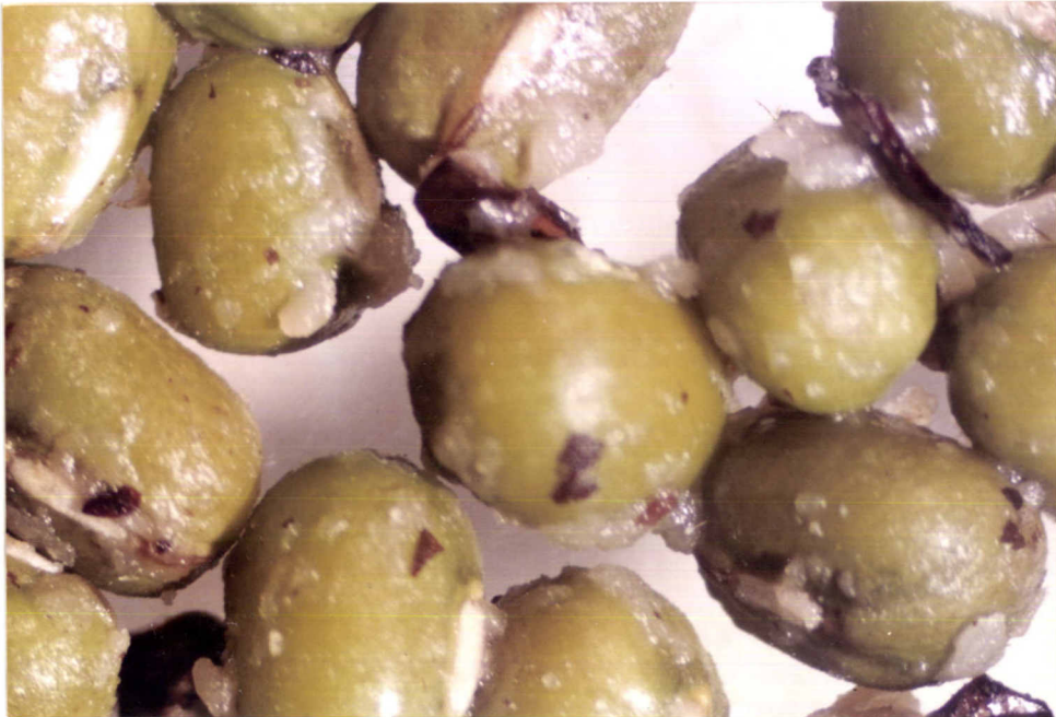
ภาพที่ 4. ลักษณะของเมล็ดตะขุขบตะเอยตคลุกในเมล็ดถั่วเขียวเพื่อใช้ในการทดสอบประสิทธิภาพของการป้องกันกำจัดด้วงถั่วเขียว