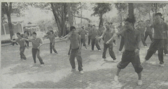
รูปแบบของกิจกรรมภาคปฏิบัติต่างๆ

โดยพบว่าตัวเลขผู้เข้าเรียนในระดับปฐมวัยมีจำนวนลดลง จากประมาณ 96 เหลือ 87 และระดับประถมศึกษาลดลงจาก 102 เหลือ 96 แม้ตัวเลขผู้เข้าเรียนชั้นมัธยมต้นและมัธยมปลายจะเพิ่มขึ้น แต่สัดส่วนผู้เรียนในระดับอาชีวศึกษาที่คาดหวังให้เพิ่ม เพื่อให้ประเทศมีบุคลากรวัยแรงงานที่มีความภาพ กัลป์มี