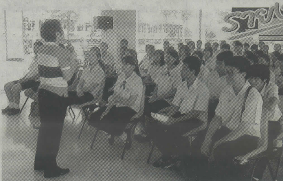
จากการสัมผัสจริง ไม่ว่าจะเป็นการทำกิจกรรม การทำงาน การสื่อสาร หรือการแสดง ฯลฯ เป็นการเรียนรู้ที่มีความสอดคล้องเหมาะสมกับพฤติกรรมและความต้องการของเด็กและเอื้อต่อการพัฒนาเด็ก

ตัวเลขเท่าเดิม คือ สายสามัญ 60 อาชีวะ 40 ถึงแม้ผู้เรียนระดับมหาวิทยาลัยจะเพิ่มขึ้นจาก 22 เป็น 34 แต่ในปี 2551 มีผู้เรียนจบมาแล้วทำงานกว่า 1.4 แสนคน และยังพบอีกว่าผลสัมฤทธิ์ทางการเรียนของผู้เรียนแต่ละระดับและต่ำกว่าเกณฑ์มาตรฐาน โดยพบว่าผลสอบ O-Net ต่ำกว่าค่าเฉลี่ยร้อยละ 50 ทั้งในระดับประถมศึกษาปีที่ 6 ที่มีค่าเฉลี่ยเพียง 36-49 และระดับมัธยมศึกษาปีที่ 6 มีค่าเฉลี่ยเพียง 34-50 ในขณะที่การประเมินผลของ PISA พบว่า ด้านการอ่าน คณิตศาสตร์ วิทยาศาสตร์ และกระบวนการแก้ปัญหาของเด็กไทยยังต่ำกว่ากลุ่มประเทศ OECD และจากการเปรียบเทียบความสามารถในการแข่งขันพบว่าประเทศไทยจะอยู่ลำดับที่ 43 จาก 55 ประเทศ ซึ่งเป็นอันดับที่คงที่มานานถึง 10 ปี ข้อมูลนี้จึงสะท้อนให้เห็นว่าประเทศไทยมีปัญหาด้านคุณภาพของผู้เรียน