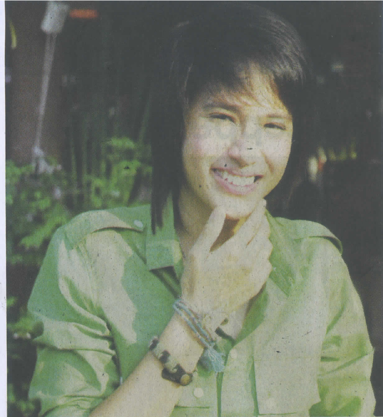
หล่อกว่าผู้ชายบางคนชะอีก