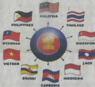
รูปที่ 2 ฝั่งของอาเซียนประกอบด้วย: ฟิลิปปินส์, มาเลเซีย, ไทย, พม่า, สิงคโปร์, เวียดนาม, บรูไน, กัมพูชา, ลาว, อินโดนีเซีย

เนื่องจากสามารถแก้ปัญหาด้านการขาดแคลนแรงงาน รวมทั้งค่าแรงที่ปรับตัวสูงขึ้นด้วย