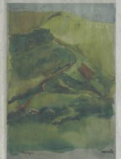
ภูเขาร่องกล้า

"ส่วนภาพอีกชุดประกอบไปด้วยภาพพระราชวังจิตรลดา ภาพสถานีรถไฟมีกะตั้น ภาพปากคลองตลาด ภาพสวนรมณีย์ภาค เป็นภาพที่ผมคัดอิงตอนกลางคืน ภาพจะเป็นโทนสีเดียวกับหมดเลย แต่แปลกดี นอกจากนั้นก็จะ