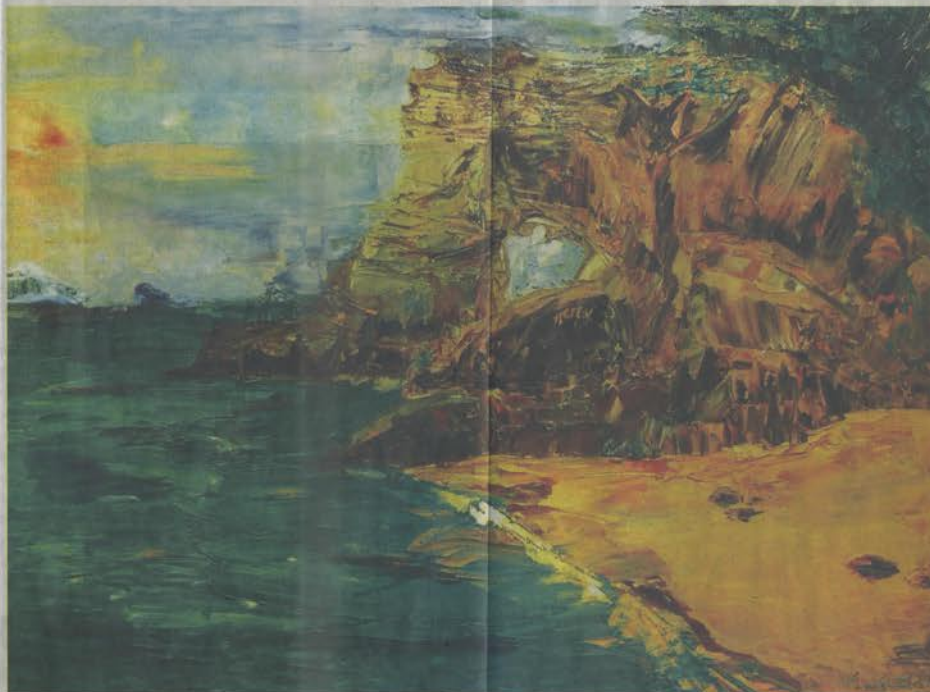
ผลงาน หลวงทะเล ท่าเรือ

เล็กพูดถึงภาพเขียนของเขาที่ละภาพอย่างสนุก "กว่าจะเลือกภาพมาจัดแสดงในครั้งนี้อย่างเดียว ผมชอบภาพที่ผมวาดทุกชิ้น พยายามเลือกอยู่นาน ในที่สุดก็ออกมาเป็นภาพทั้งหมดที่เห็นในทะเล ภาพวาดโรงอาหารนี่ผมวาดตอนเรียนที่ลาดกระบัง เจ้าของโรงกระแะต้นนี้ คือ คุณลุงที่ขายอาหารอยู่ในโรงอาหาร เราจะบรรจุกาแฟนมทุกวัน พอเห็นรถคันนี้แปลว่าพวกลุงจะได้กินของอร่อยกันแล้ว"