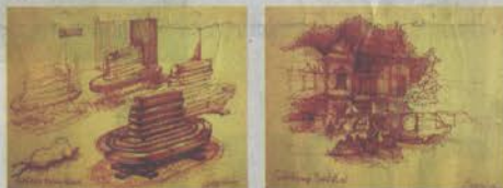
สถานีรถไฟกะตั้น