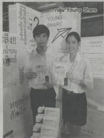
กลุ่ม Young Share