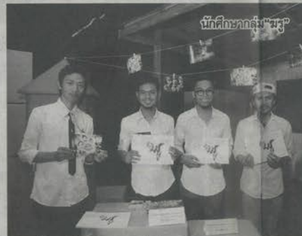
นักศึกษาหลักสูตร “มจร”

ประเทศไทยที่เข้มแข็งและน่าอยู่ไปด้วยกัน สำหรับในปีนี้ โครงการได้มาเจอปัญหาสังคมที่สำคัญ 2 ประเด็น ได้แก่ ปัญหาด้านทรัพยากรน้ำ และป่า ซึ่งเป็นวิกฤตสำคัญที่ประเทศกำลังประสบอยู่ และประเด็นการเรียนรู้ในโลกยุคใหม่