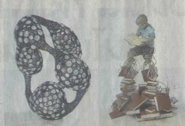
"พระมหากษัตริย์คุณไม่มีที่สิ้นสุด" ผลงาน "ประติมากรรมดีเด่น"