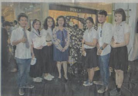
ทีม SCULPTURB 68

ตัดสิน ผลปรากฏว่า ผลงาน "หนังสือของพ่อ" ของทีม SCULPTURB 68 จากมหาวิทยาลัยศิลปากร คว่ำรางวัล "ประติมากรรมยอดเยี่ยม" ไปครอง รับทุนการศึกษา 300,000 บาท โล่เกียรติยศ ประกาศนียบัตร และอาจารย์ที่ปรึกษารับเงินรางวัล 5,000 บาท ส่วนผลงาน "พระมหากษัตริย์คุณไม่มีที่สิ้นสุด" ของทีม Sculpture.NU.3 จากมหาวิทยาลัยบูรพา คว่ำรางวัล "ประติมากรรมดีเด่น" รับทุนการศึกษา 100,000 บาท โล่เกียรติยศ ประกาศนียบัตร และอาจารย์ที่ปรึกษารับเงินรางวัล 10,000 บาท