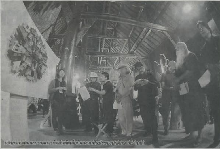
บรรยากาศคณะกรรมการคัดเลือกผลงานศิลปะของนักศึกษาที่บ้านดำ

แต่ละวันของค่ายเยาวชน นักศึกษาทุกคนดูจะมีความมุ่งมั่น ตั้งใจ ทำผลงานชิ้นใหม่อย่างจริงจัง ทั้งทั้งงาน