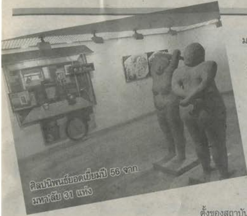
ศิลปินพันธ์ยอดเยี่ยมมี 56 จาก มหาวิทยาลัย 31 แห่ง

มหาวิทยาลัย ทุกวัน นี้สถาบันการ ศึกษาแต่ละ แห่งมีการจัด นิทรรศการ แสดงผลงาน ศิลปินพันธ์ ของนิสิต นักศึกษา ของตน ในสถานที่