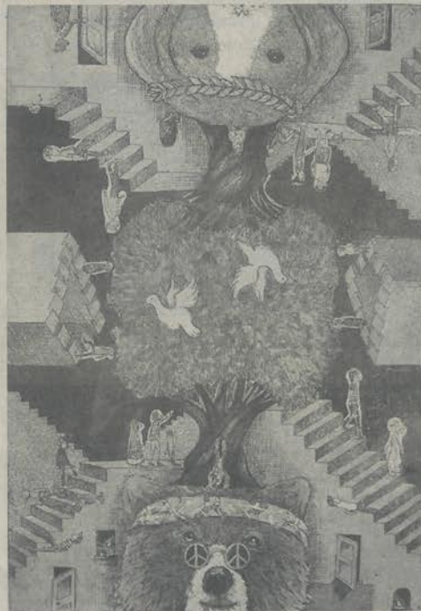
"ยูโทเปียหมายเลข 03 : วังวนสู่สันติภาพ" ภาพพิมพ์โลหะชิ้นเยี่ยม

คลัสเตอร์ใหม่เหล่านั้น หอศิลปสมเด็จพระนาง เจ้าฯ จึงคอยอำนวยความสะดวกในการสนับสนุนส่งเสริม ศิลปินรุ่นใหม่อีกครั้ง ซึ่งทำงานร่วมกับสถาบัน การศึกษาทั่วไทยที่เปิดการเรียนการสอนในด้าน ศิลปะ คัดเลือกผลงานศิลปินพันธ์ที่ยอดเยี่ยม ของแต่ละสถาบันมาจัดแสดงร่วมกันทีเดียว 3 ชั้นของหอศิลป์ฯ บนถนน ราชดำเนินกลางแห่งนี้จึงเต็มไปด้วยผลงาน