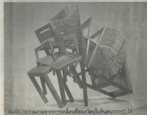
สัมพัทธ์ "ความงามจากการเคลื่อนไหวของวัตถุในจินตนาการ" ได้