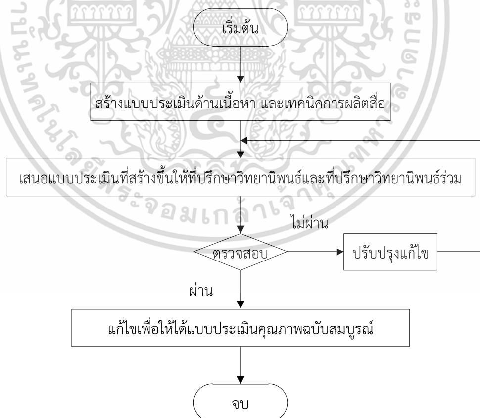
ภาพที่ 3.2 ขั้นตอนการสร้างแบบประเมินบทเรียนผ่านเครือข่ายอินเทอร์เน็ต

4. นำแบบประเมินคุณภาพของบทเรียนผ่านเครือข่ายอินเทอร์เน็ตที่ประเมินแล้วแต่ละด้านมาวิเคราะห์หาค่าเฉลี่ย ( \bar{X} ) และค่าเบี่ยงเบนมาตรฐาน (S) ซึ่งในการประเมินนั้น จะต้องได้ระดับคุณภาพดีขึ้นไป ( \bar{X} \geq 3.50 ) จึงถือว่าผ่านเกณฑ์การประเมินจากผู้ทรงคุณวุฒิ