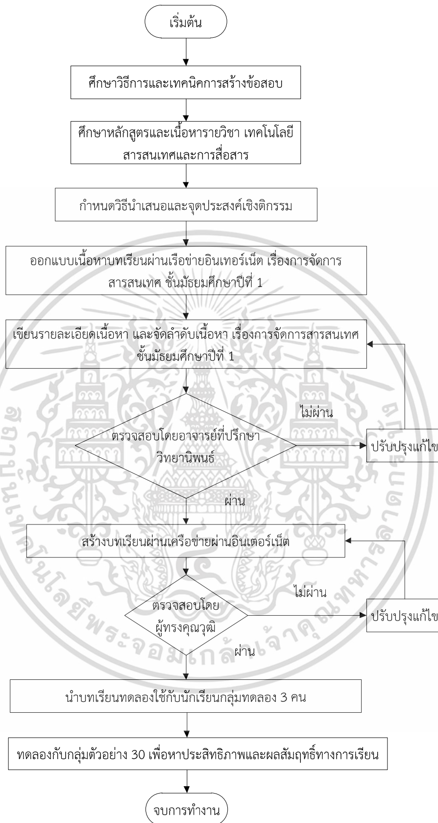
ภาพที่ 3.1 ขั้นตอนการสร้างบทเรียนผ่านเครือข่ายอินเทอร์เน็ต

เอกสารนี้เป็นเอกสารที่สงวนไว้สำหรับการใช้งานเพื่อการศึกษาเท่านั้น ไม่อนุญาตให้นำไปใช้ประโยชน์ด้านการค้า ไม่ว่าจะกรณีใดๆทั้งสิ้น อีกทั้งห้ามมิให้ดัดแปลงเนื้อหา และต้องอ้างอิงถึงเจ้าของเอกสารทุกครั้งที่มีการนำไปใช้