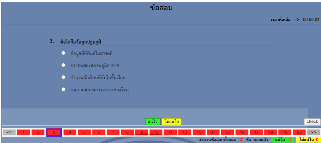
ภาพที่ จ.5 แสดงหน้าจอแสดงแบบทดสอบก่อนเรียนและหลังเรียน