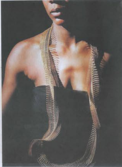
สร้อยสวยหรูจากขวดพลาสติก

ชาวซาฮาราวิส เป็นชาวทะเลทรายที่เร่ร่อนอยู่ทางฝั่งตะวันตกของทะเลทรายซาฮารา หลังจากถูกรัฐบาลของประเทศโมร็อกโกเข้ายึดครองพื้นที่ในปี 2518 ชาวซาฮาราวิสถูกเนรเทศไปยังส่วนที่เร่ร่อนของทะเลทรายอัลจีเรียซึ่งจัดเป็นค่ายอพยพ