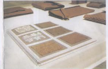
เครื่องเขียนจากชิ้นหัก

ผลิตภัณฑ์นี้ใช้กรรมวิธีการผลิตที่ง่ายและไม่ต้องการเครื่องมือซับซ้อน ทั้งยังสามารถออกแบบให้มีสีและความหนาได้ตามความต้องการของผู้ออกแบบ ไอเดียเด็ด ดีไซน์เท่เก๋ไม่น้อยเลยทีเดียว