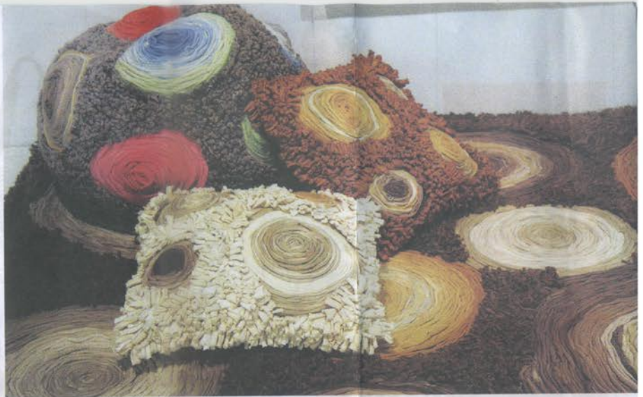
หมอนอิง พรม ในคอลเลกชัน วงปีไม้

ใครที่เคยมองขวดน้ำพลาสติกว่าเป็นของเหลือใช้ คิดไม่ออกว่าจะนำไปทำอะไรต่อดี เห็นอย่างนี้แล้วคงไม่มองไม่ห่าง ขึ้นมาบ้าง