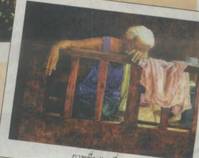
ภาพชื่อ “เหนียว”

“การที่ได้รับรางวัลเหรียญทองครั้งนี้รู้สึกดีใจมาก และถือเป็นรางวัลสูงสุดในชีวิตของผมในตอนนี้ ที่ได้สร้างสรรค์งานวาดภาพมาตั้งแต่อนุบาล โดยยึดต้นแบบการวาดภาพจากคุณพ่อซึ่งเป็นศิลปินในดวงใจของผมครับ นอกจากนี้จะฝึกวาดภาพที่บ้านกับคุณพ่อแล้ว ผมก็จะฝึกที่โรงเรียนอีกด้วย โดยมีอาจารย์คอยสอนและแนะนำหลักการวาดภาพให้สวยงามและที่ผ่านามา ผมเคยได้รับรางวัลชนะเลิศดีเด่นจากการประกวดวาดภาพหัวข้อความฝันอันสูงสุด ของ ปตท. มาแล้ว โดยครั้งนั้นได้วาดภาพการทำบุญ